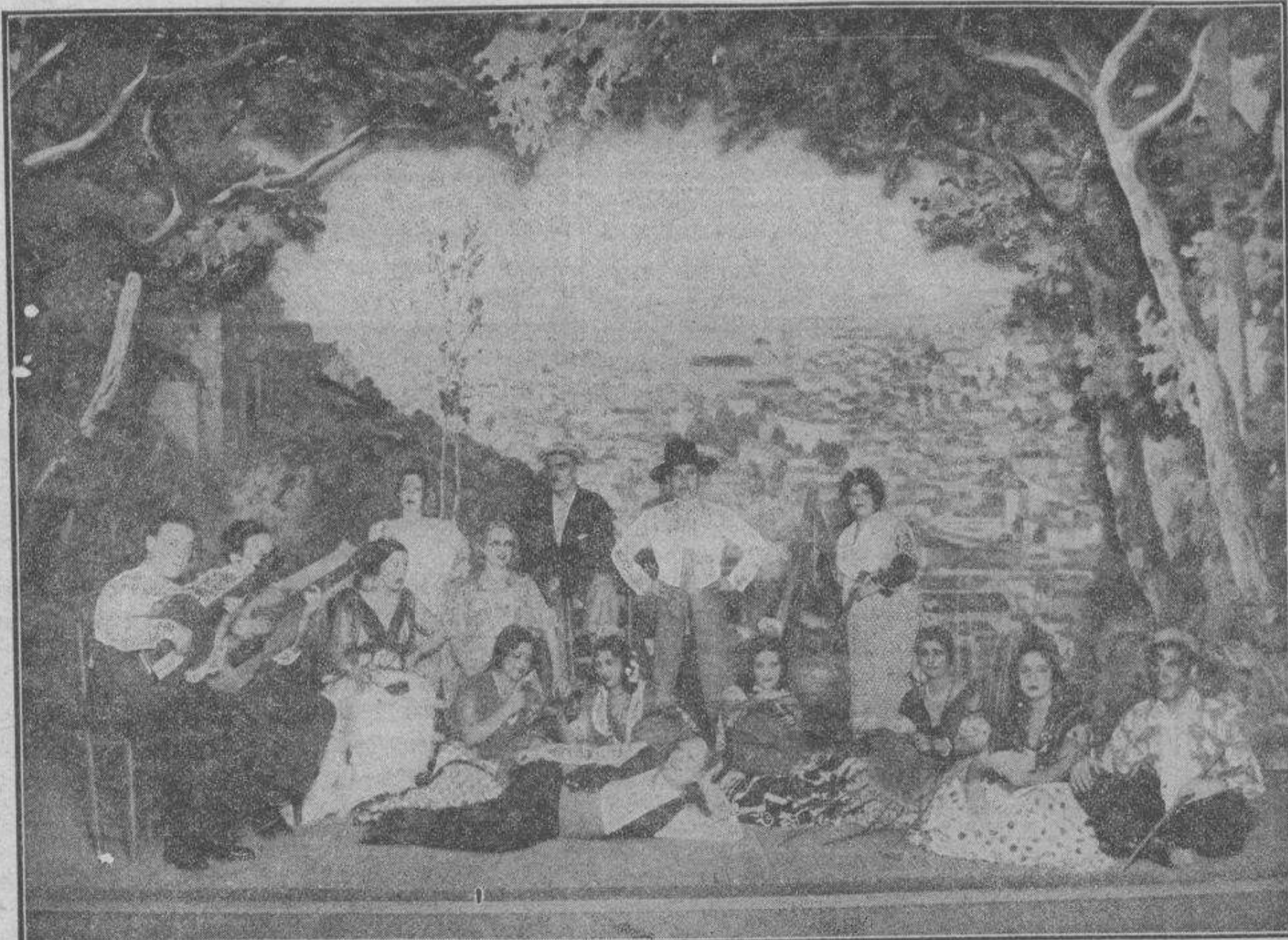
Uno de los magníficos cuadros de "La zambra de Chorro Jumo", comedia en dos actos que se representa todas las noches en el Monumental Cinema con grandioso éxito.

El argumento, por lo manido—en la pantalla, en el teatro, en la literatura—tiene franca categoría de lugar común. Y es lástima que así suceda, porque de otro modo la poesía que en el orden técnico posee en grado considerable esta producción se hubiese visto asistida de la que encierra un "escenario" original y la resultante habría sido un film excepcional. Con esto y todo, en algunos momentos "María" alcanza estirpe de verdadero cine. La escena final—y no silenciemos la afortunada actuación de Annabella en este momento—es