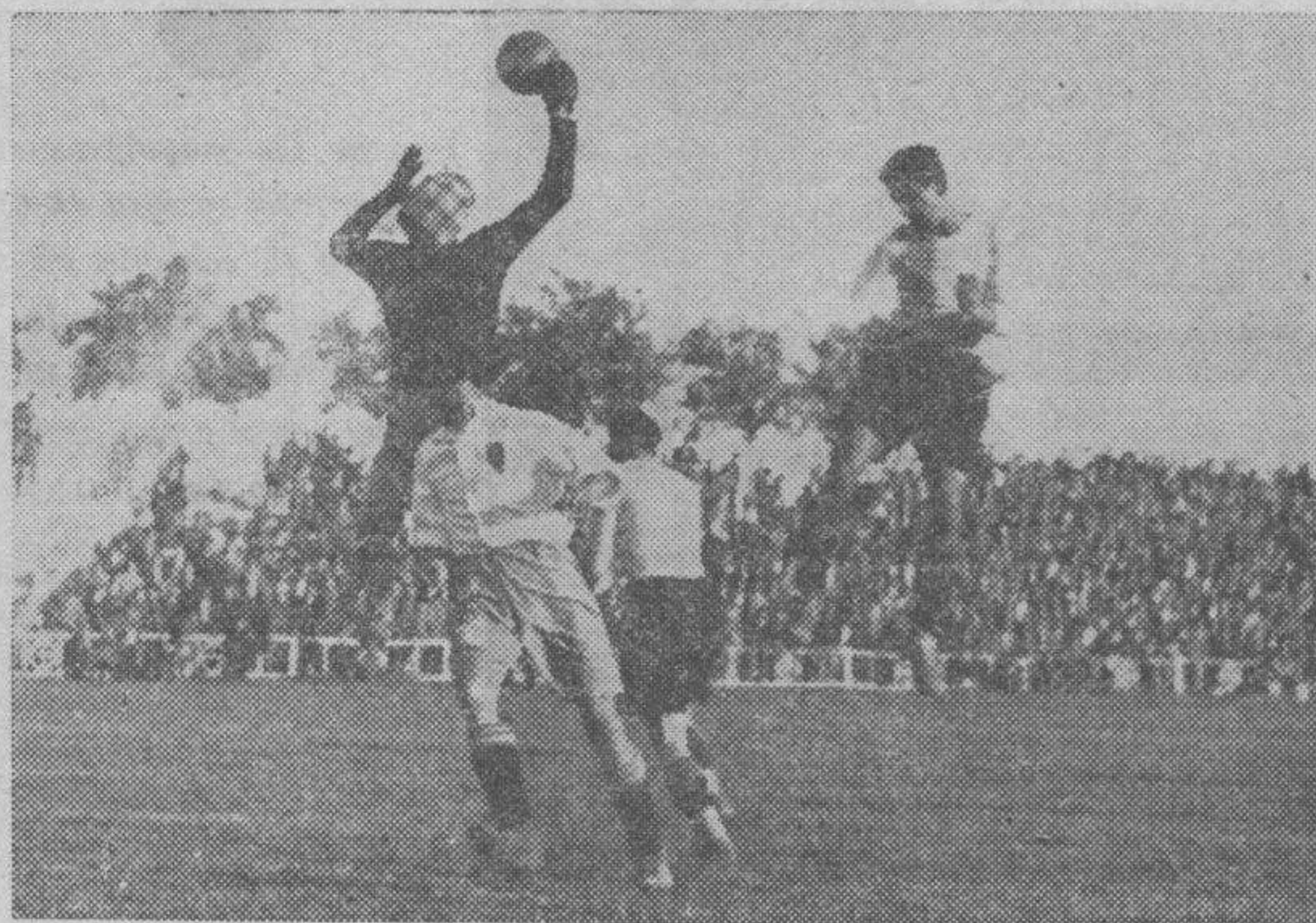
Una interesante jugada del partido jugado anteayer entre el Valladolid y el Zaragoza en el campo de Torrero.