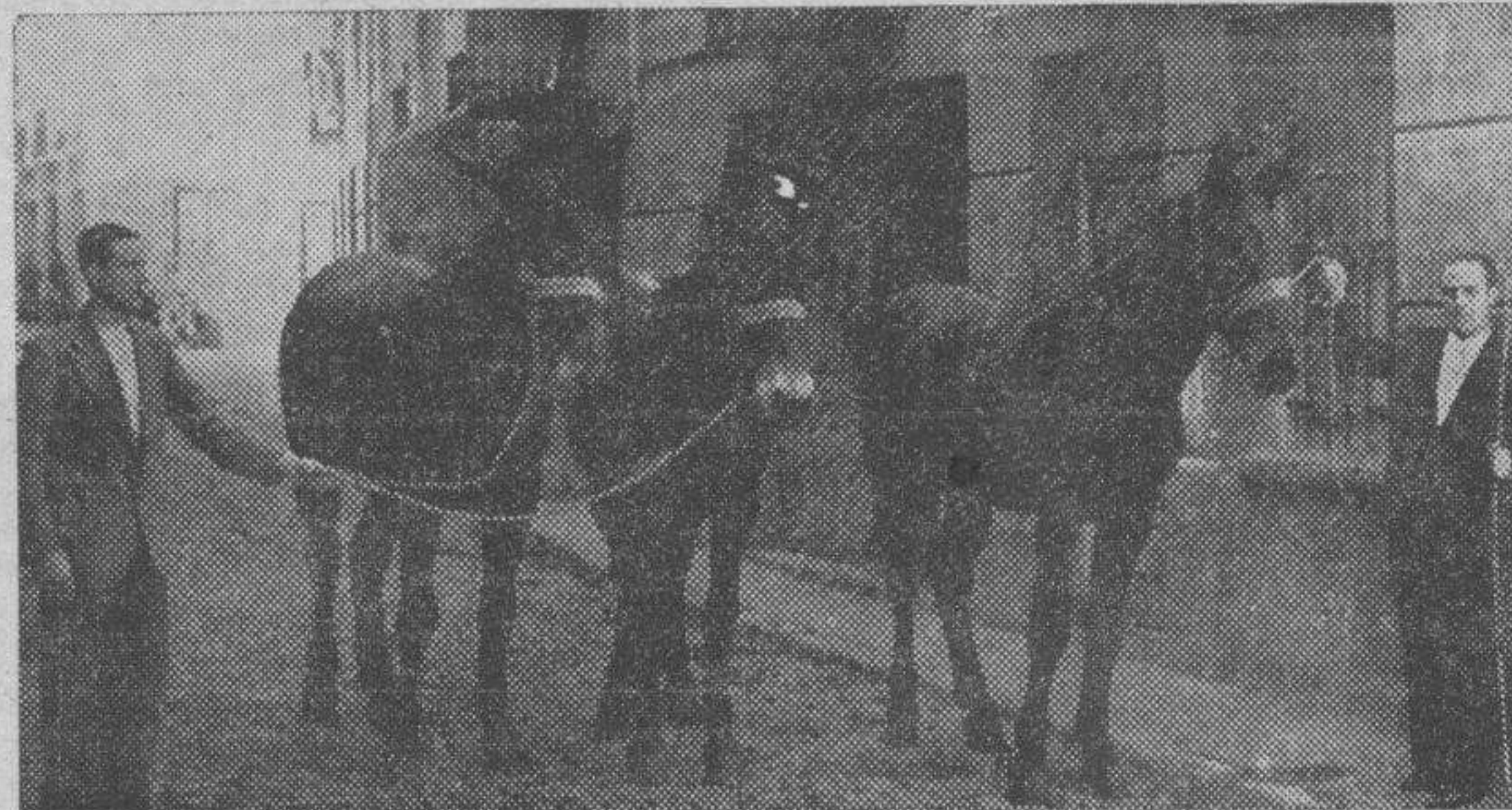
Tres magníficos ejemplares.

Las bestias pagadas al contado a los tratantes en sus establecimientos han alcanzado un precio de 2.800 a 3.200 pesetas.