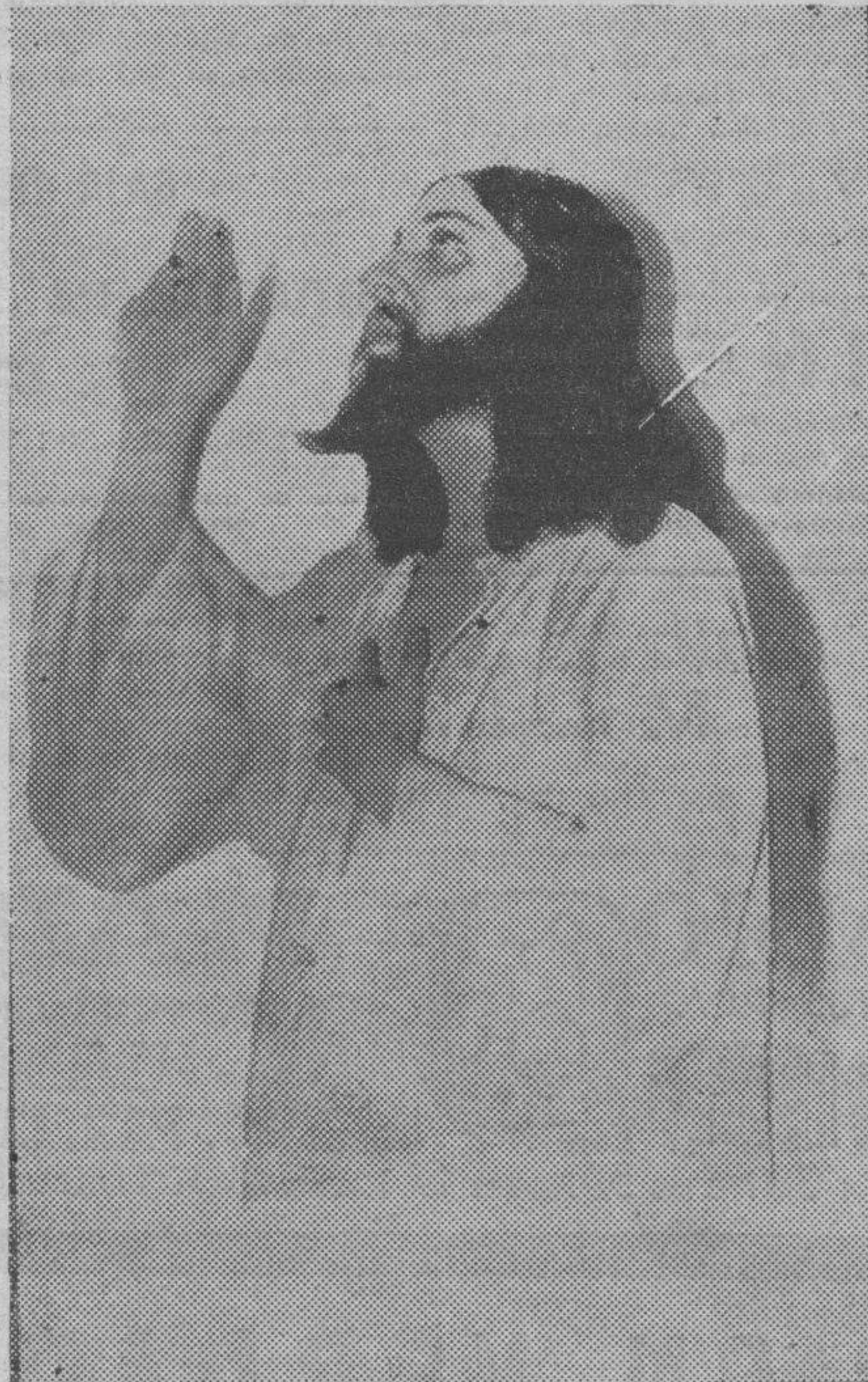
El estreno de ayer en el Circo, "El mártir del Calvario", ha proporcionado al eminente actor Enrique Rambal el mayor triunfo de su vida artística.