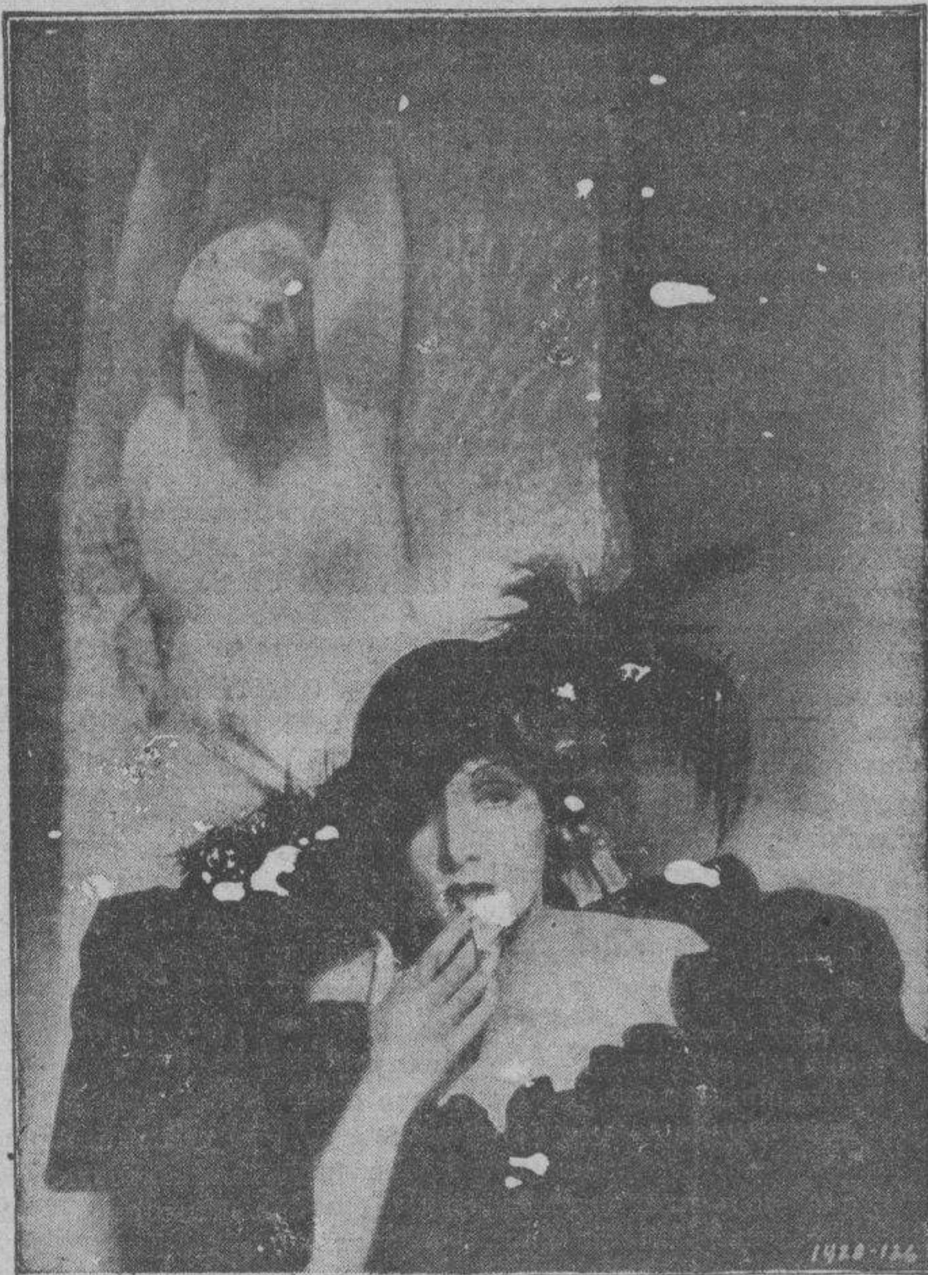
Una escena de la producción Paramount "El cantar de los cantores", en la que su principal intérprete, Marlene Dietrich, realiza un trabajo de modalidad distinta a como la conocimos hasta ahora. En esta producción Marlene se supera sobre cuantas producciones ha realizado.

me mantengo alejada de él... cuando está trabajando en alguna película. Sé perfectamente que dedica cada minuto de su tiempo fuera del estudio a repasar su papel y prepararse a los ensayos del siguiente día frente a la cámara.