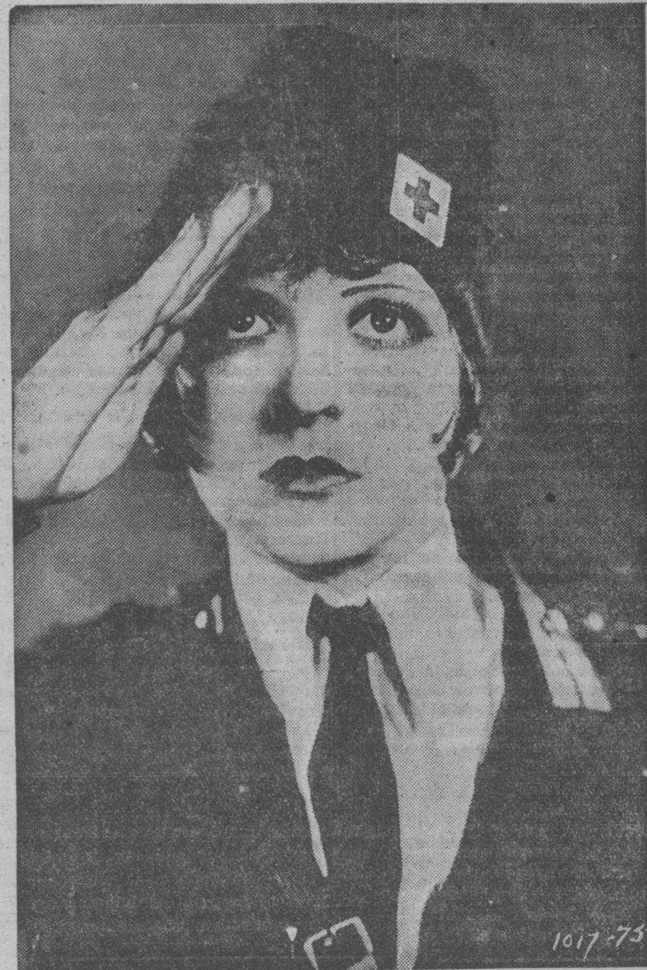
Clarita Bow, la chispeante star, ha enmudecido en cuanto el cine sonoro logró la captación de nuevas figuras. ¿Qué le ha pasado a Clara?

Con una "mises en scene" excelentemente realizada, servida por medios técnicos excepcionales, este film, que su valor moral y filosófico sitúa mucho más alto que la producción conocida hasta ahora, da a Conrad Veidt la oportunidad de confirmar su sentido de composición y su inteligencia. Esta película, que presenta B. C. K. Films, se admirará muy en breve en el Gran Teatro Iris, convertido en cine sonoro.