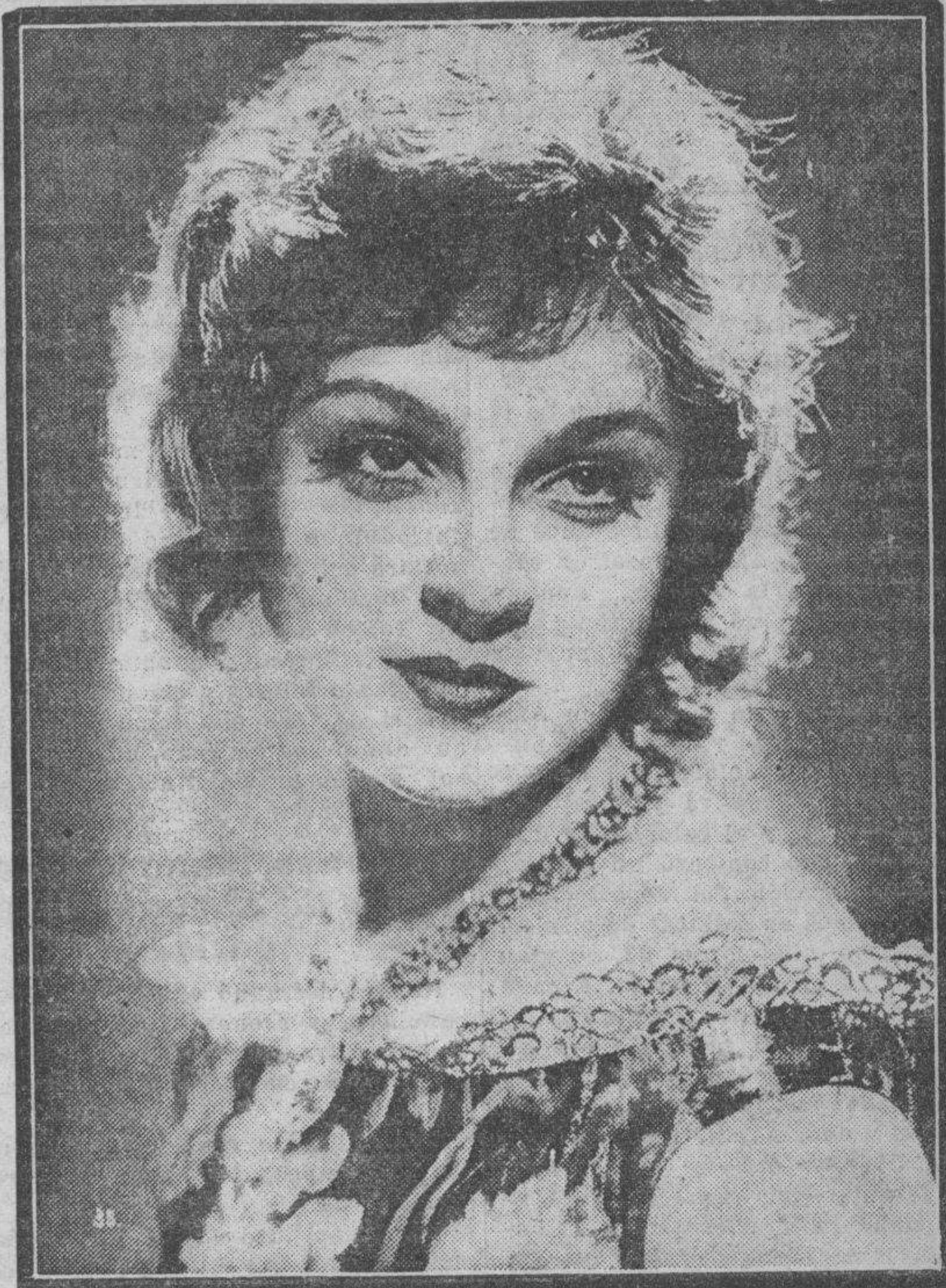
La bella y gran actriz Anna Sten, fiel intérprete de "Karamazoff, el asesino", la joya cinematográfica que admiró Zaragoza.

El argumento de la película es fino, de un gusto extraordinario y de un acierto indiscutible.