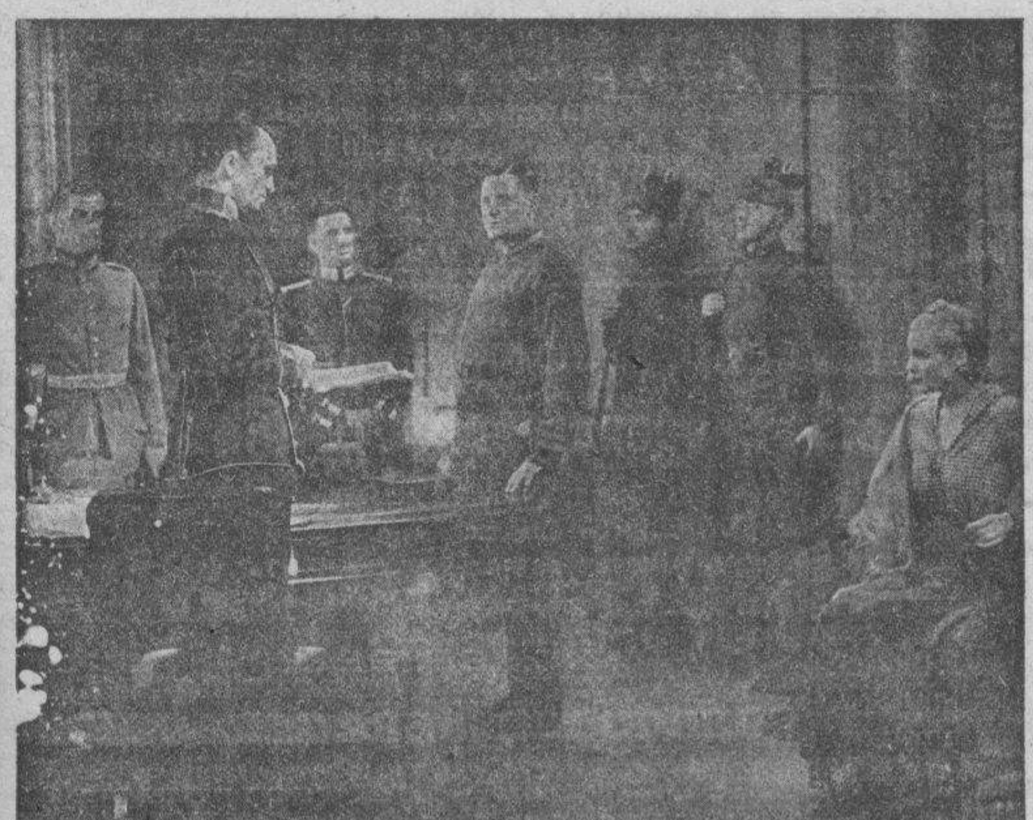
Una interesante escena de "Yo he sido espía", película nueva en su género, de gran intensidad dramática, que es como un vivo documento sensacional hecho carne y acción por una espía auténtica.