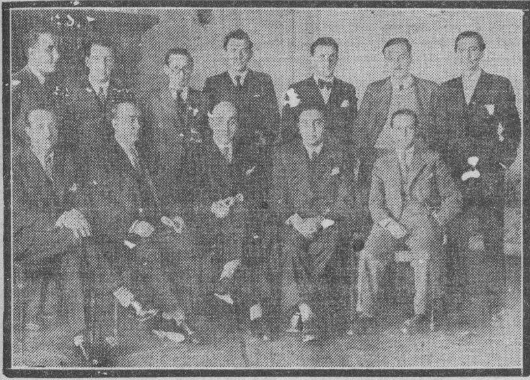
Grupo de jóvenes médicos zaragozanos que han iniciado la publicación de una revista profesional que titulan "Anales Aragoneses de Medicina", doctores reunidos ayer en banquete de celebración por haber salido a la luz el primer número de aquella.