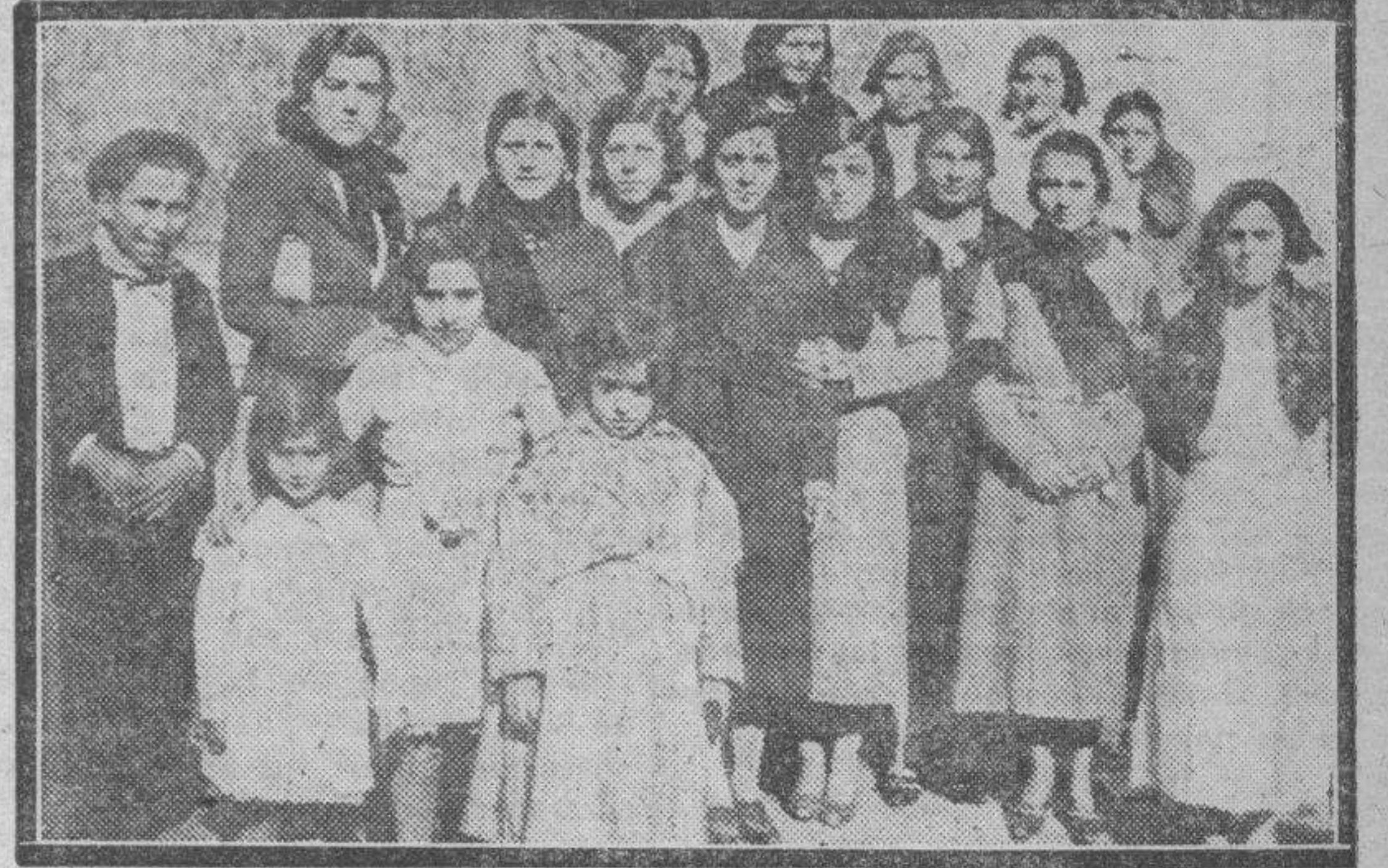
ESCATRON. — Al terminar la solemnisima procesión de Santa Agueda posó ante el Kodak este ramillete de preciosas escatroneras, que con su belleza y encanto han sido el mejor atractivo de las fiestas.