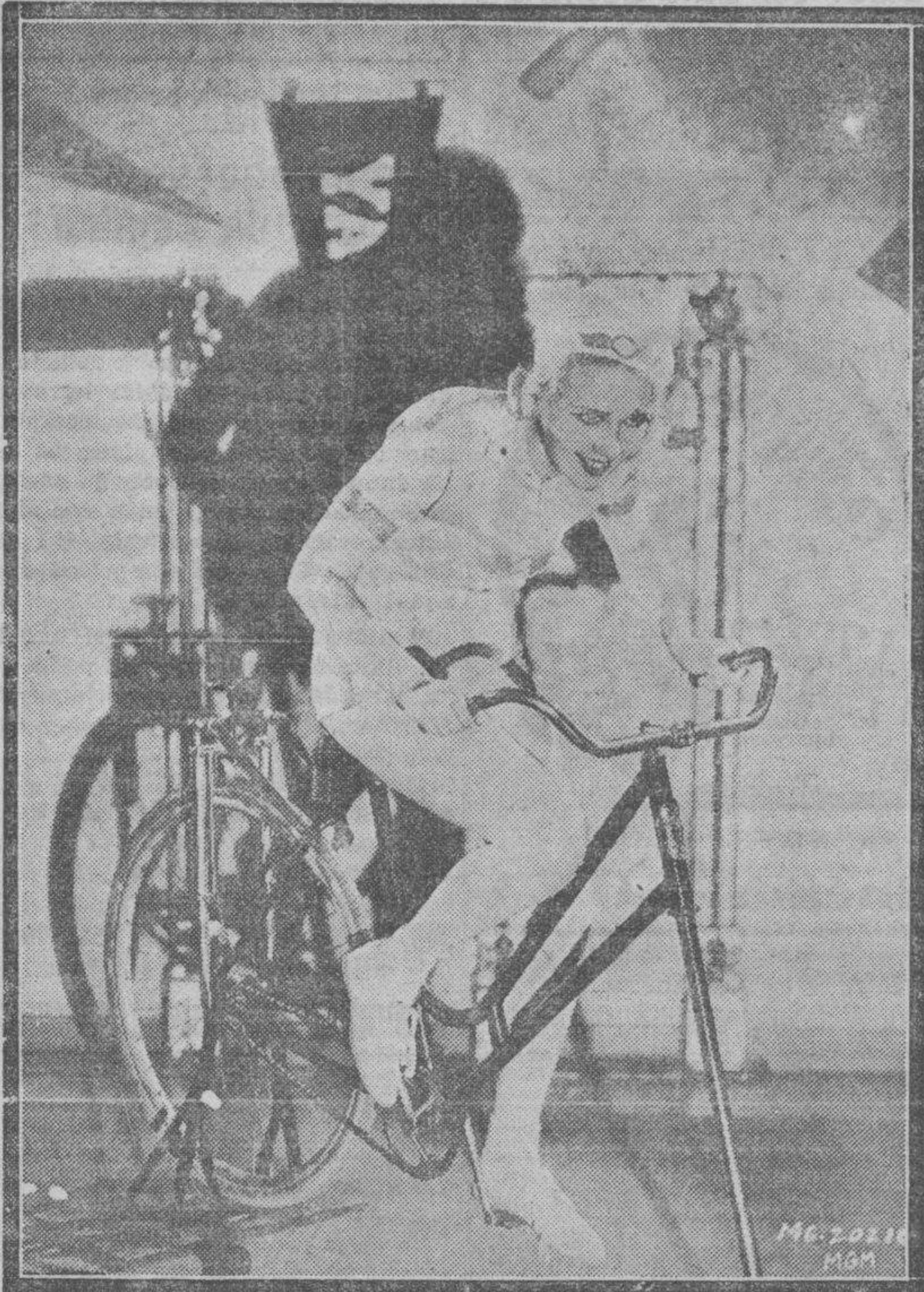
Nada hay tan saludable—dice la bella Anita Page—para conservar la "linea" como el diario ejercicio.