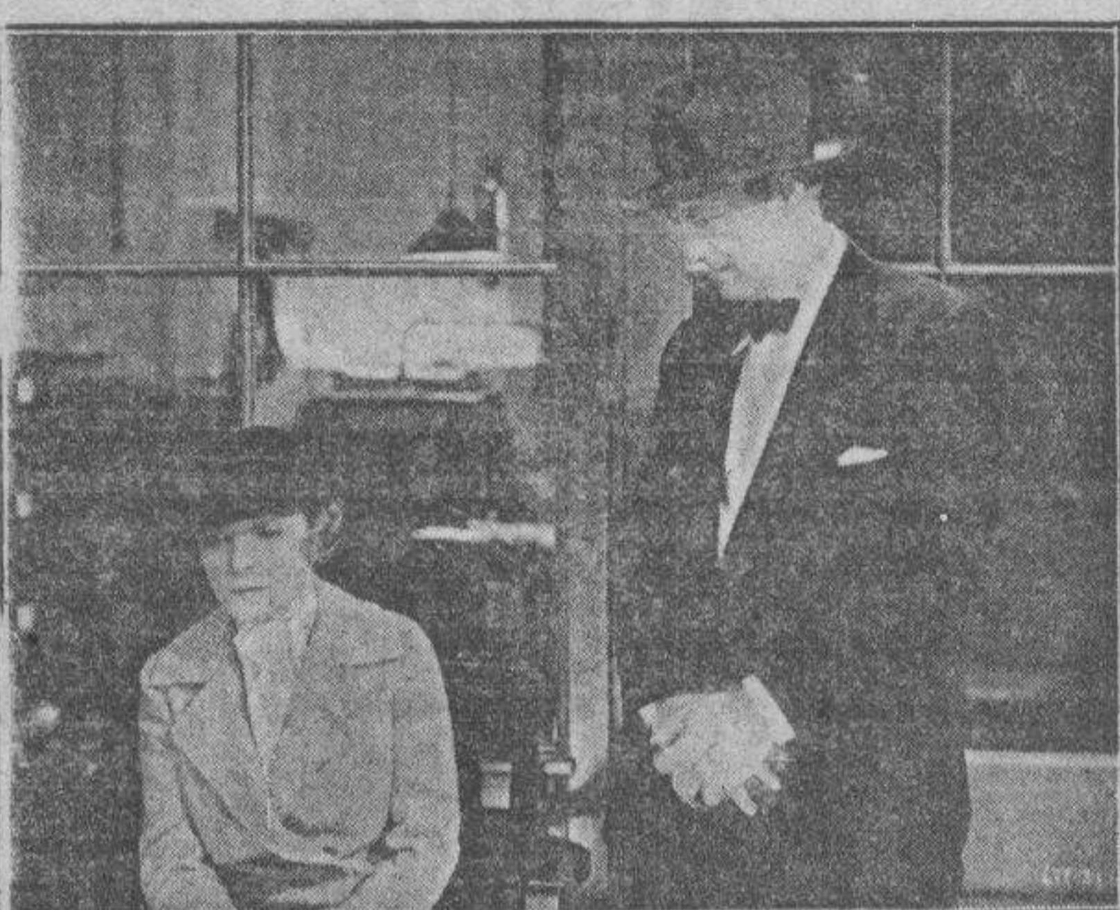
Una escena de "Vuelo nocturno".

RIASE A MANDIBULA SUELTA con GEORGES MILTON