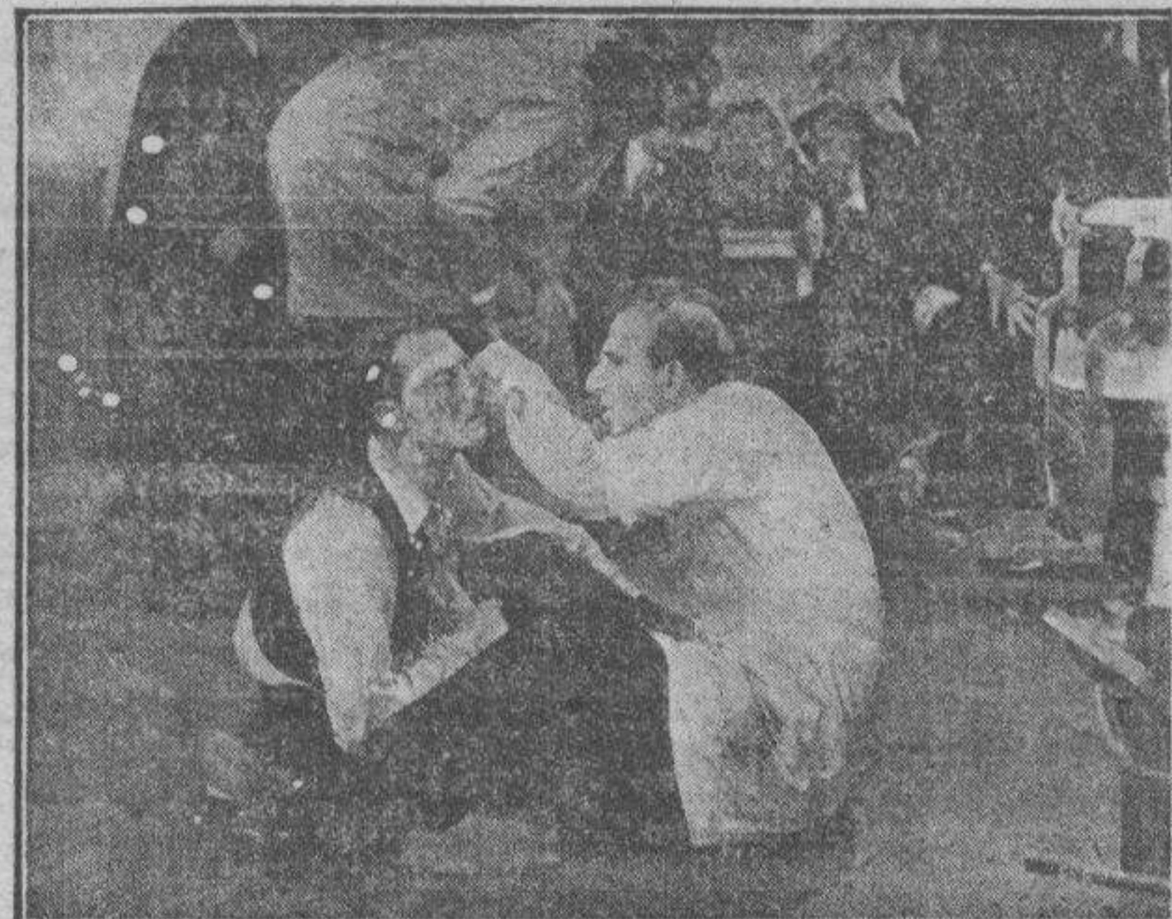
"Queremos cerveza", por Buster Keaton.