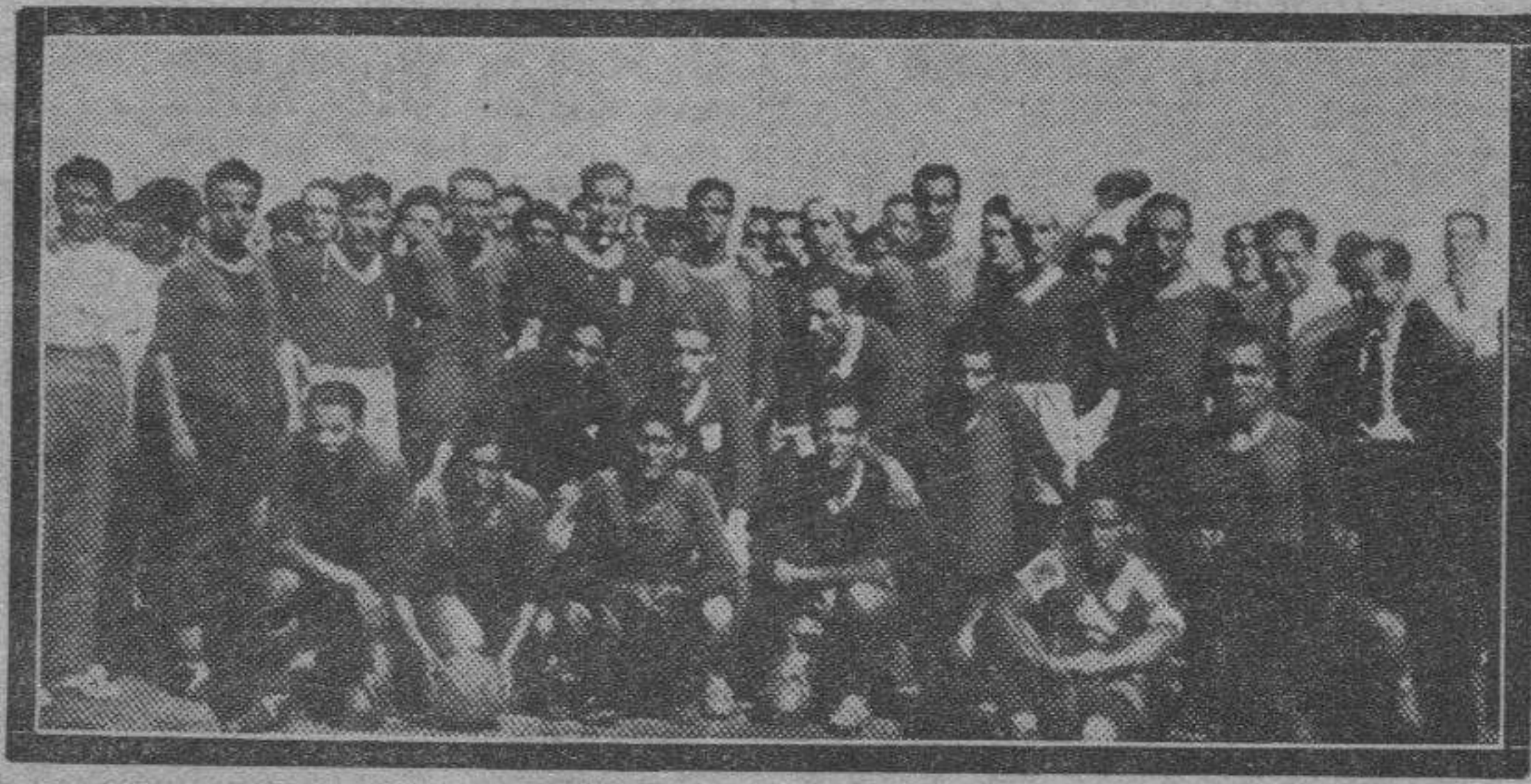
FUTBOL EN EJEA DE LOS CABALLEROS. — Con motivo de las fiestas de esta villa, el domingo se celebró un partido de fútbol entre el titular y el Arenas S. C., de Zaragoza. Los jugadores de los dos equipos antes de empezar el encuentro.

Y en estas dificultades estriba precisamente el mérito de la cesta; ello revela su modernidad y adaptación. Y es por todo eso que el poderío y precisión rematadora del cestemetro deja empuqueñado, corto y falto de soberanía instrumental al remonte.