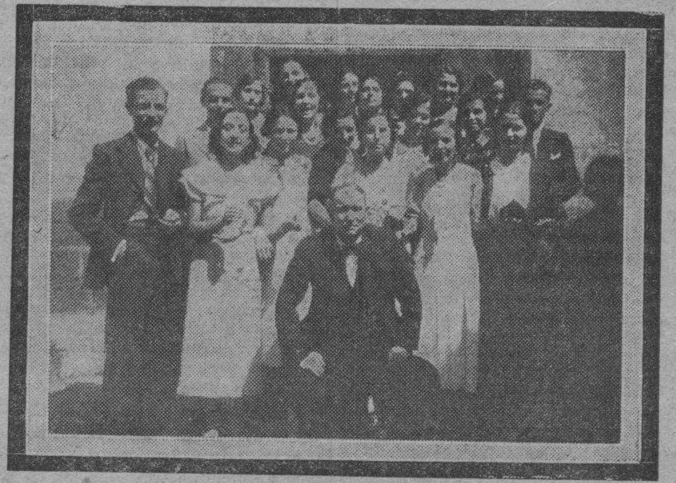
LUNA. — Bellas luneras y bienhumorados jóvenes que han dado la nota brillante en los pasados festejos.