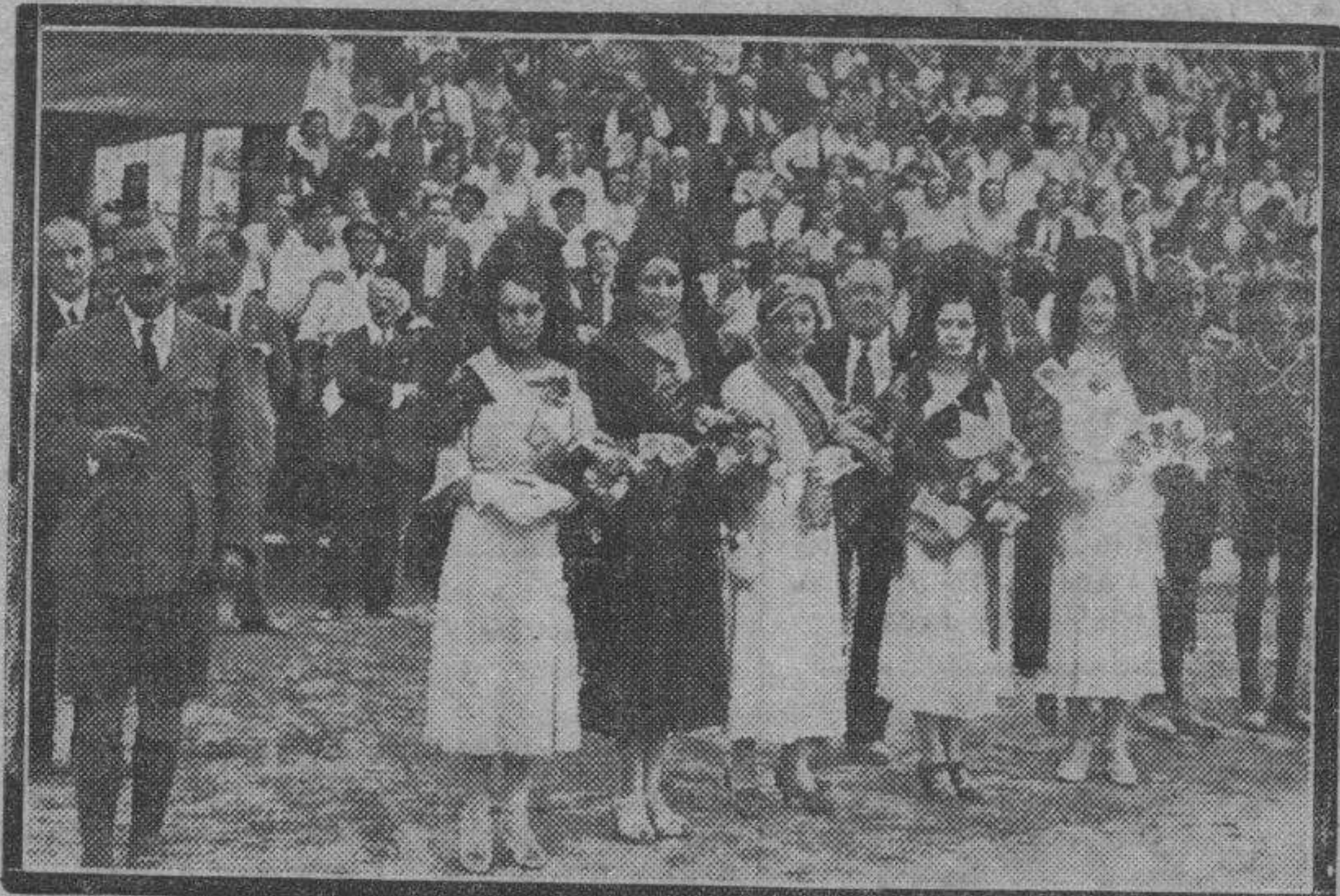
En nuestra edición de ayer dimos cuenta de la fiesta de los Exploradores celebrada en Tarazona. Completamos esa información con esta fotografía, en la que aparecen las bellísimas señoritas que actuaron de madrinan y presidieron el acto de la promesa a la bandera de la Institución.