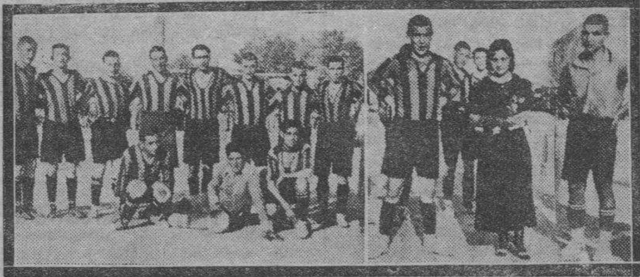
FUTBOL EN TAUSTE. — El "once" titular, que resultó vencedor, y la bella donadora de la copa disputada, junto con los capitanes de los equipos.

Los 3 x 100 m. relevos estilos fueron ganados con facilidad por el