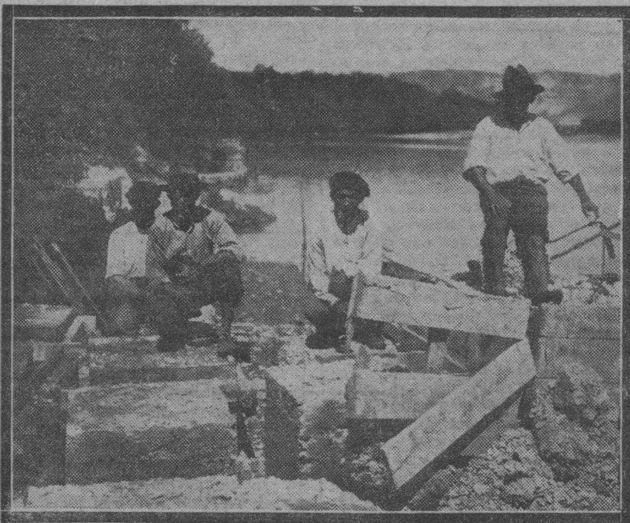
En Utebo ha estallado un petardo en unas obras que se practican para la defensa del río. Los daños causados han sido de gran consideración, porque han caído al agua materiales y herramientas que ha arrastrado la corriente.

Nada, sin embargo, puede predicirse con seguridad de acierto. Y únicamente preguntar si, en efecto, será hoy, al fin, cuando surja la crisis, tan esperada desde hace tiempo.