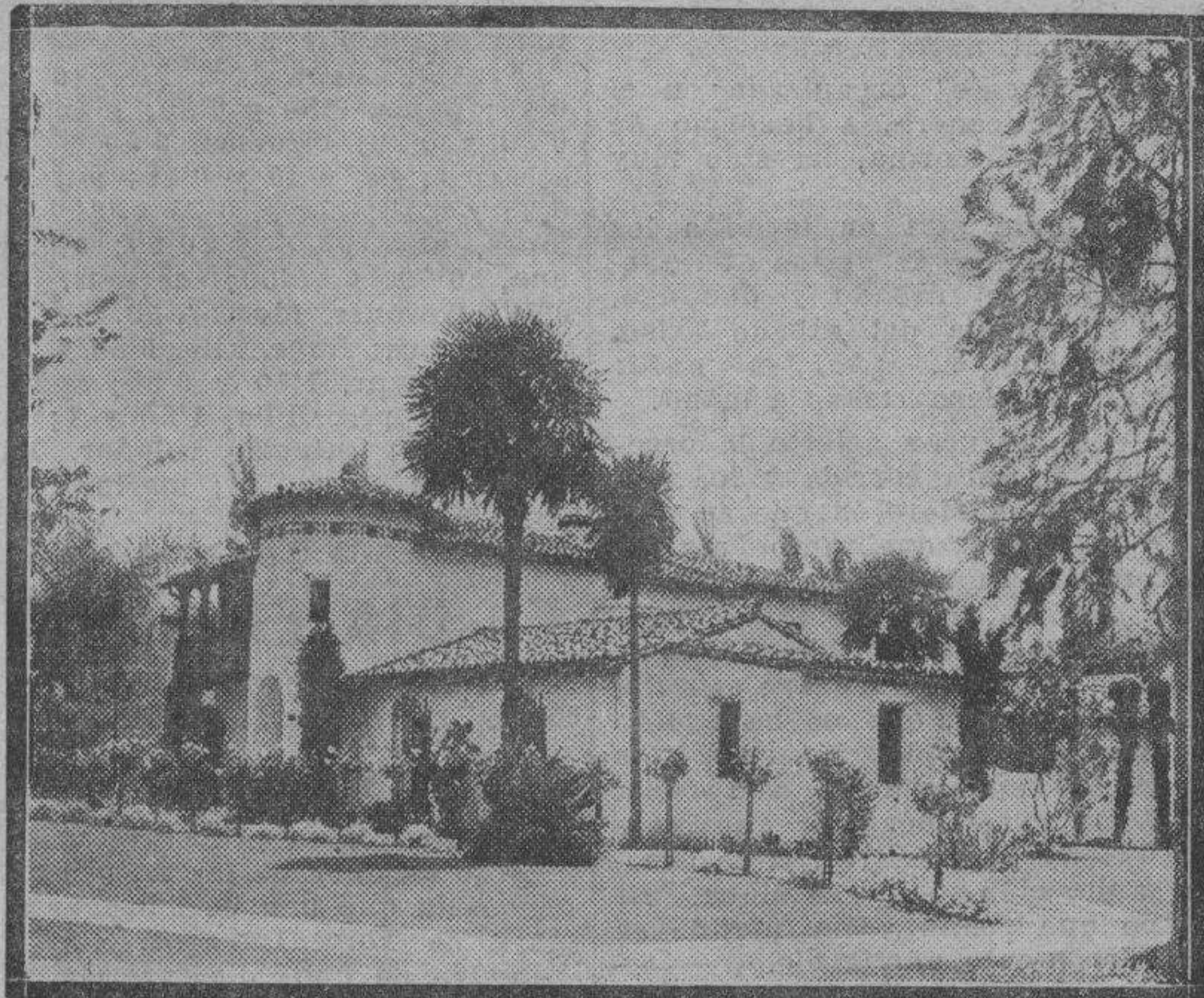
Linda casita ésta, de estilo español, que posee en Beverly Hills el célebre actor de la pantalla Wallace Beery, de la M. G. M.

"Y a la izquierda, señoras y caballeros, detrás de todo ese follaje y de aquel alto seto, está la casa de Miss X, hermosísima "estrella" de la pantalla. Y si miran ustedes con cuidado a la cima de esa colina, descubrirán una esquina de la magnífica residencia de Mr. Z, famoso amante en el cine."