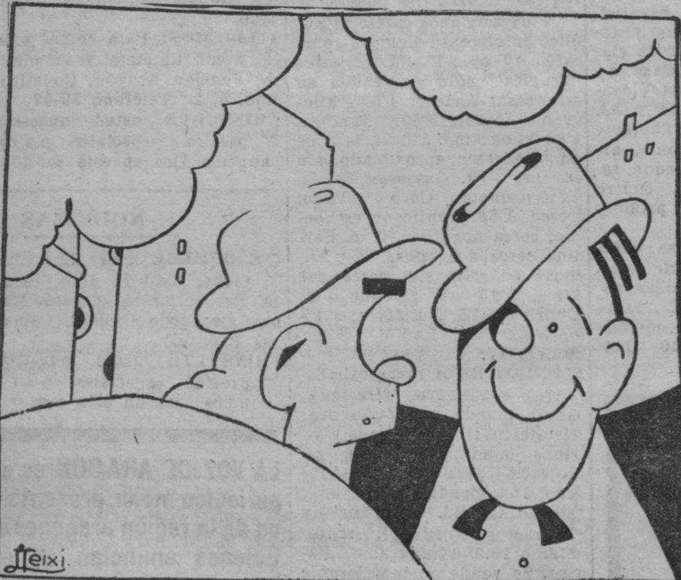
—Eso del "Pancracé" es nuevo en España, ¿verdad? —No. Ya se conocía hace bastante tiempo en la Cámara.