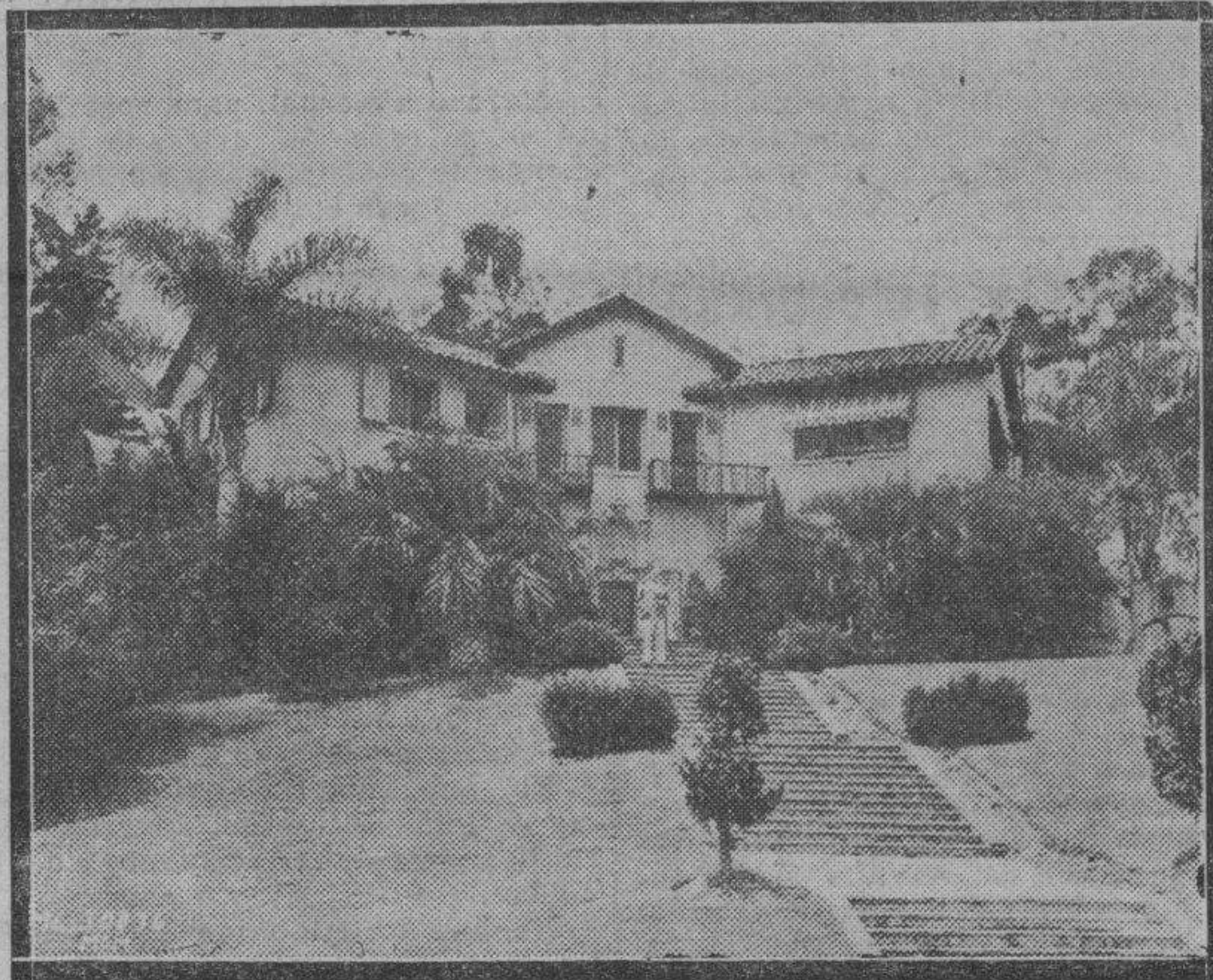
He aquí a Frank Morgan, saliendo satisfecho de su elegante residencia que posee en Beverly Hills, rodeada de palmeras y plantas fantásticas, digno marco de sus jardines deliciosos.

John Barrymore, por su parte, ha elegido para edificar su casa la colina más alta en las cercanías de