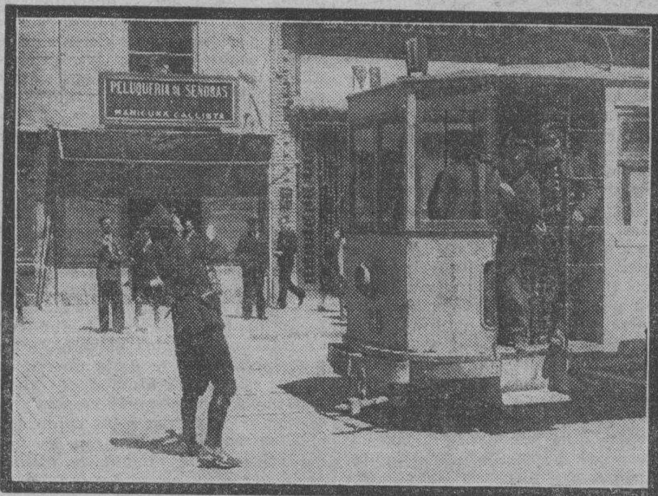
Los guardias de Asalto conduciendo los tranvías durante la tarde de ayer.

Ayer, de madrugada, quedaron reforzados, en previsión de posibles contingencias, los servicios de orden, seguridad y vigilancia.