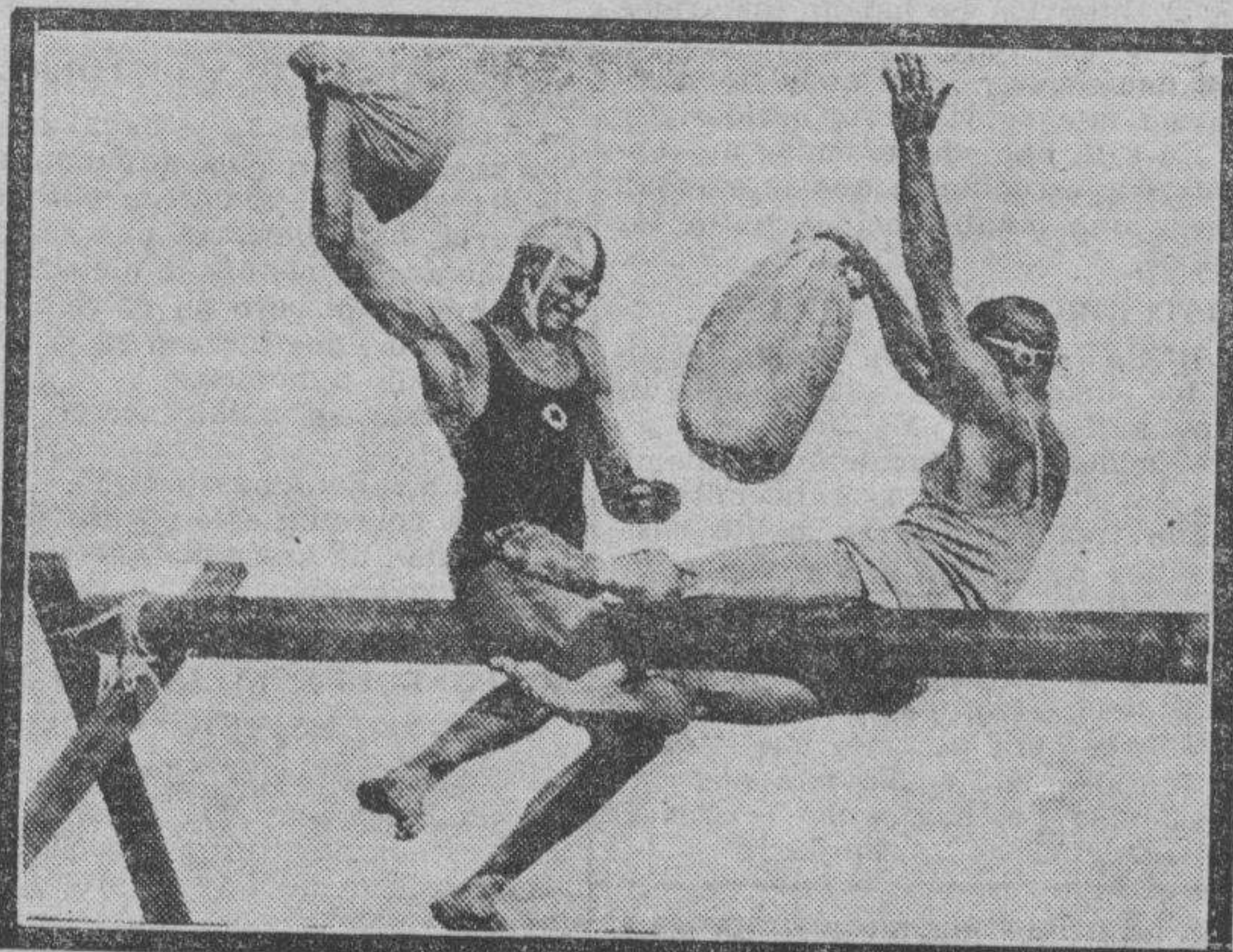
Un nuevo deporte, y sencillísimo además, que hará furor en cuanto por aquí lo pongan en práctica.