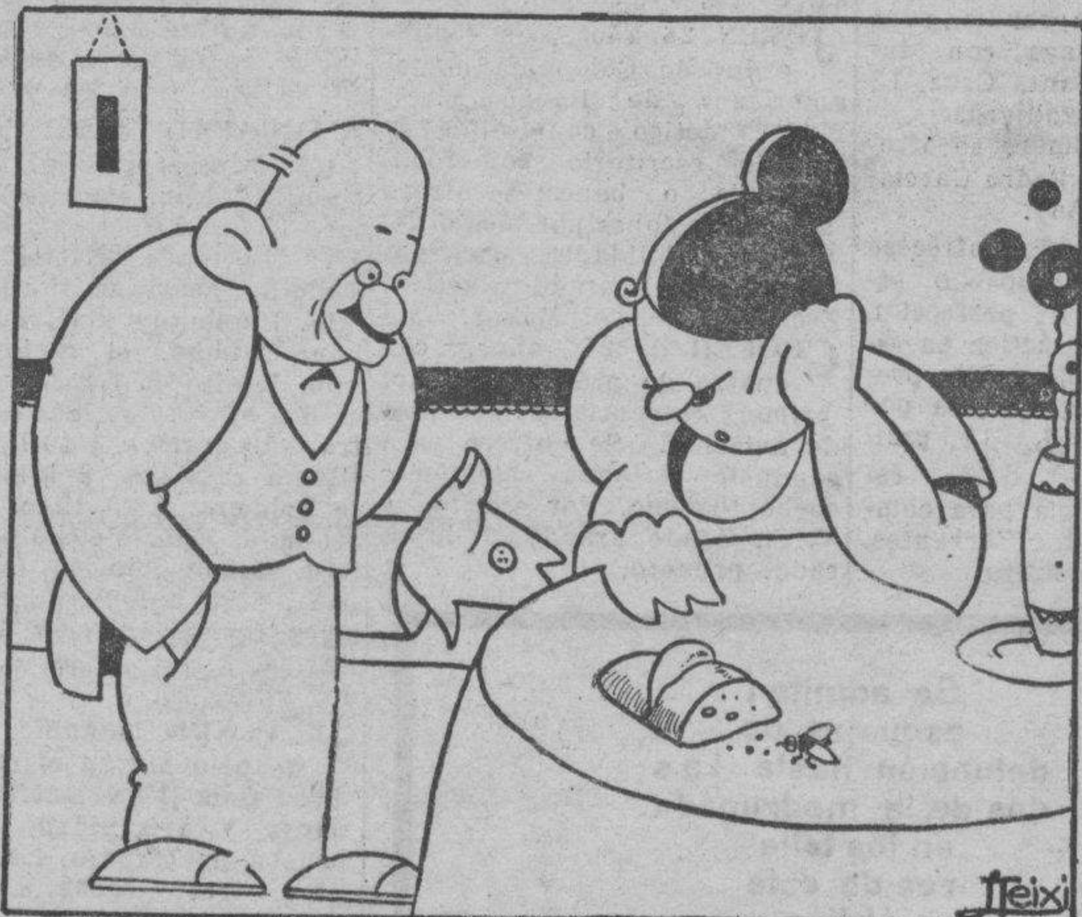
—¡Cómo! ¿Dos pesetas para toda la semana? Ahora mismo me voy al Sindicato de Matrimonios y promuevo la huelga de maridos.