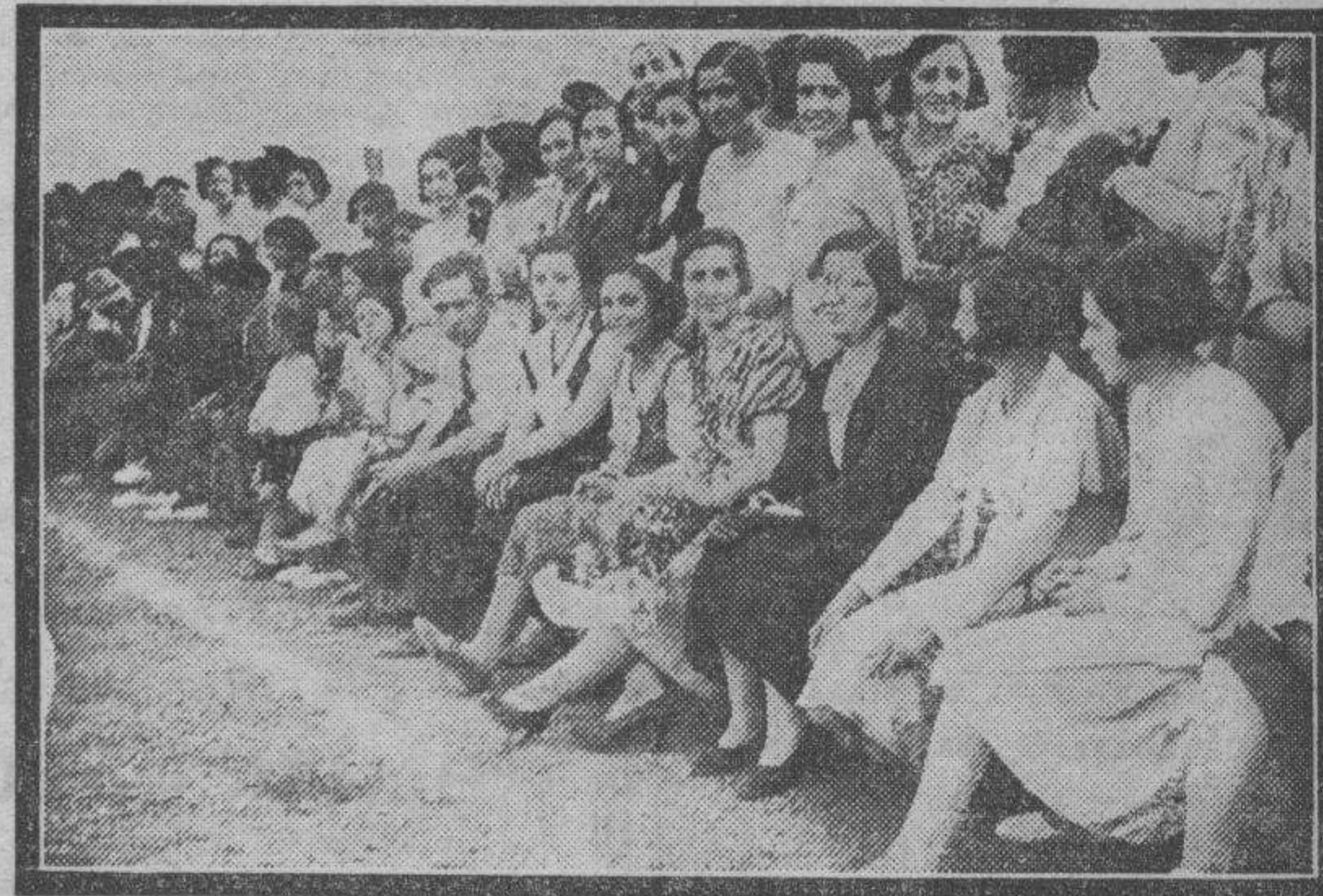
LUCENI. — Otro aspecto del campo de fútbol durante la fiesta deportiva celebrada hace pocos días con motivo de los tradicionales festejos.