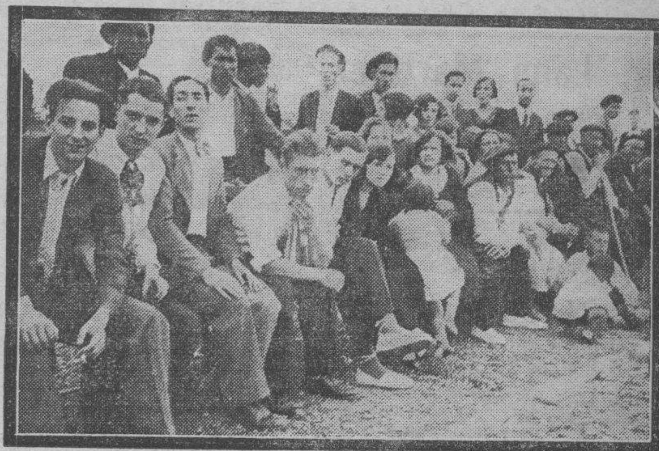
LUCENI. — Bellas muchachas y deportivos jóvenes de la localidad presenciando las fiestas futbolísticas celebradas hace unos días.

Se ha dado orden al ingeniero municipal para que se proceda al empalme de la tubería de agua de la calle de la Rebojería con la de la calle de Alonso V.