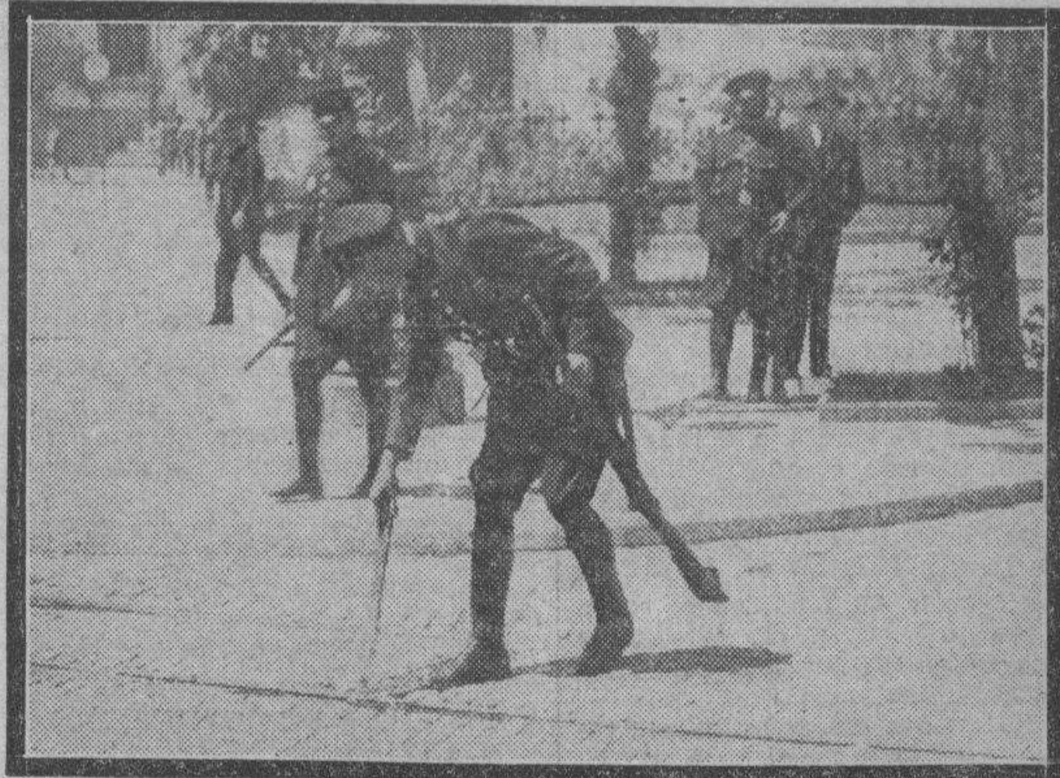
Otro detalle de la actuación de los guardias de Asalto para la circulación de los tranvías.

En seguida salió otro coche para la línea de las Delicias.