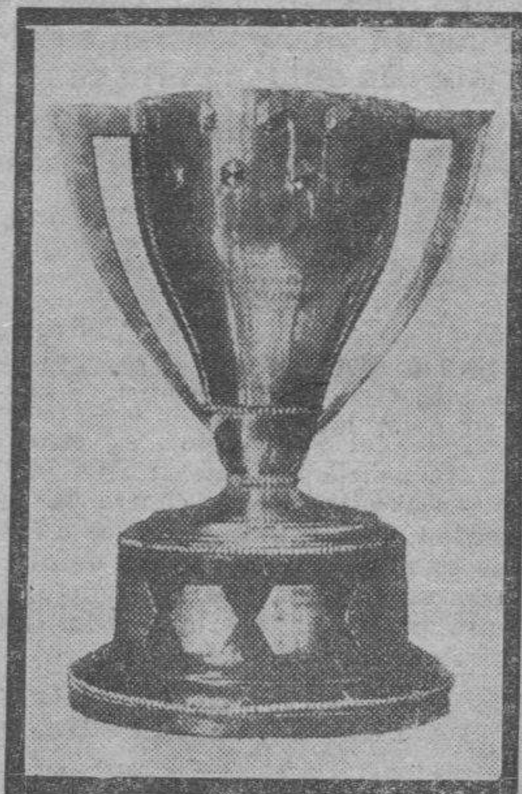
El trofeo del campeonato nacional de Liga, en el que el Madrid va a inscribir este año por segunda vez su nombre como vencedor.