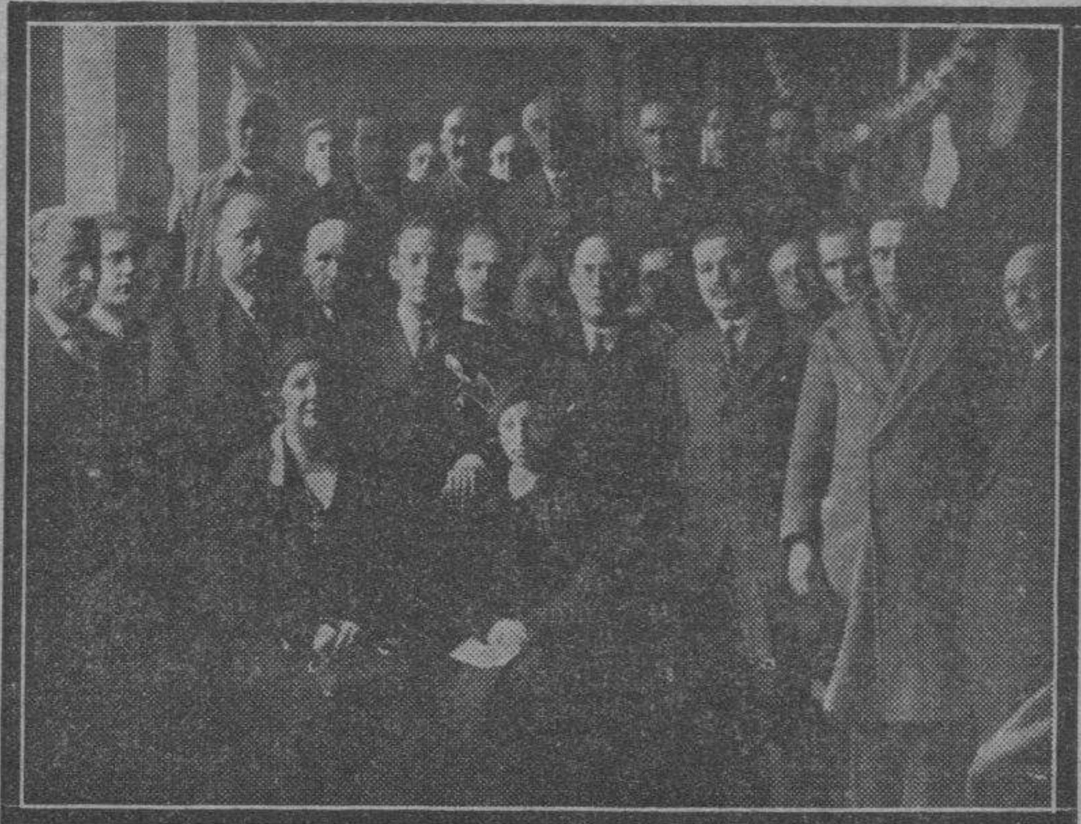
La presidencia del acto celebrado el domingo en el Frontón Aragonés por los padres de familia.