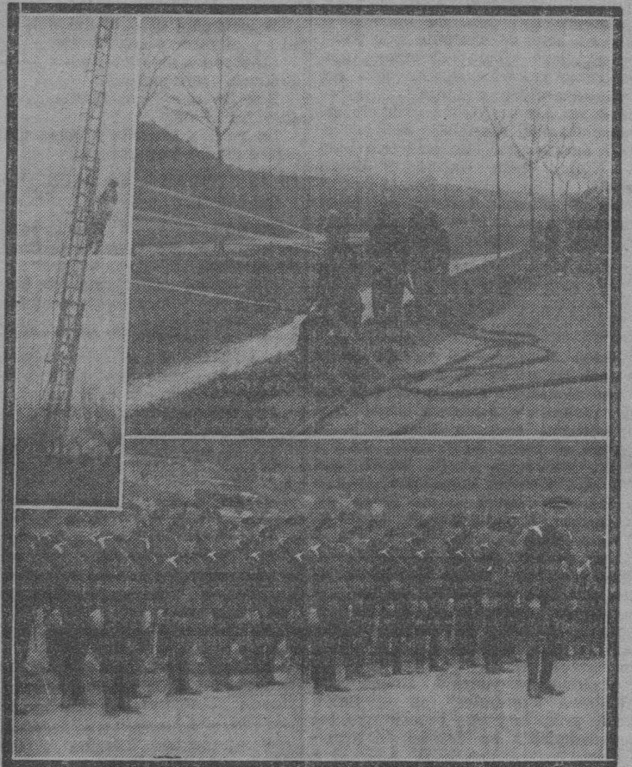
Los bomberos zaragozanos el pasado domingo, por la mañana. — Abajo: los bomberos vistiendo el nuevo uniforme.

(Información del acto, en la pág. 4)