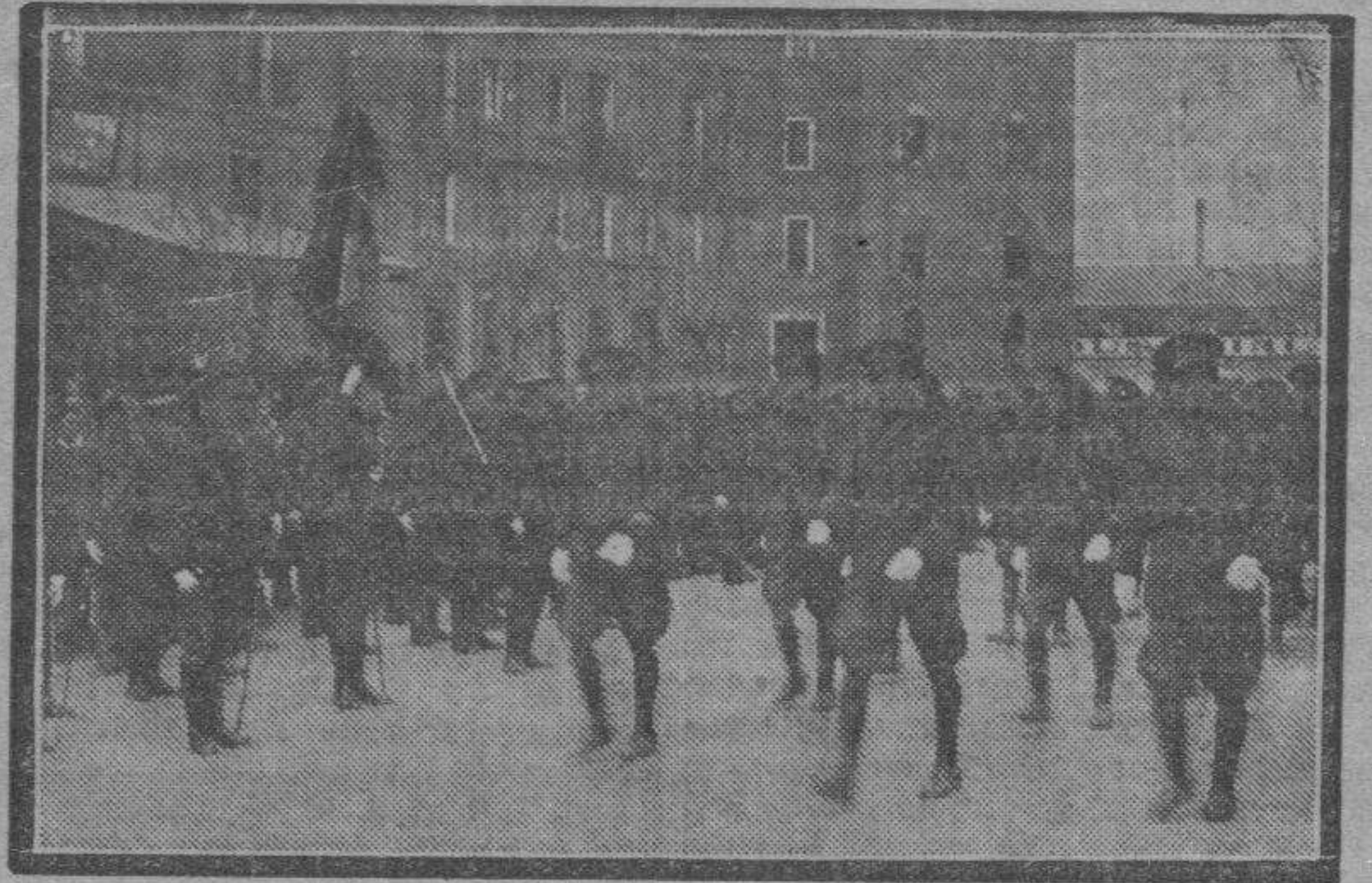
Un aspecto del solemne acto celebrado en la explanada del Castillo con motivo de la promesa de fidelidad a la bandera, el domingo, por los nuevos reclutas.