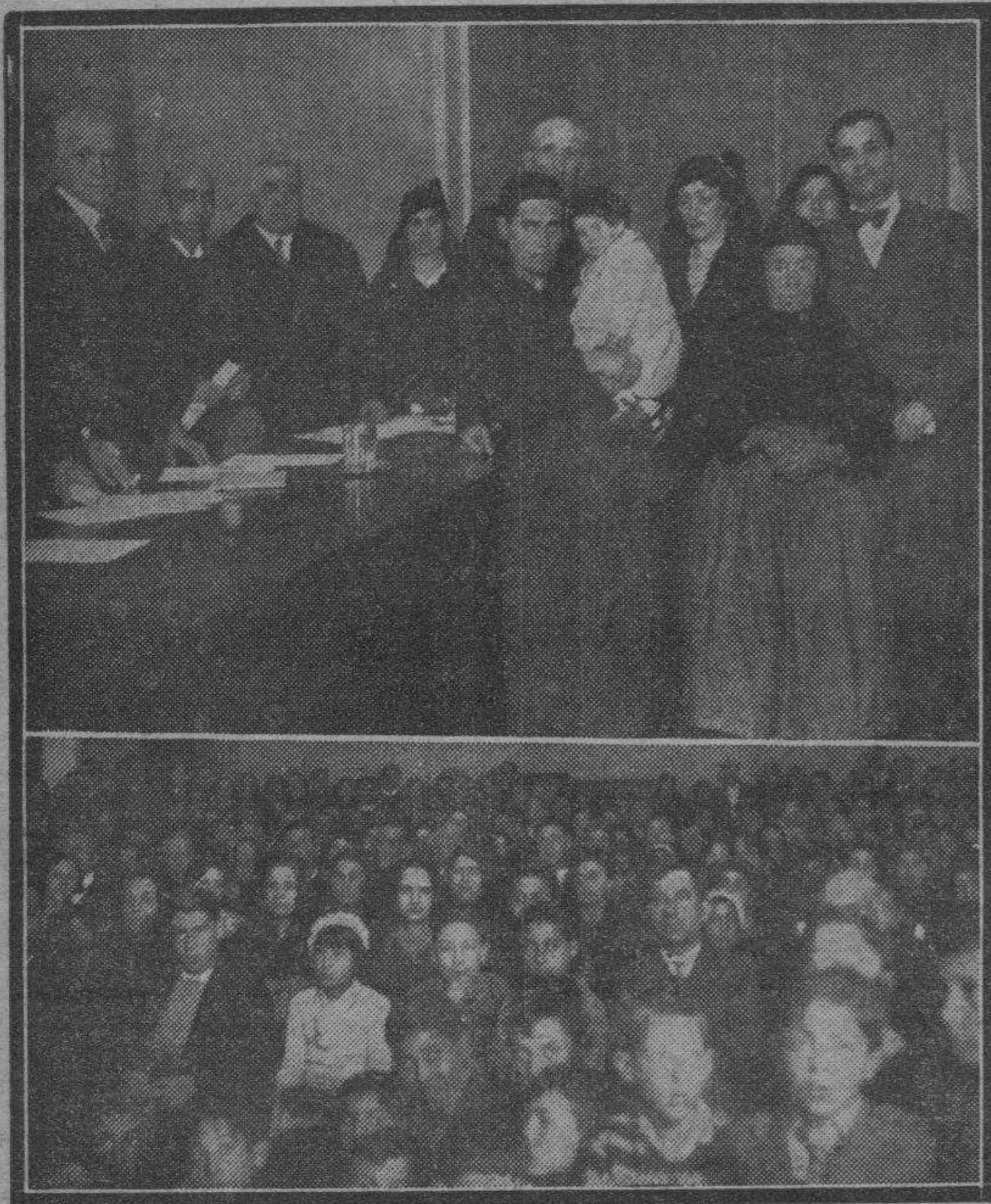
Del acto solemnísimos celebrado el domingo en la Caja de Previsión Social de Aragón son estas dos fotografías.