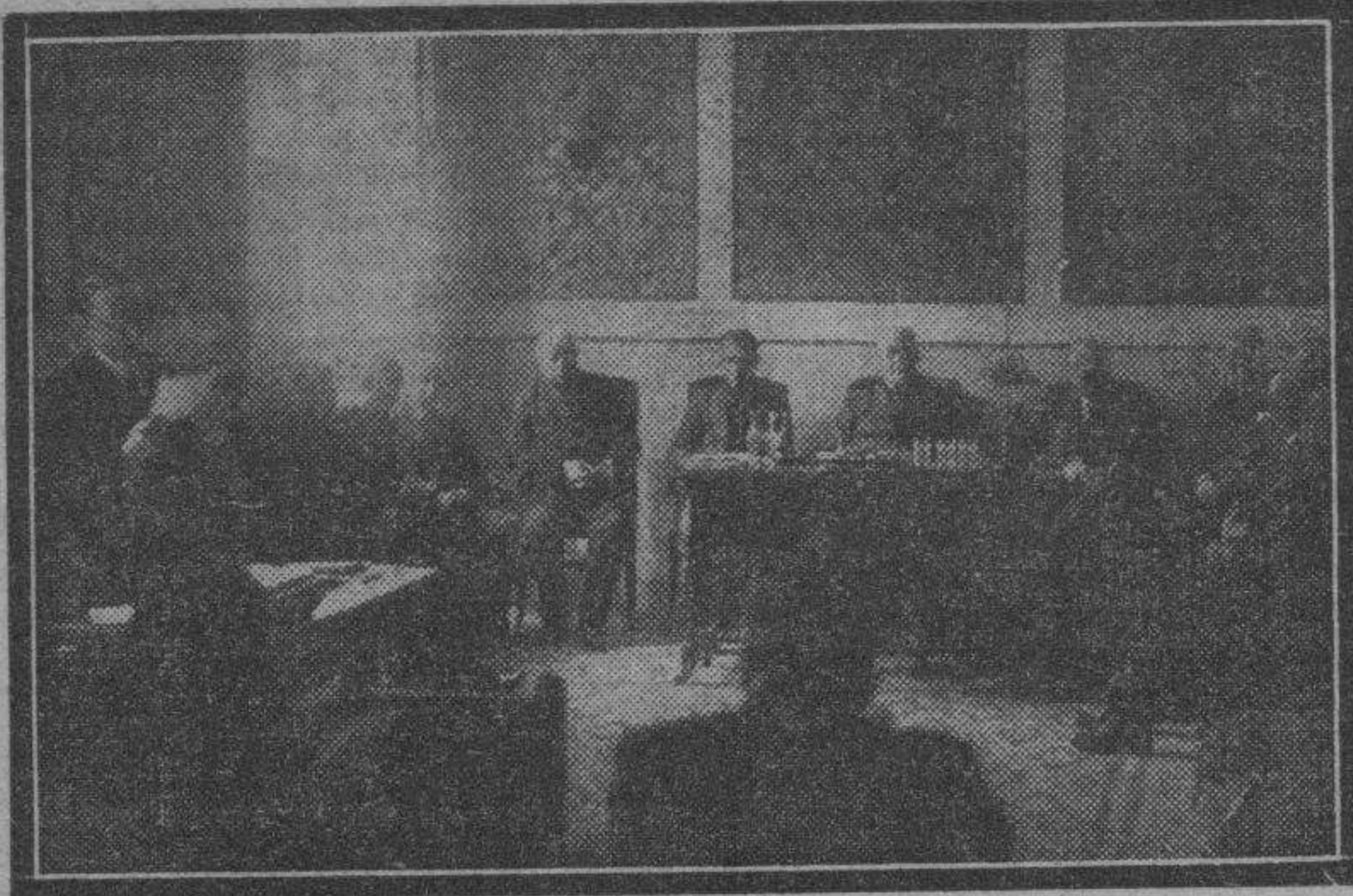
Presidencia y ponente del acto celebrado en la Asociación de Labradores.