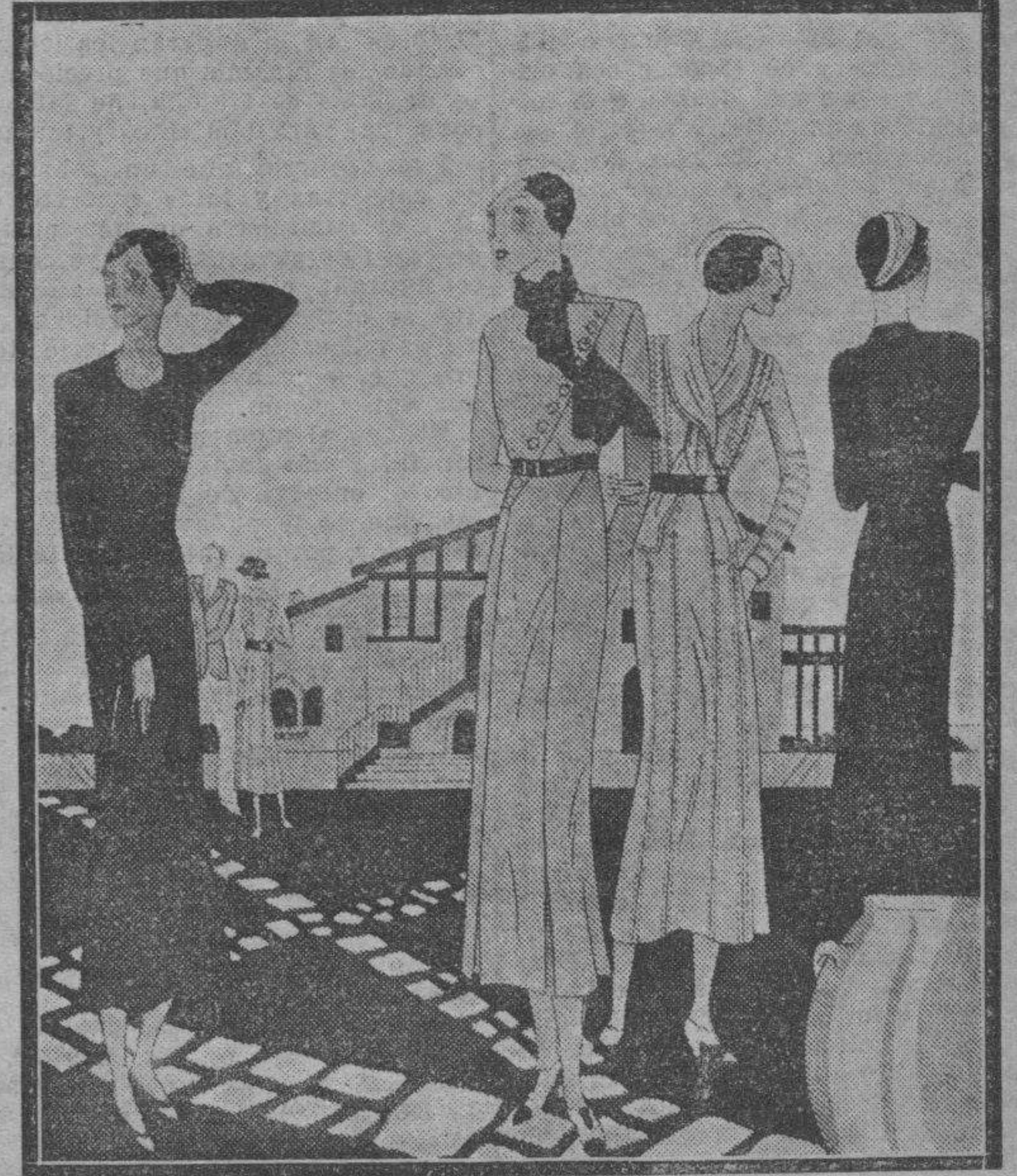
De izquierda a derecha: Traje de estilo sport en lainaje de fantasa de color muy moderno. Los paneles de la falda son acentuados por respuntes y se remontan en el corsaje formando el cinturón y el empujamiento en punta. Las mangas raglan. Cuello del mismo. Vestido de color azul. El corsaje cruzado se cierra con una hilera de botones. La falda tiene tablas encontradas que le confieren una amplitud discreta. Un echarpe de China en un tono más oscuro completa su chic. Peau d'ange es la tela de gran moda que se ha usado para esta creación sentadora. El corsaje tiene tablas respunteadas; estos adornos se evidencian en la falda y mangas. El cuello echarpe, del mismo género, pasa por el cinturón de charol.