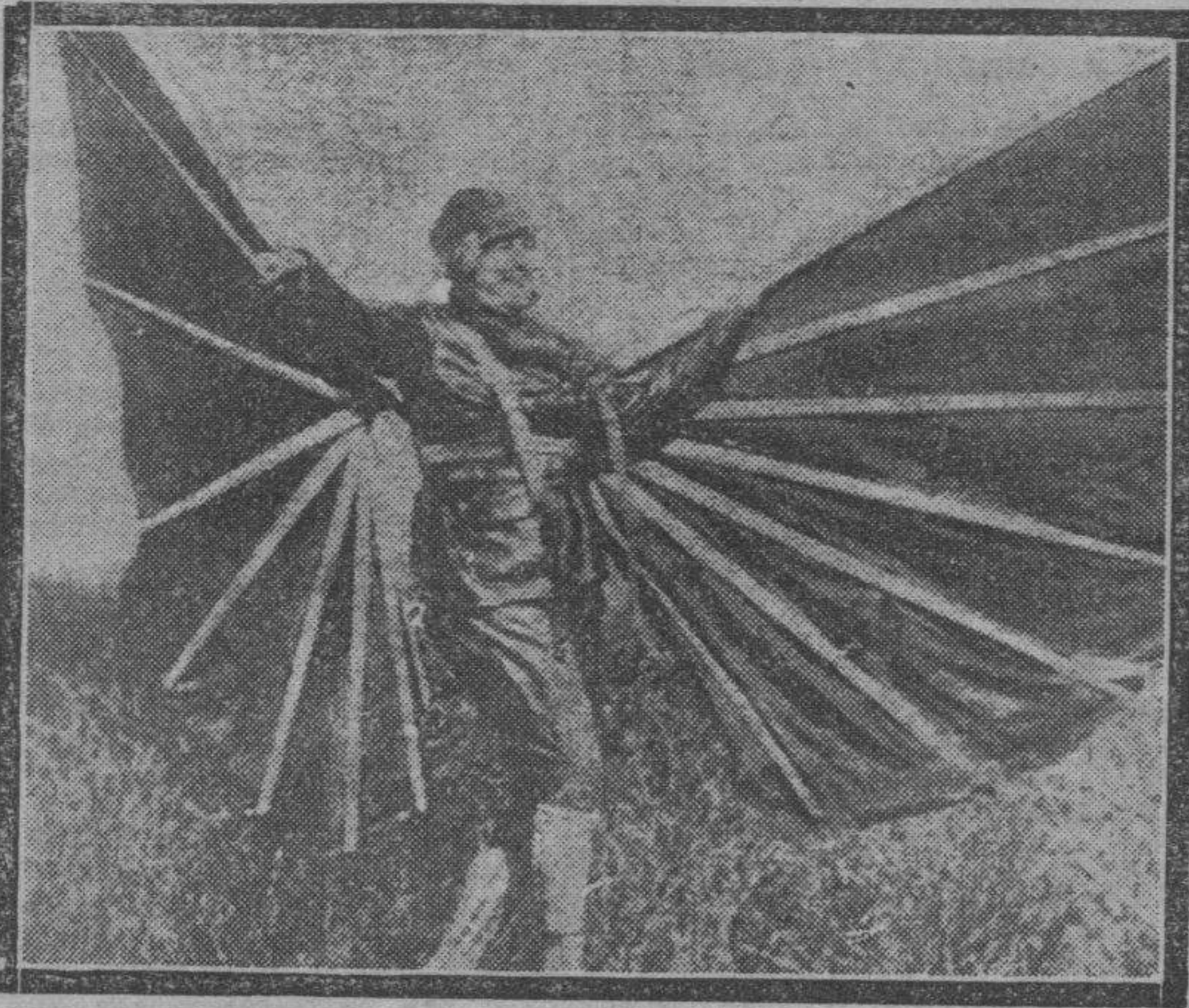
Esta guapa muchacha ha pretendido emular a un avión, y casi lo ha conseguido. Claro que elló ocurrió fuera de por acá, porque si la probatina llega a ser "amenizada" por el ventarrón con que a los zaragozanos nos obsequia la mole ingente del Moncayo, que la belleza aquella se da el susto padre, eso es antediluviano.

¿Qué se apuestan ustedes a que el domingo presenciemos un gran partido?