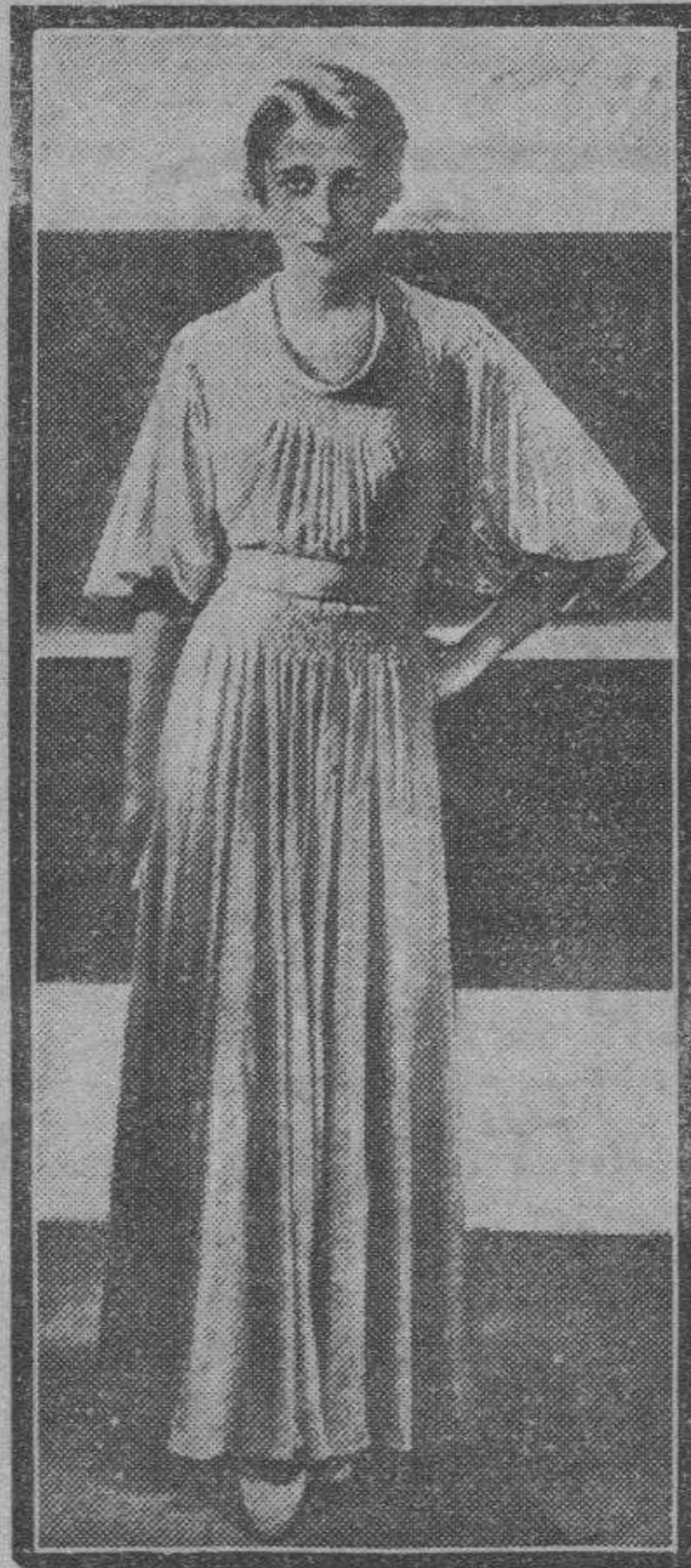
El crepé de lana bleu se ha empleado para idear este vestido de líneas discretas y sencillas de estilo clásico. Varias hileras de diminutos frunces bordean el descote, unión de las mangas y parte superior de la falda.

En copas de "cock-tail" se sirven unos langostinos (o gambas) cubiertos con mahonesa, y en fuente plana de cristal, los siguientes "bocados": una raja fina de pan negro cubierta por una capa, ya sea de salmón, de anchoas, de huevo duro, de manzana, de queso, de plátano, y adornados—menos las frutas—con rajitas de pimienta encarnado y de aceitunas.