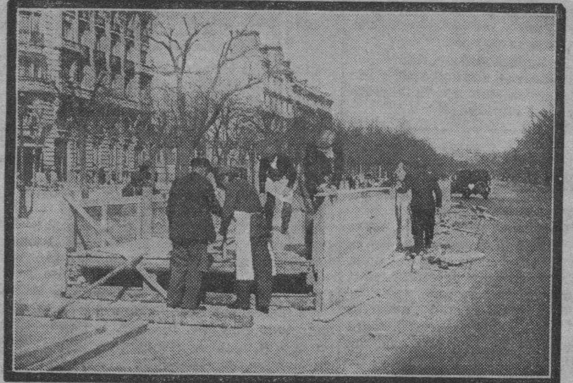
MADRID. — En la Castellana ha comenzado la instalación de tribunas para la celebración del Carnaval que, a este paso, va a ser un desfile de máscaras entumecidas por el frío.