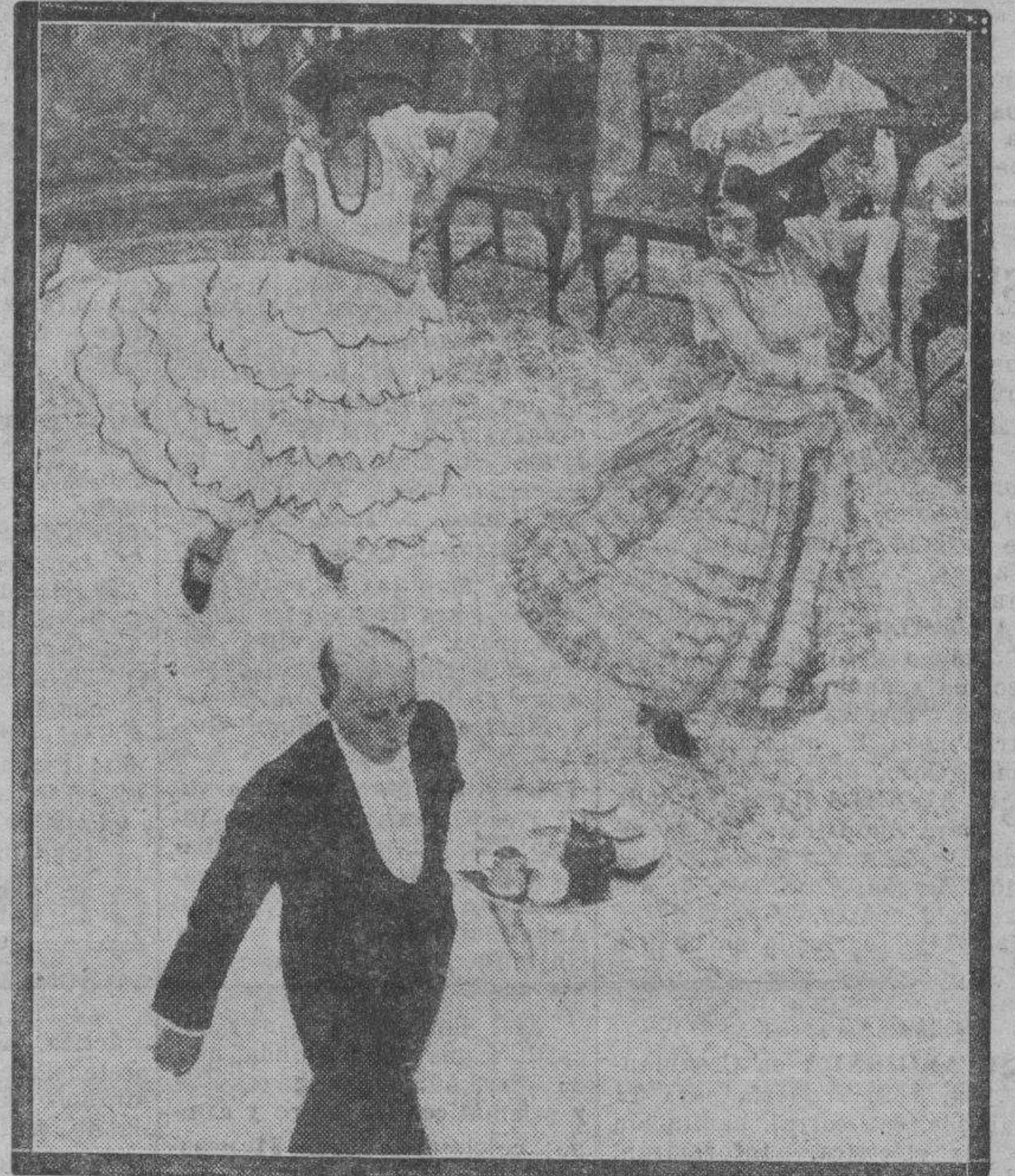
Pese a toda la literatura española en contra de cómo se cultiva fuera de aquí el tipismo español, persiste triunfando la españolada en el extranjero. Tórreros, boleros, chaquetillas cortas y sombreros anchos. He aquí una fotografía que nos trae una de esas constantes demostraciones. "Un baile español" en un "cabaret" extranjero, con sus "bailaoras" exóticas, llenas de madroños.