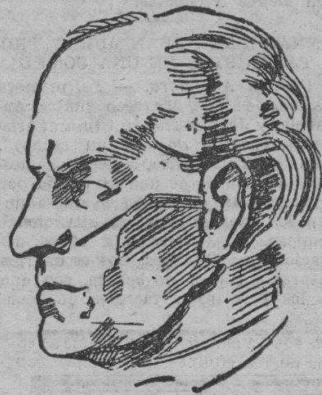
John Galsworthy, escritor inglés, autor de "Fraternidad" y "La huelga", a quien se le ha concedido el premio Nobel de Literatura.