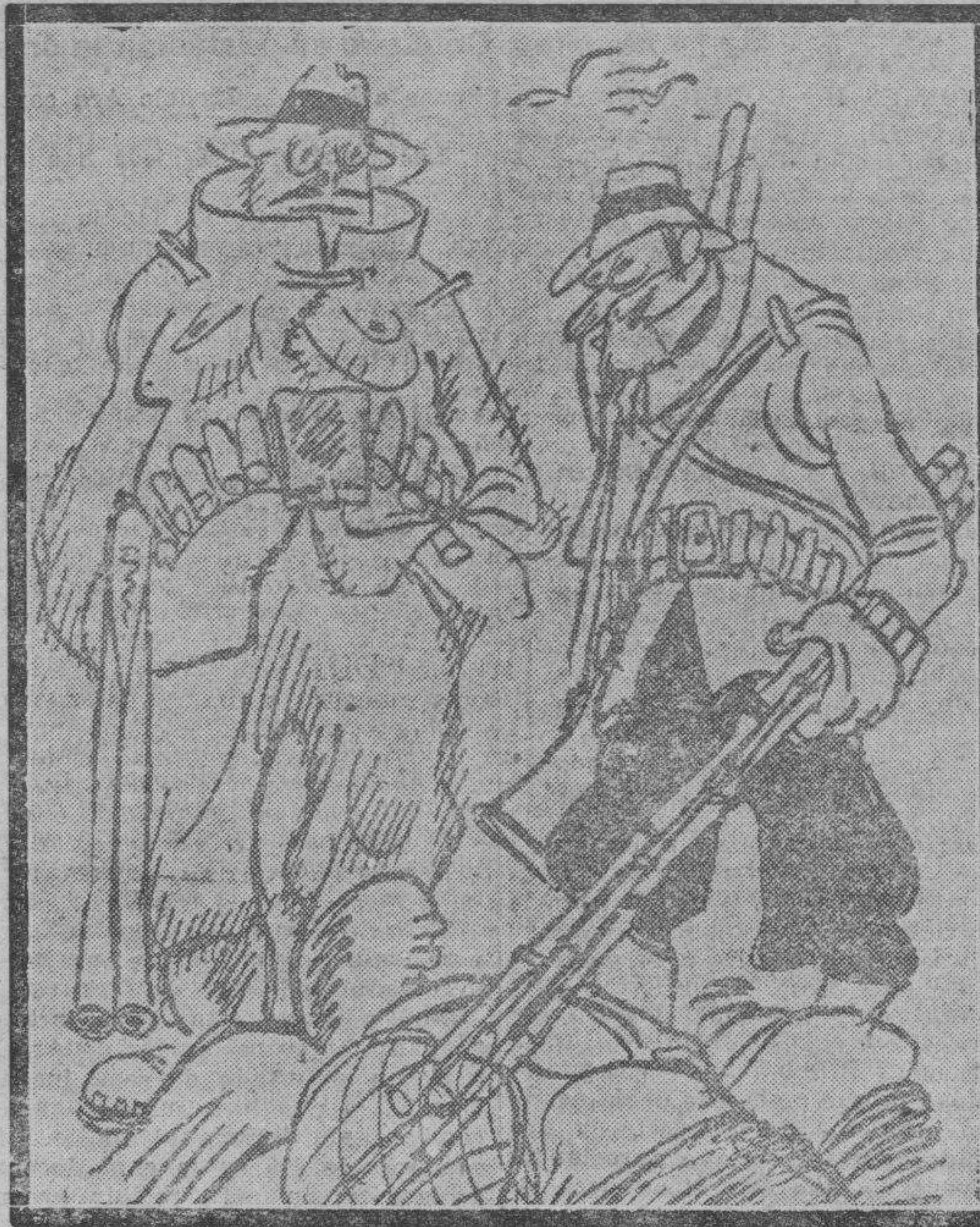
—¿Y para ir de caza lleva usted una caña de pescar? —Sí. Así los conejos creen que voy de pesca, y...

lo que constituyó un "record" superado solamente mucho después. Las apuestas se hacían en la proporción de tres a uno, a favor de Cribb. Este había vuelto al "ring" después de un retiro de varios meses, únicamente para evitar que el campeonato de Inglaterra pasara a poder de un negro.