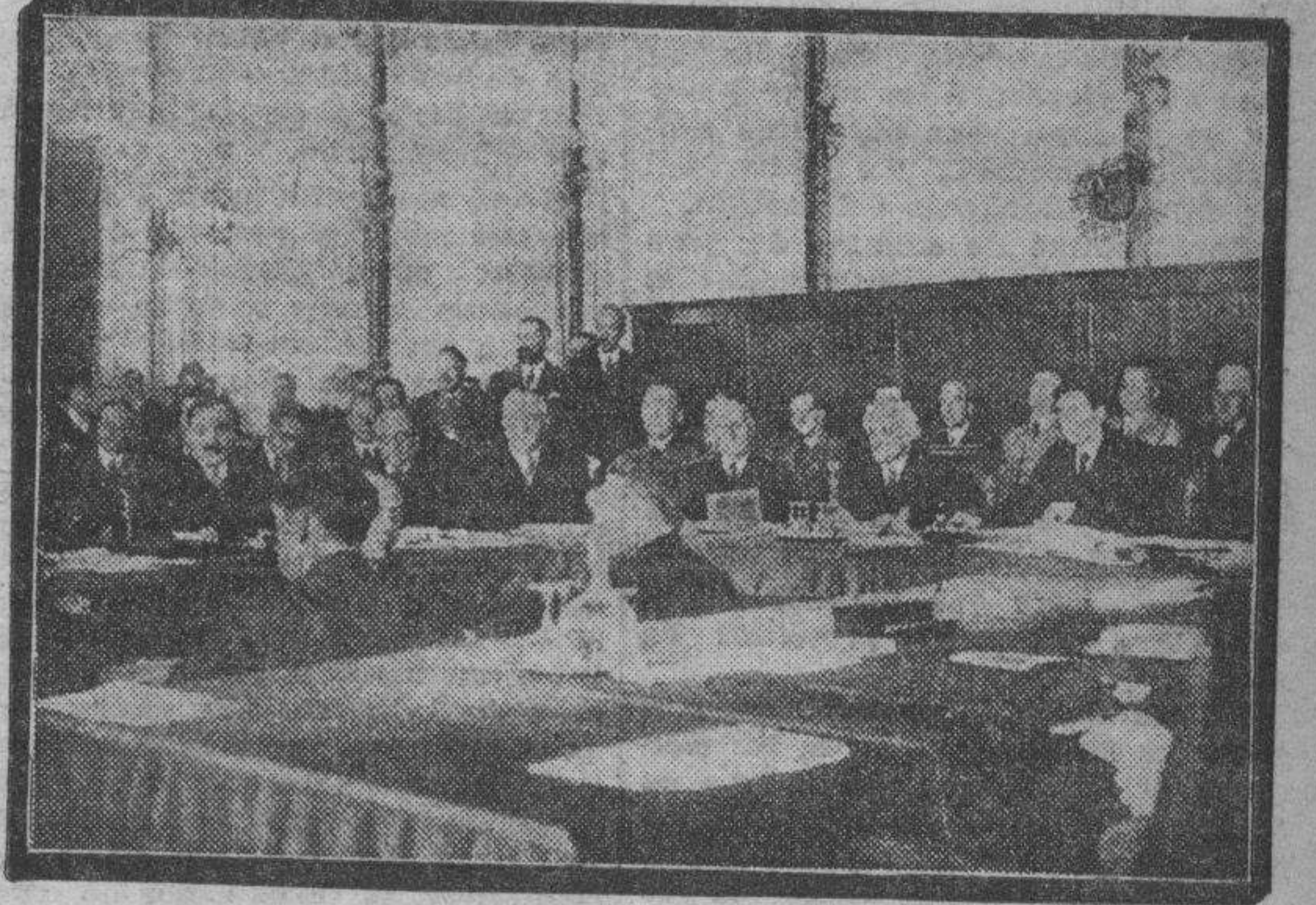
La Sociedad de Naciones celebra en Ginebra sus reuniones. La fotografía recoge un aspecto del salón durante la sesión 68ª, que fué presidida por De Valera, el jefe del Estado irlandés.