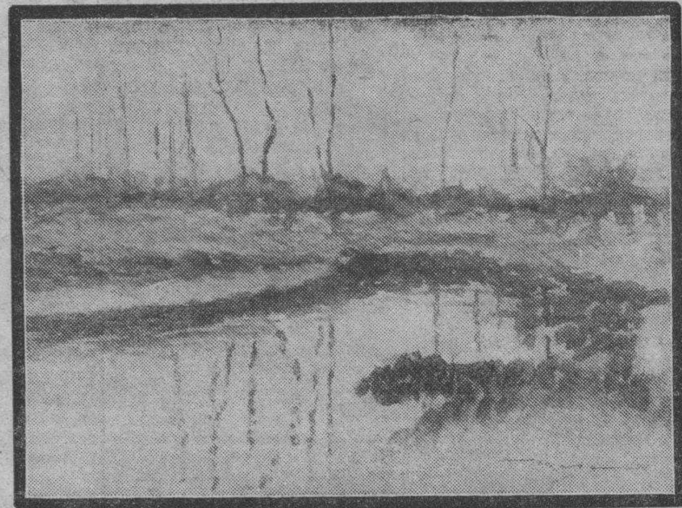
Una de las admirables acuarelas que Luis Maza expone en los salones de LA VOZ DE ARAGON.