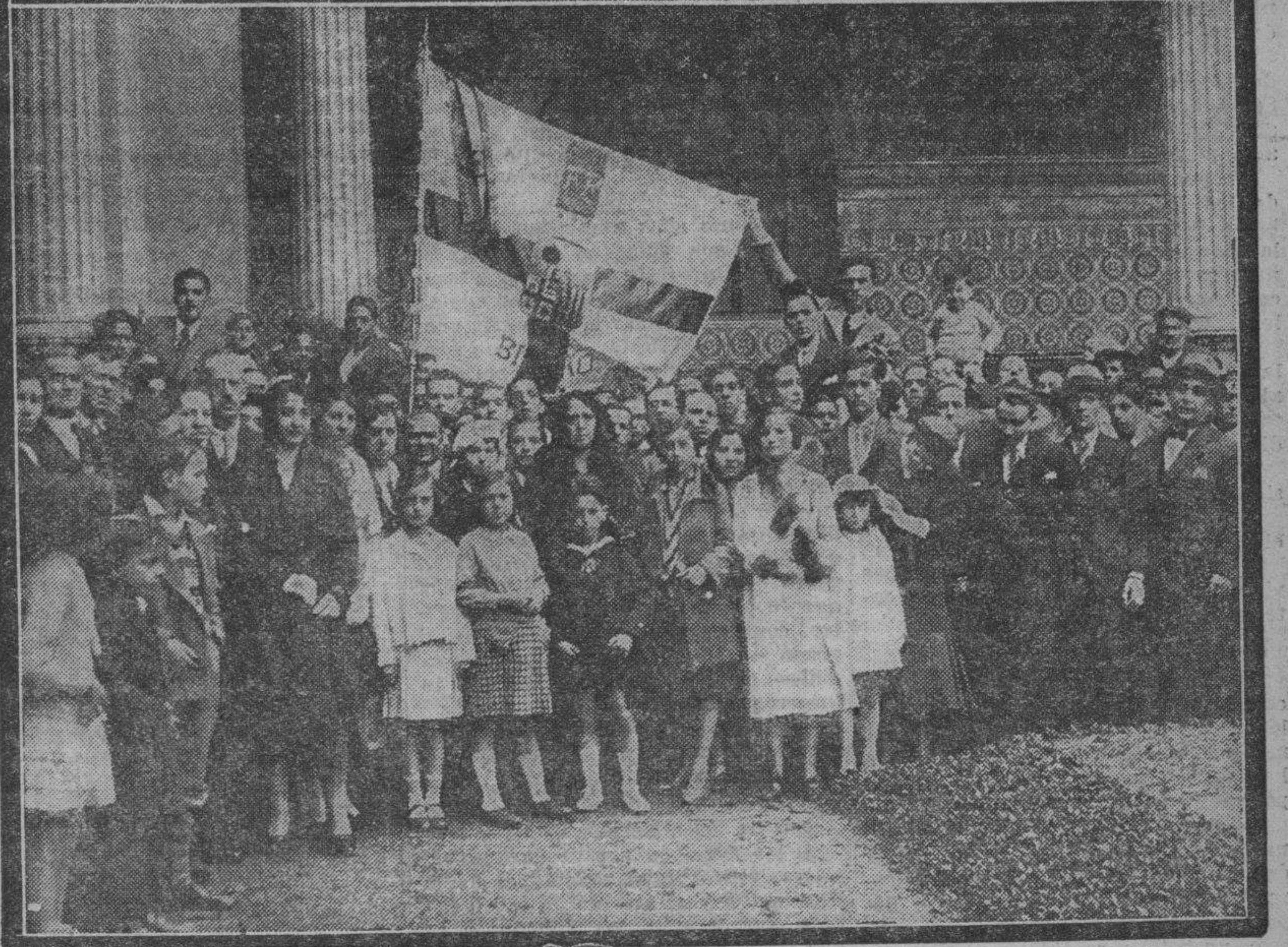
La entrega de la antigua bandera del Centro Aragonés de Bilbao al Museo provincial de Zaragoza fué un acto muy simpático y muy emotivo. En estas fotografías se recogen dos aspectos del mismo. Arriba, la presidencia y abajo un grupo de excursionistas llegados de Bilbao a nuestra ciudad.