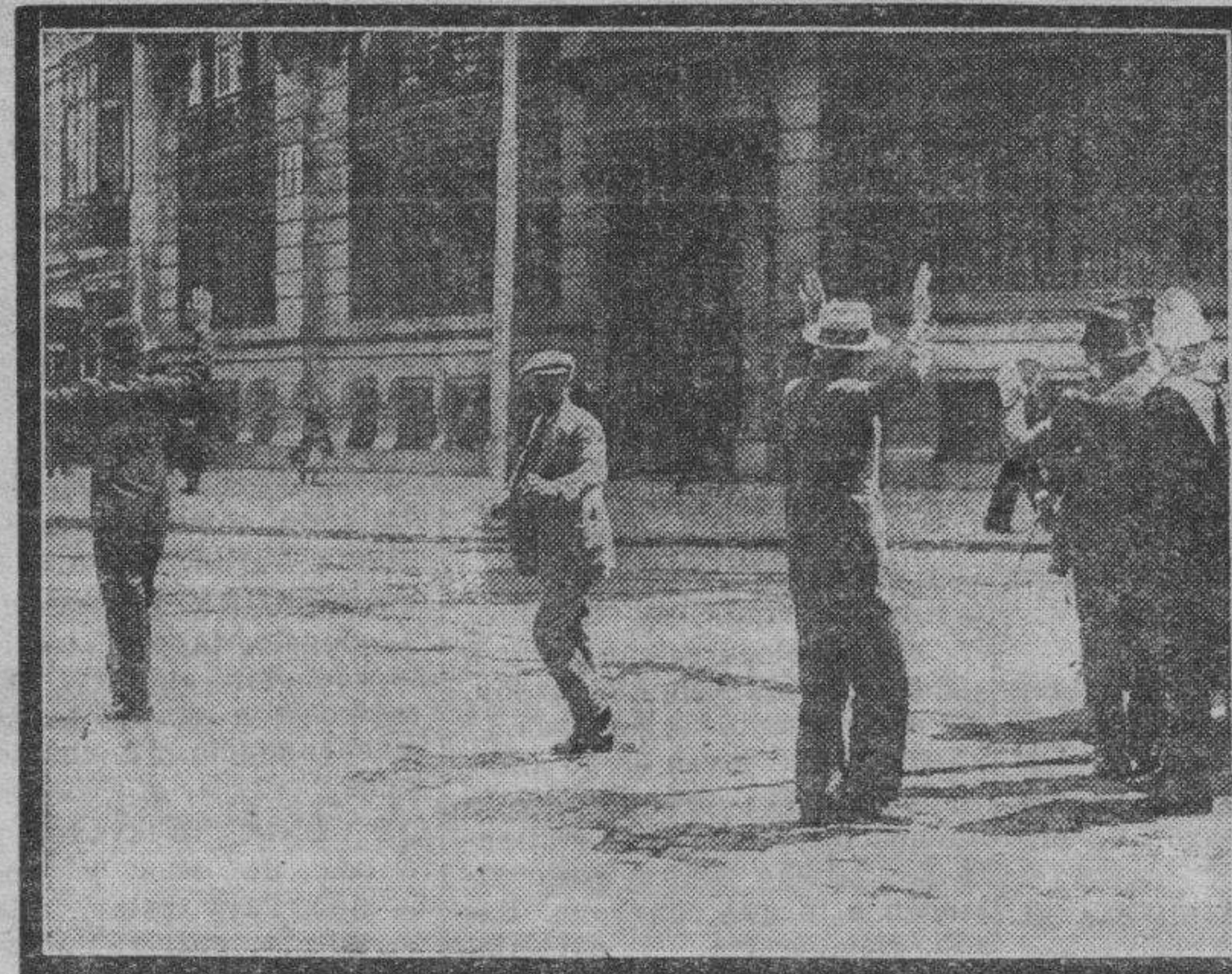
Los transeúntes pacíficos, ante la carga, ponen los brazos en alto en señal de inocencia.