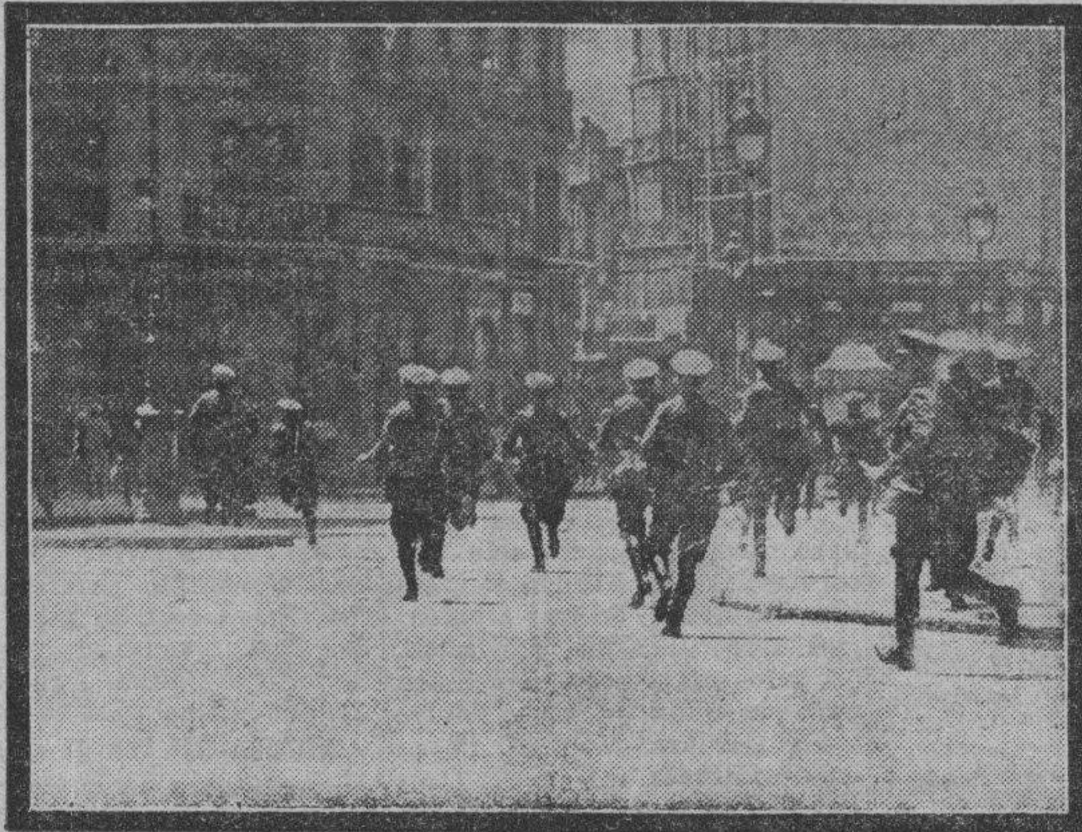
En la plaza de Canalejas disuelven los guardias de Asalto una manifestación.