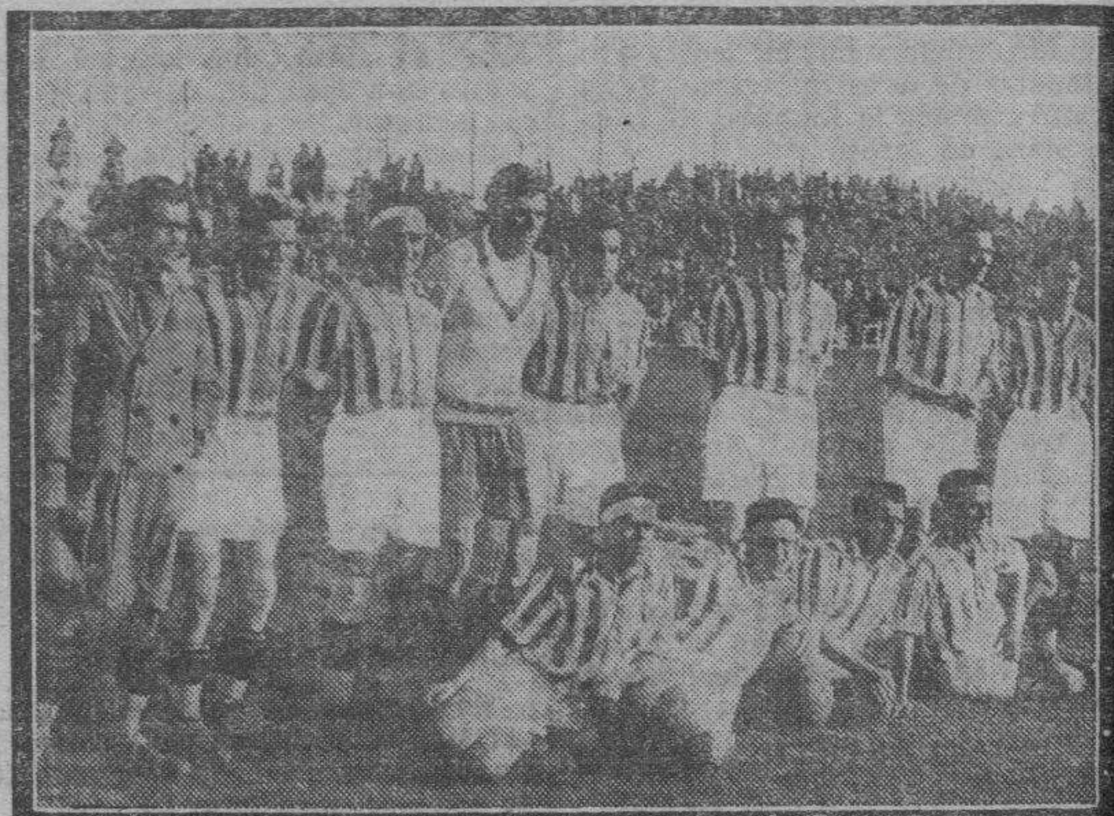
...y el vencedor de la segunda.