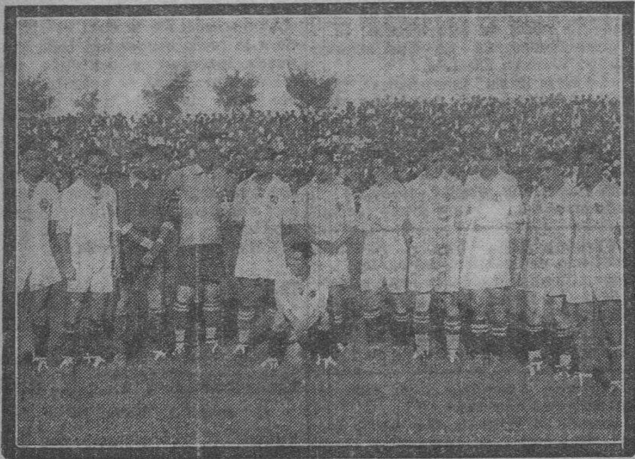
El vencedor de la primera división...

A excepción del Barcelona, que sólo pudo empatar, todos los demás equipos salieron victoriosos en sus campos