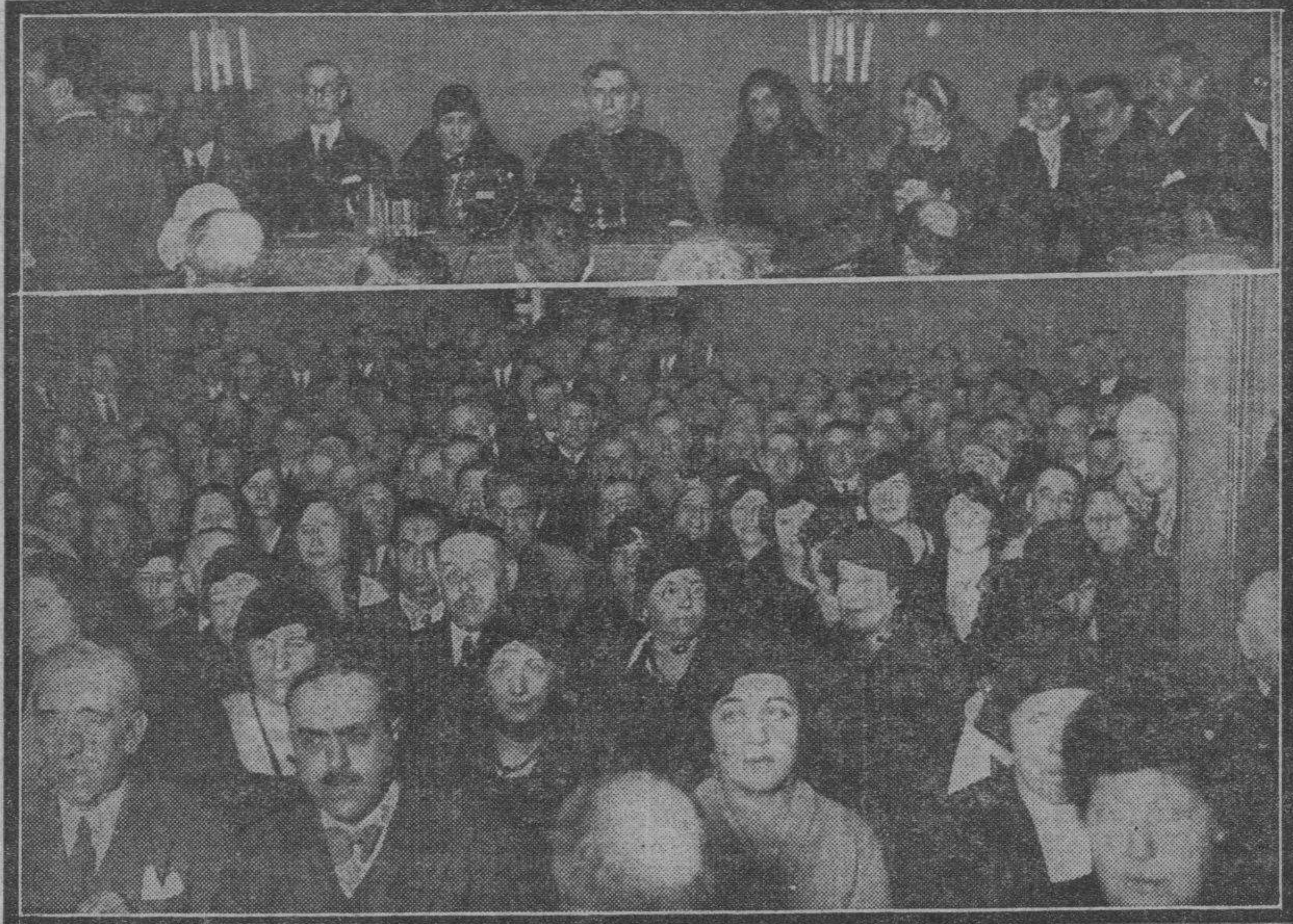
De la inauguración del Círculo de Acción Nacional. Arriba: El diputado a Cortes don Santiago Guallar y personas que compartieron con él la presidencia del acto inaugural. Abajo: Un aspecto del salón de actos. (Información del acto en nuestra sección de "Política local").

—¿Conoce usted a ese señor? —Mucho. —¿Si quisiera recomendarme a él? —¿Para que le dé trabajo? —No, para que me guarde la colilla.