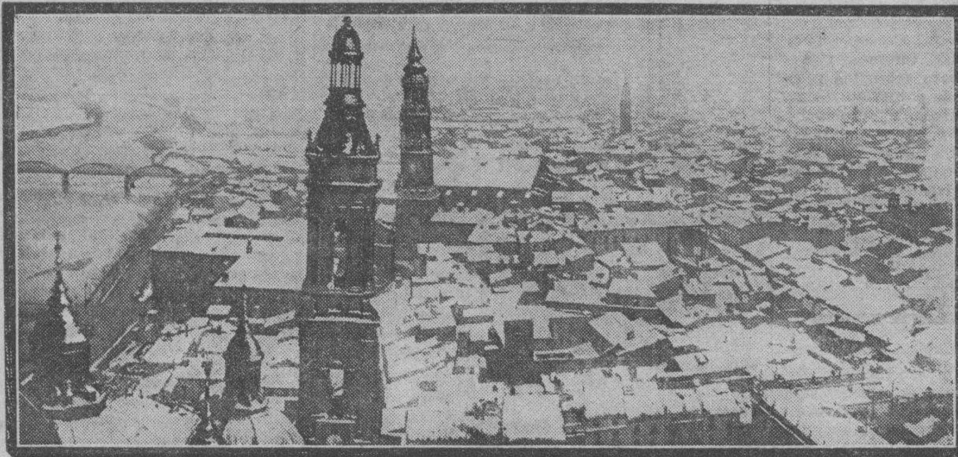
La ciudad siguió ofreciendo estos panoramas: nieve en los tejados, en las cúpulas, en los árboles, que persistió durante todo el día.