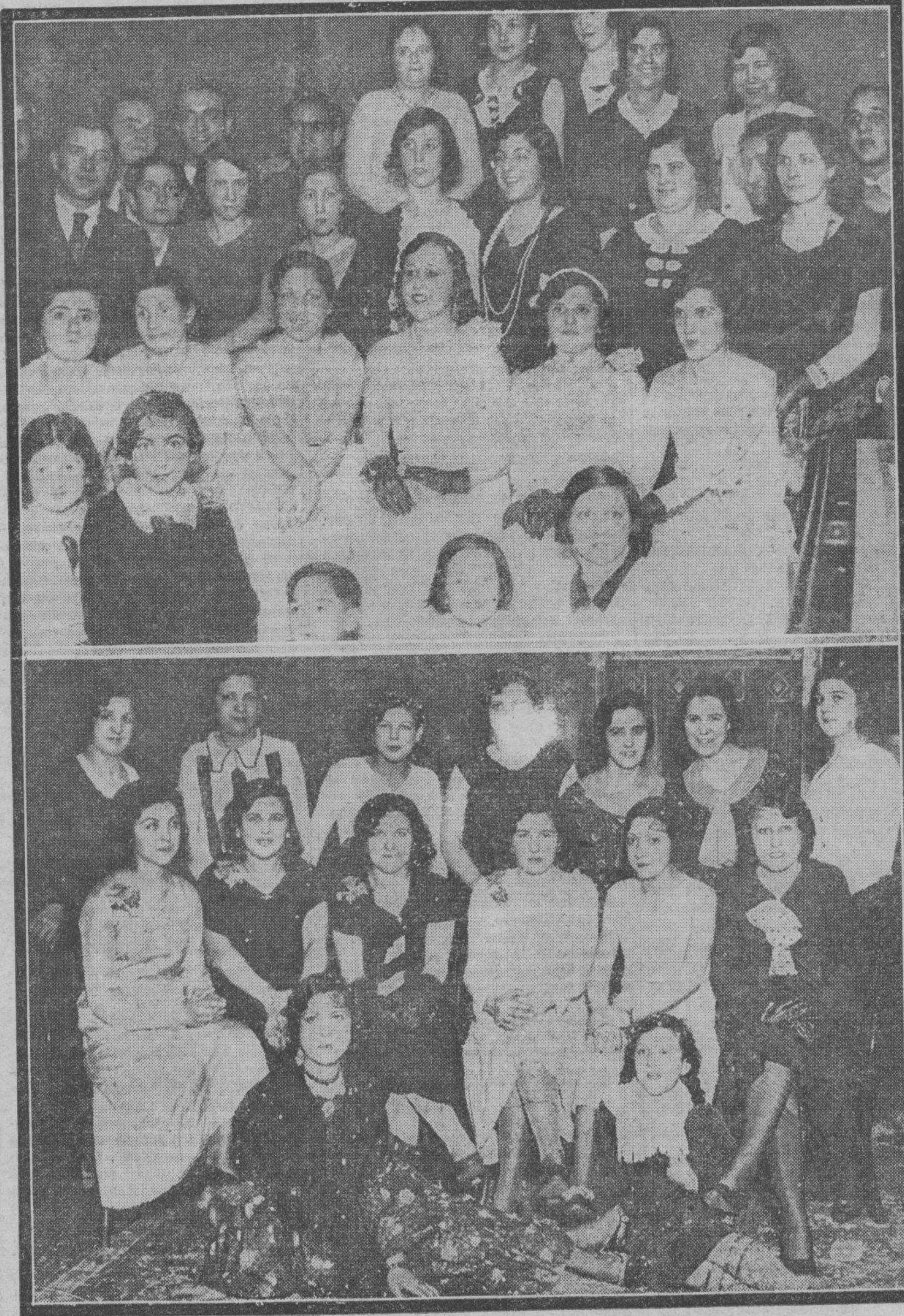
Los grupos de bellísimas muchachas, entre las que figura "Miss Zaragoza", posando durante un descanso en el baile celebrado por el Casino Artística con motivo del Carnaval.

La representación obrera de dicha sección será elegida por la Sociedad de Obreros de Carga y Descarga de Zaragoza, con 101 socios.