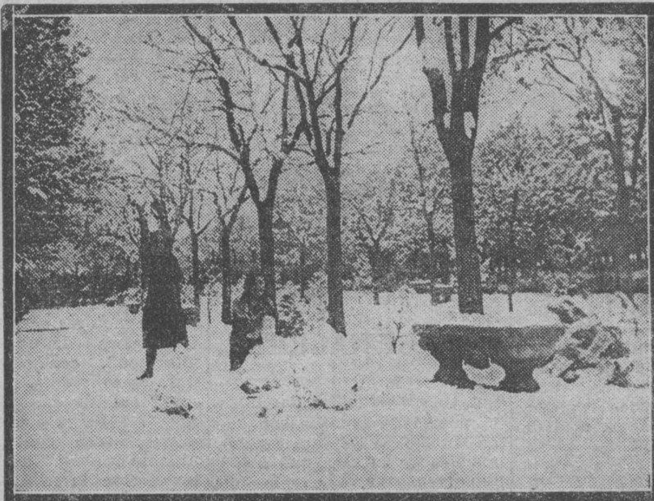
Grupos de muchachas, en lo alto de Buena Vista, aprovecharon la cantidad de nieve acumulada para moldear figuras grotescas.