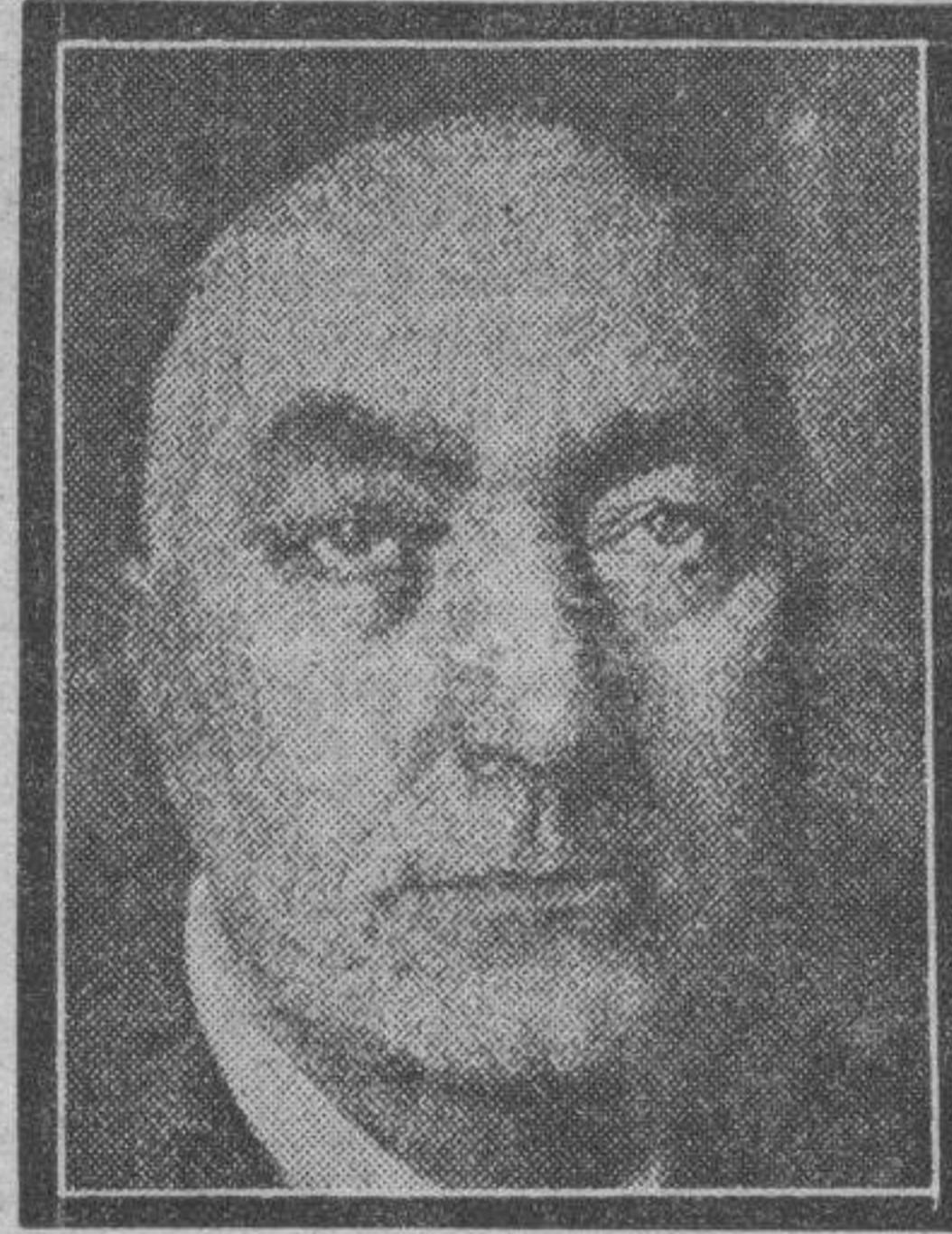
Edgar Wallace, el famoso novelista inglés, que ha fallecido en Hollywood.