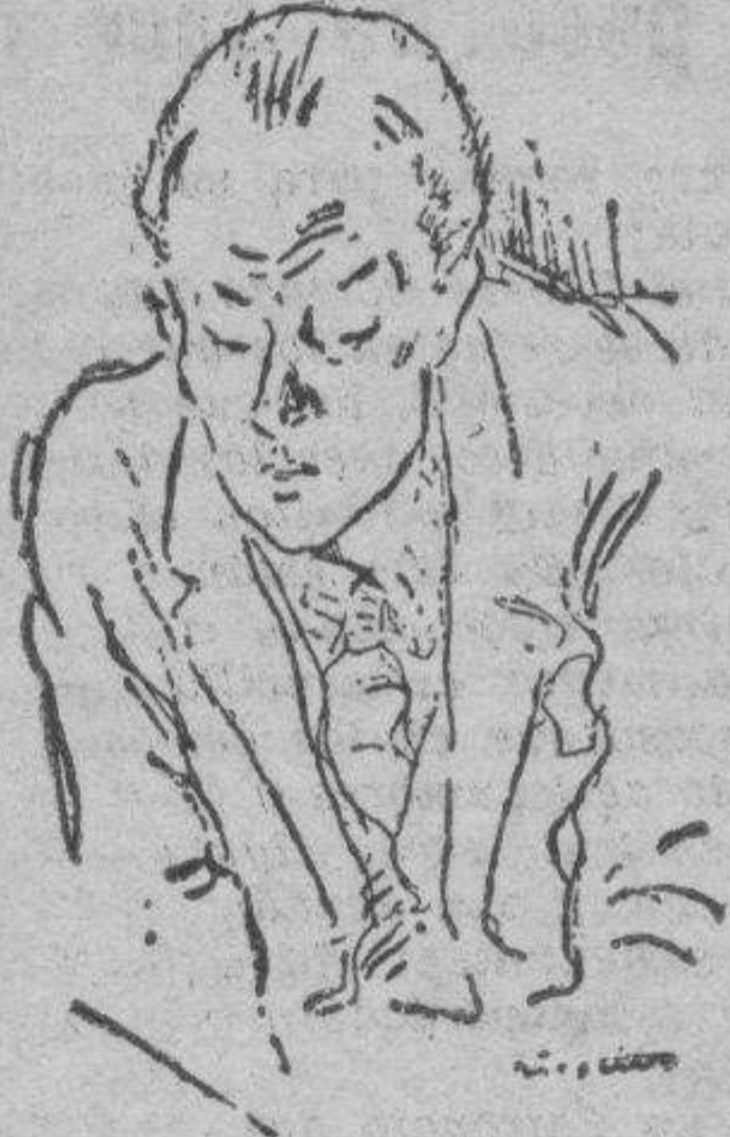
Drieu La Rochelle.

Pierre Drieu La Rochelle es un escritor francés que conoció, a sus 21 años, el infierno de la guerra, y a través de ella fortaleció su reciedumbre temperamental, que ha volcado delicadamente en esta su última novela.