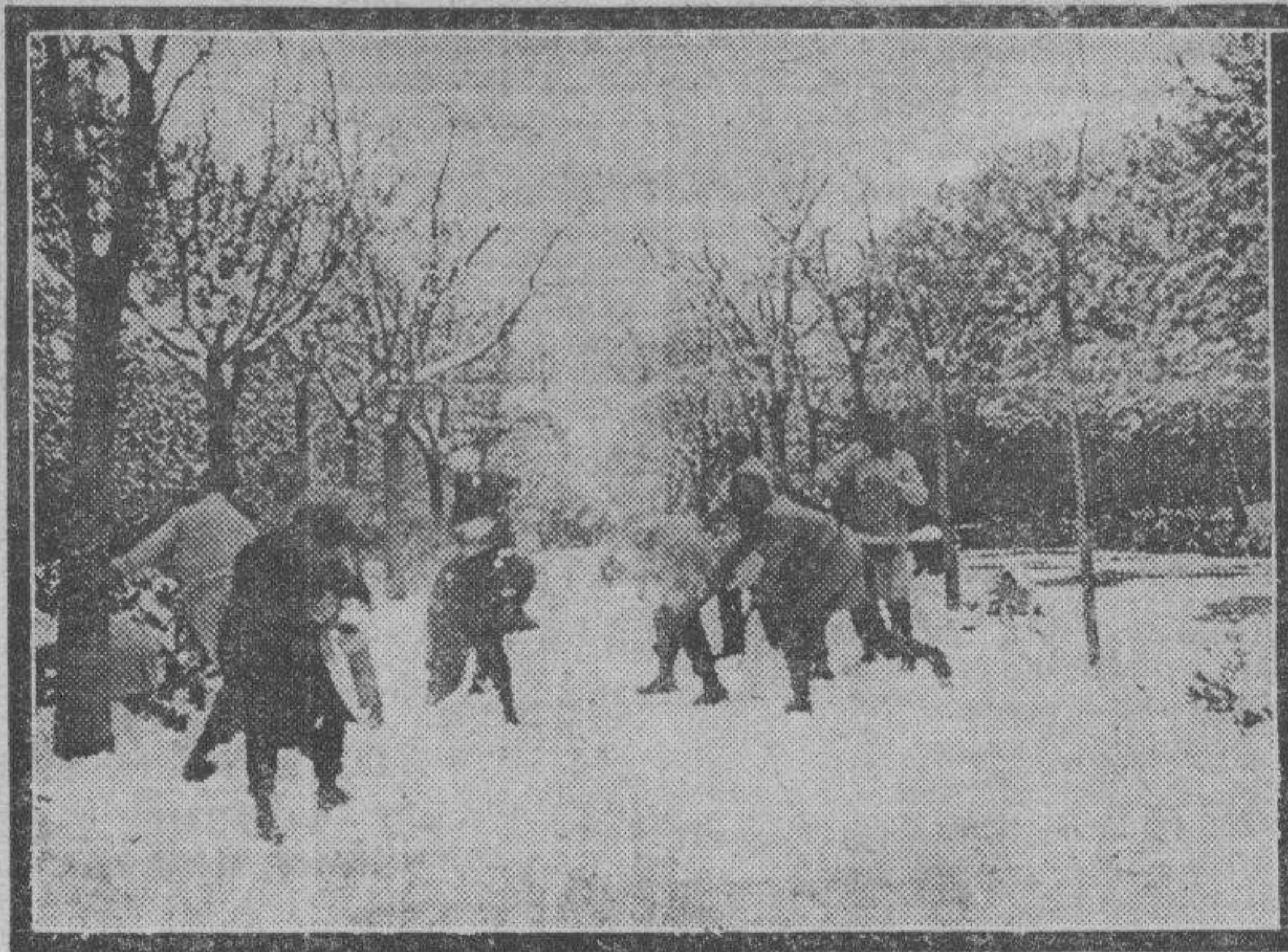
Y grupos de muchachos calentaron sus cuerpos en el ejercicio de la batalla con copos de nieve, juego obligado en estas jornadas blancas del invierno.

Por la tarde la nieve se fundió algo, debido a la momentánea alza del termómetro, pero entrada la noche el frío se hizo intenso, haciendo marcar una de las más crudas noches invernales.