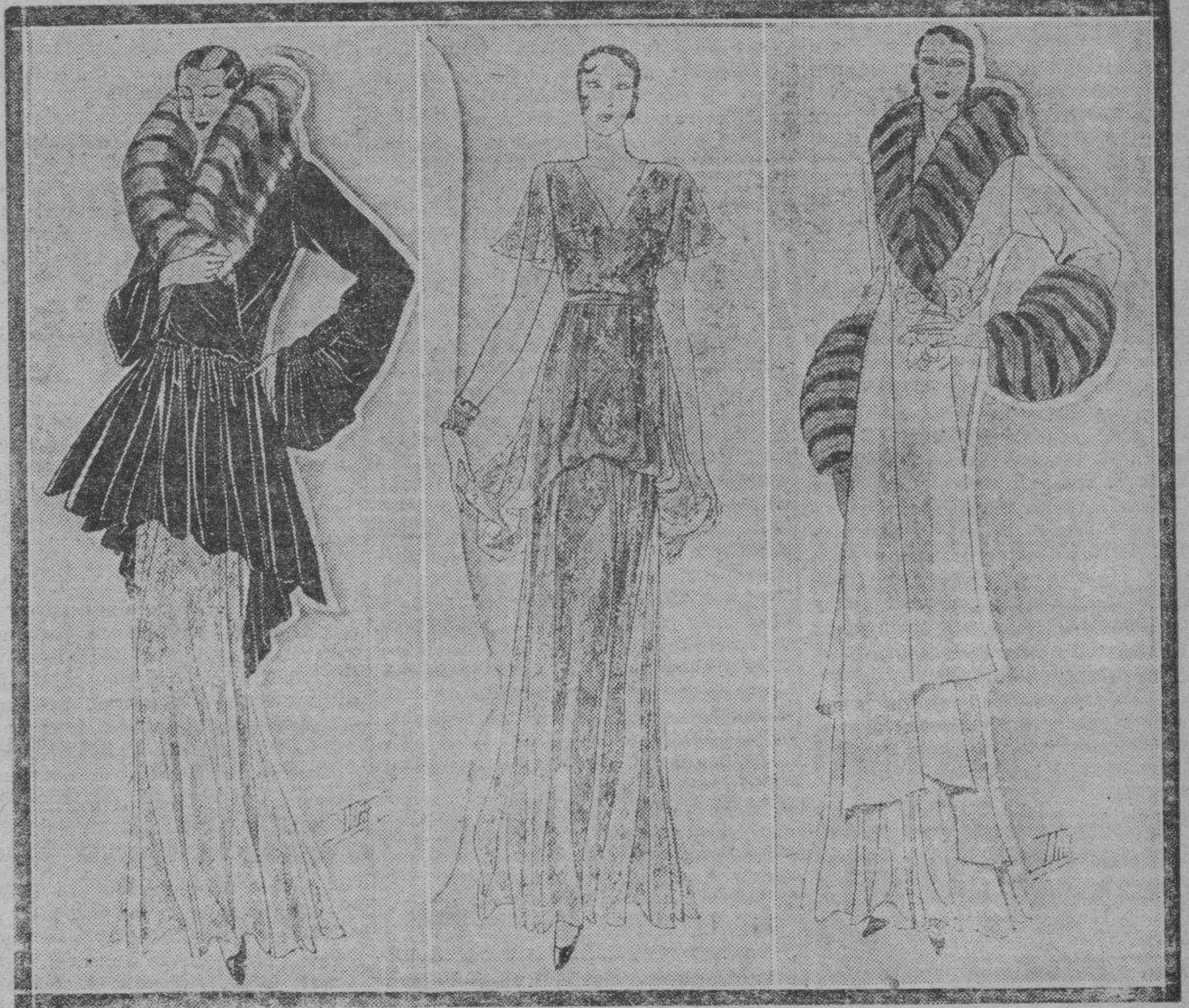
Abrigo muy original, haciendo juego con el vestido siguiente; es de terciopelo negro o faldón ancho fruncido; cuello de visos. Bonito vestido de encaje moreno con florecillas de oro; la falda va adornada con un colgado flexible. Abrigo hecho de terciopelo blanco con motivo aplicado y guarnición de piel. La presente temporada invernal será pródiga en creaciones originales y fantásticas con las que nuestras adorables mujercitas realzarán su hermosura, a la vez que aliviarán todo lo posible los desastrosos efectos del riguroso invierno. Estos modelos de abrigos cumplen su misión y dan la nota de elegancia y alta distinción.