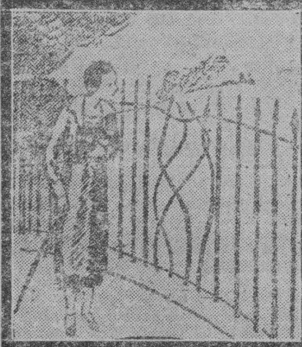
La novia del atleta llega tarde al lugar de la cita.

entre dos equipos rivales de la región. Detrás del grupo que formábamos mis compañeros y yo un señor extremadamente nervioso enviaba un puntapié al que estaba delante de él cada vez que un jugador chutaba a goal.