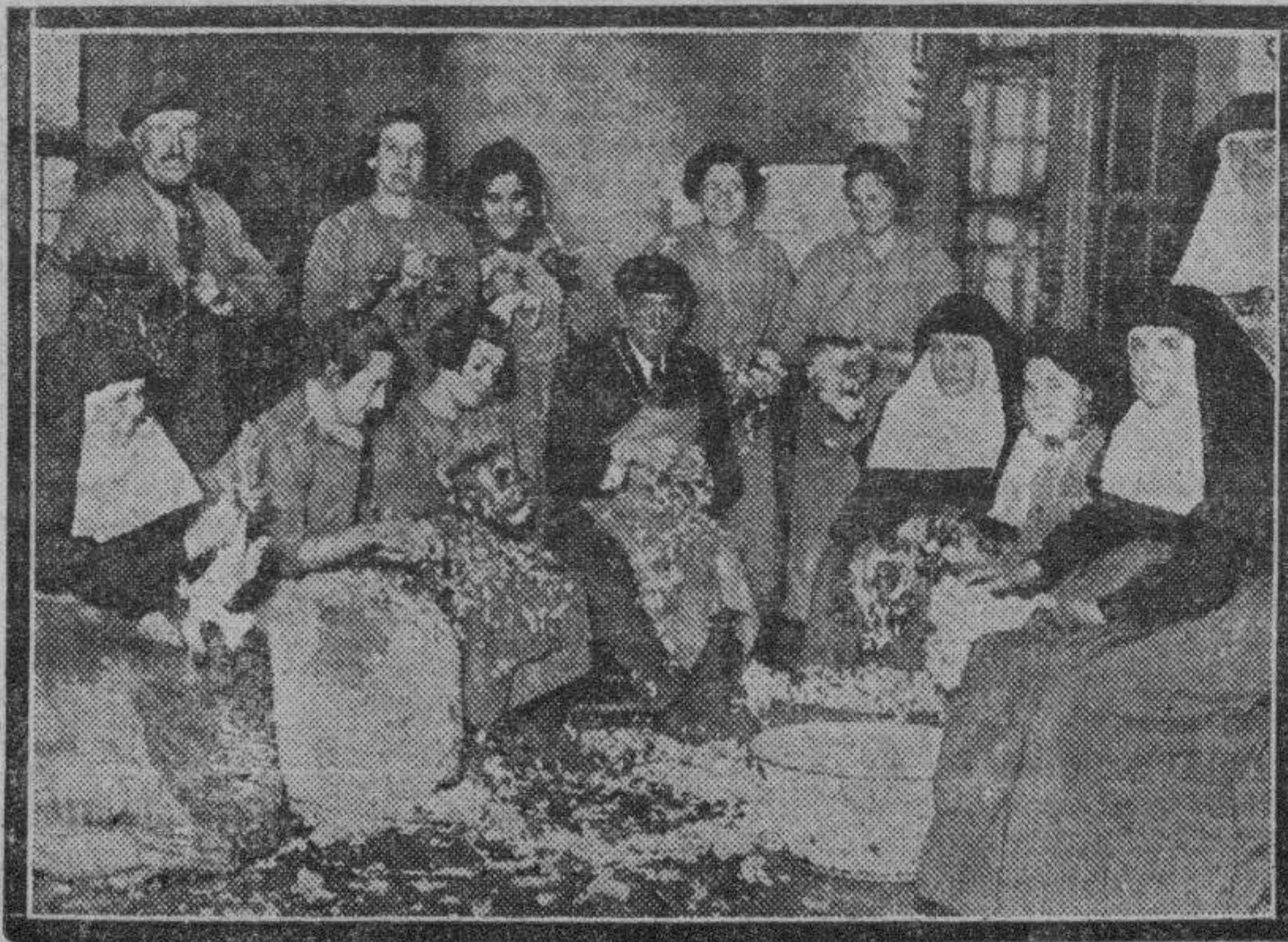
El gran trajín que hay en el Hospicio. En las cocinas, religiosas y asiladas preparan los pollos para la gran comida de la Pascua.

Muchas gracias a todos estos amables donantes.