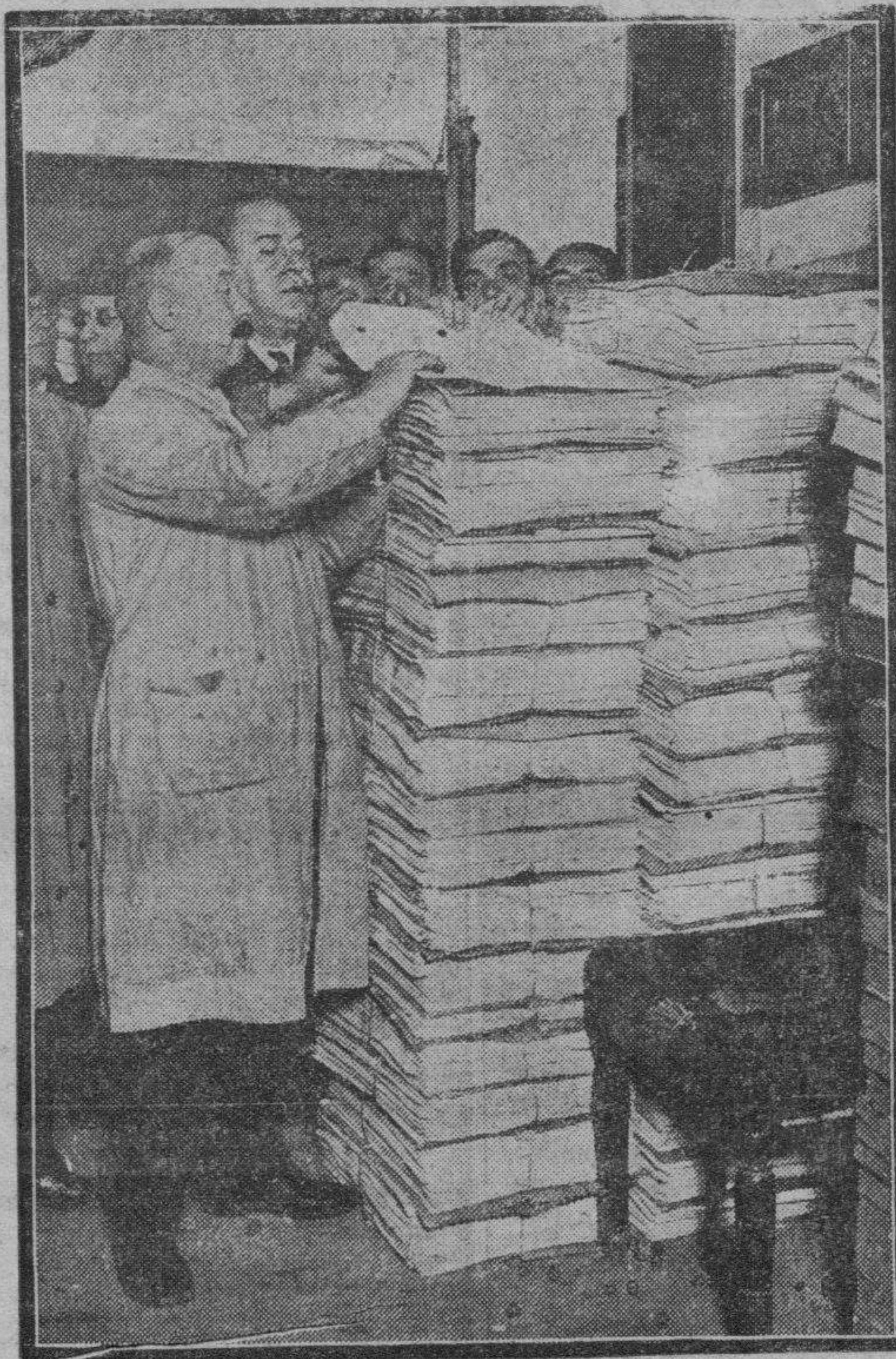
Estas piladas de papel son los billetes de la lotería de Navidad que se quedaron sin vender, caso insólito el de este año, porque siempre este clásico sorteo tuvo una gran demanda de papel. Entre estos billetes está el 2.4717, por cuyas dos series hubiera tenido que pagar el Estado la respetable suma de treinta millones de pesetas.