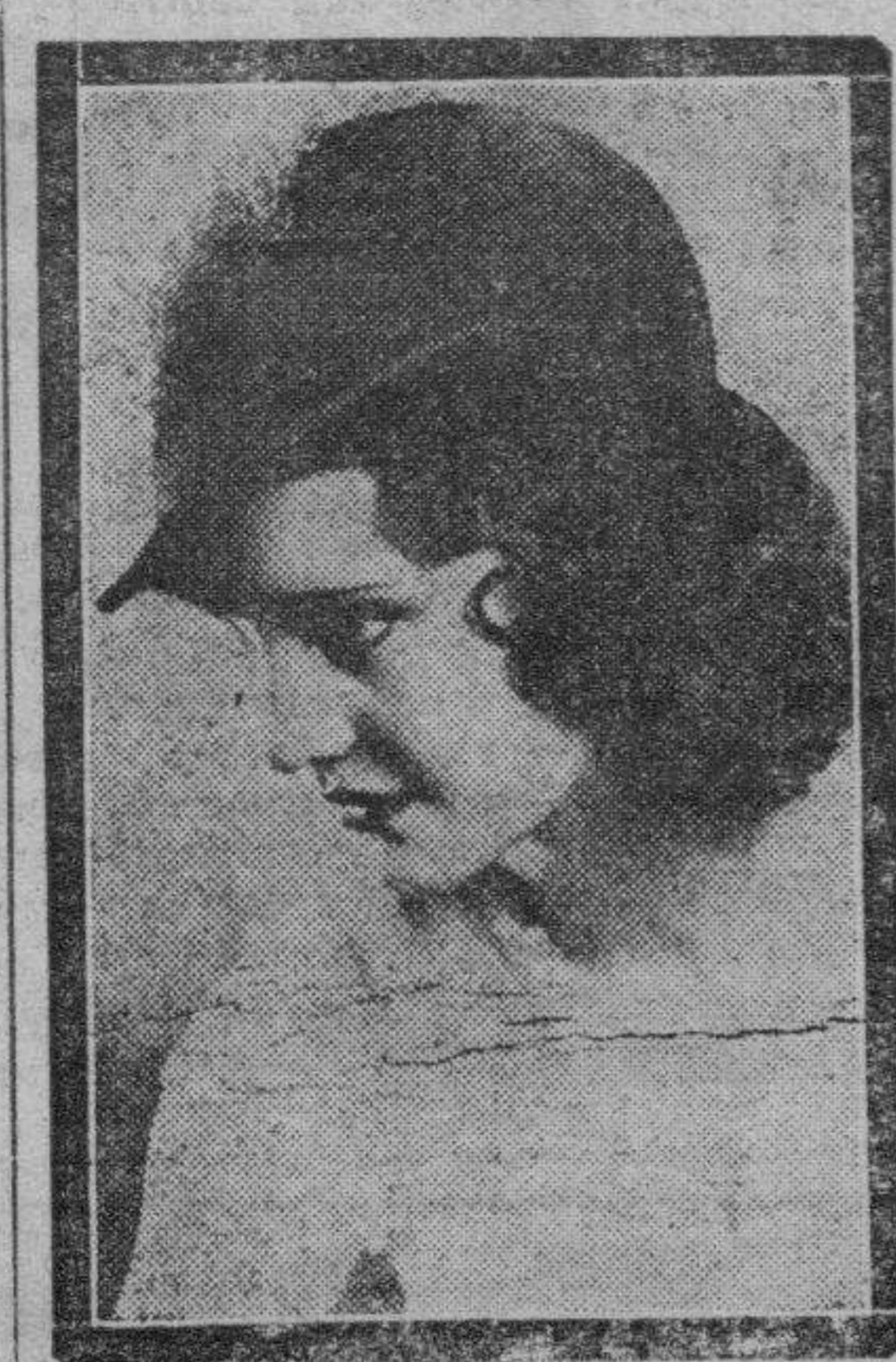
Este sombrero, tipo emperatriz Eugenia, está confeccionado en verde oliva, adornado con una pluma de avestruz. Lo exhibe la actriz cinematográfica Rochelle Hudson.