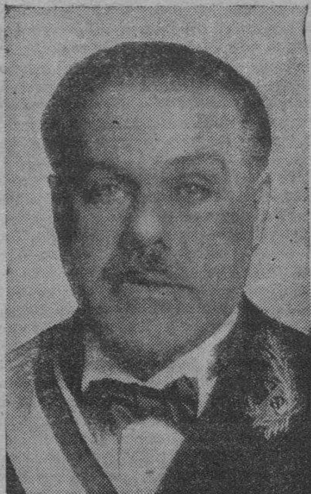
El conde de Guadalhorce, ministro de Fomento en el Gobierno dictatorial de Primo de Rivera, que fue quien puso en ejecución el plan confederativo expuesto por don Manuel Lorenzo Pardo.