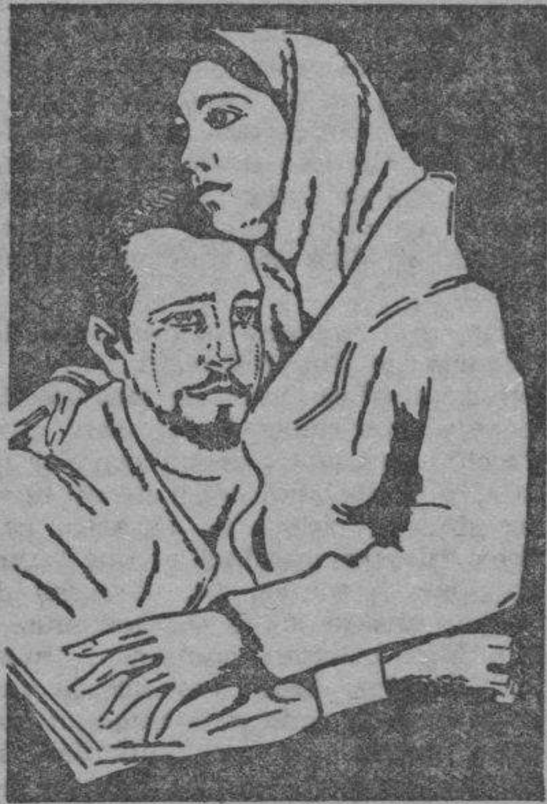
Una interesantísima escena de la película hablada en español "Resurrección", próxima a estrenarse en esta ciudad.