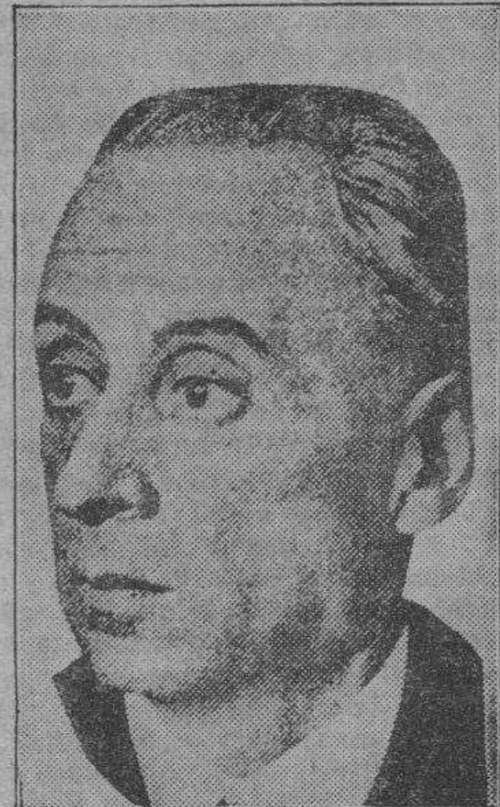
Don Alvaro de Albornoz, actual ministro de Fomento, que ha procedido a la transformación de las Confederaciones en Mancomunidades, por entender beneficioso este plan de organización.

Pero aseguramos que si nos dolió, por injusta, aquella campaña que contra nosotros se intentó, nos deparó, en el fondo, una íntima satisfacción: la de haber estimulado nuestros entusiasmos en defensa de una obra que es capital para el porvenir de Aragón. La hemos defendido con todo tesón, con toda energía, con todo desinterés, pidiendo insistentemente su continuación, protestando