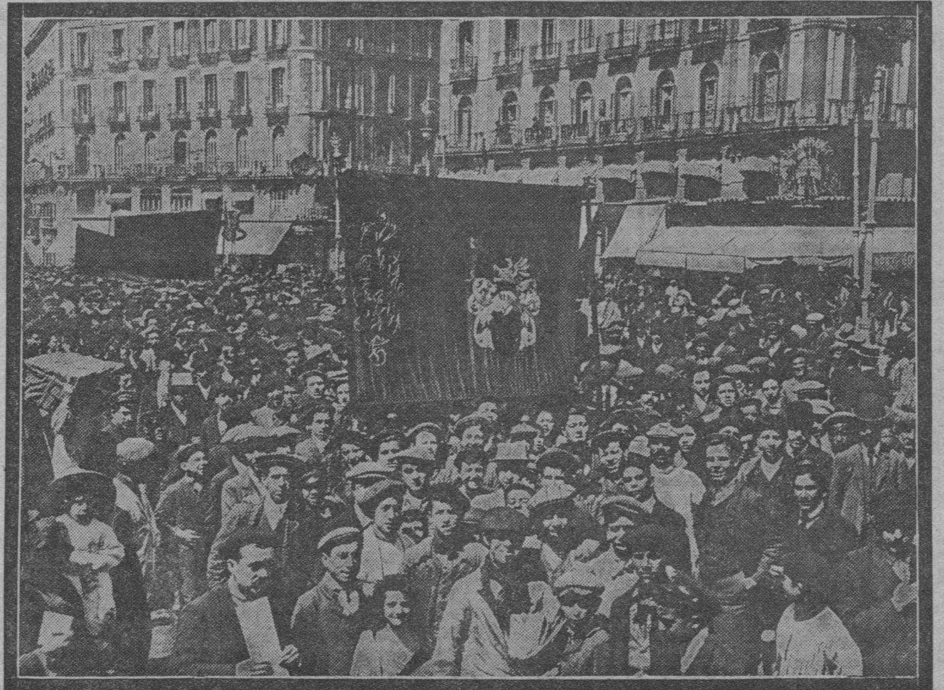
He aquí otra manifestación, ésta en Madrid, con motivo de la Fiesta del Trabajo. Se trata de la del año 1909, a raíz, como la de hoy, de unas elecciones municipales, elecciones que fueron famosas por haberse aplicado a ellas el ensayo de voto obligatorio, que dió por resultado una gran incrementación en el número de votantes.