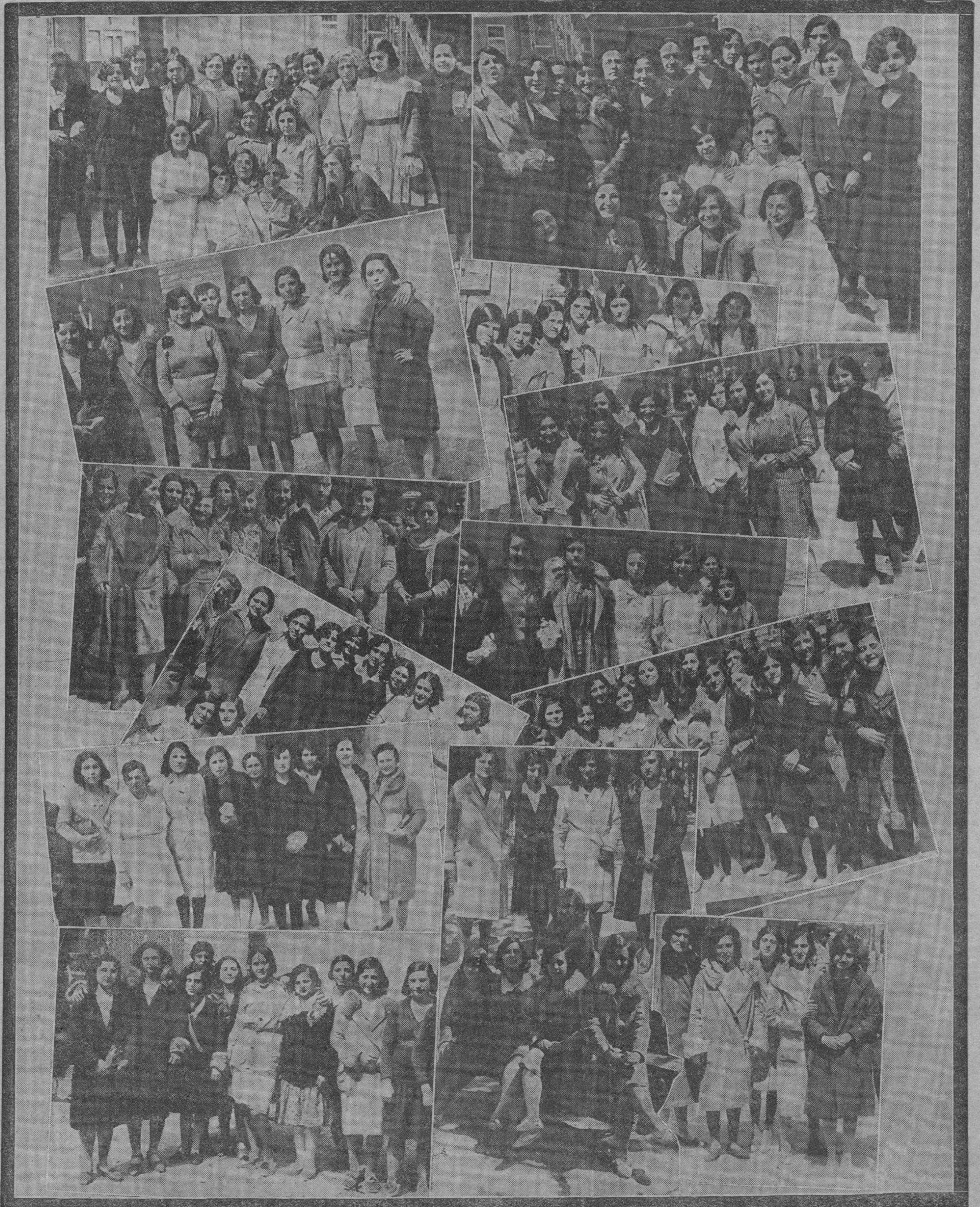
Aquí están, guapas y juncales, las lindas obreras zaragozanas, sorprendidas por nuestro fotógrafo en estas mañanas primaverales, camino del taller o de la fábrica. No están todas, ni siquiera una pequeñísima parte de ellas, porque es imposible recoger en una página de periódico tantas y tantas obreras como hay en Zaragoza. Pero éstas, elegidas al azar, representan gallardamente a todas ellas, a esa simpática legión de muchachitas modestas y laboriosas que, en las primeras horas de la mañana, prenden en la ciudad la gracia de sus donaires, camino del trabajo que les aguarda.