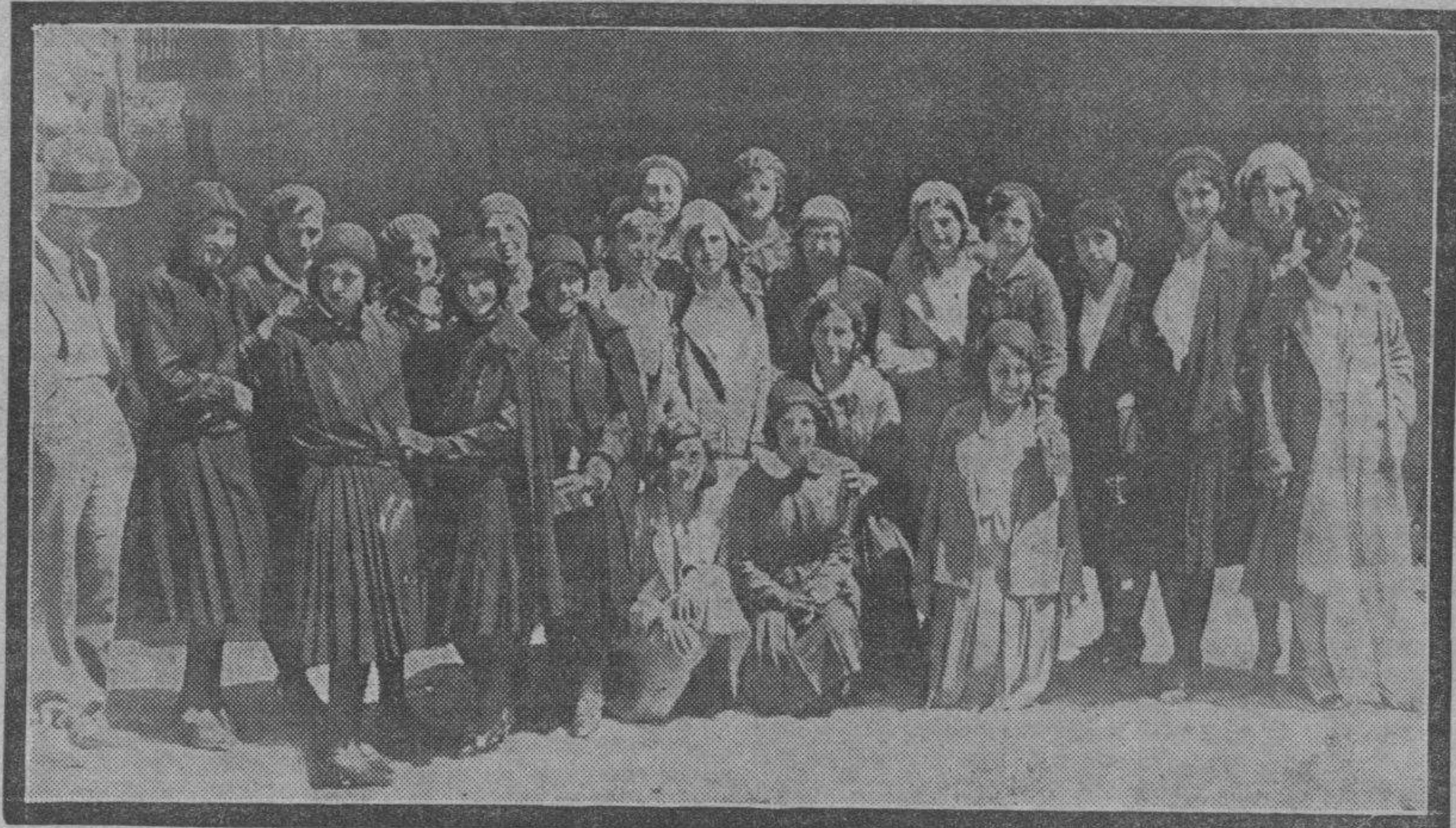
Las alumnas de la Normal de Maestras de Logroño, que visitaron nuestra ciudad en viaje de estudios, sorprendidas por nuestro fotógrafo en el cívico Arco del Deán, realizada su natural belleza por la luminosidad de la mañana primaveral.