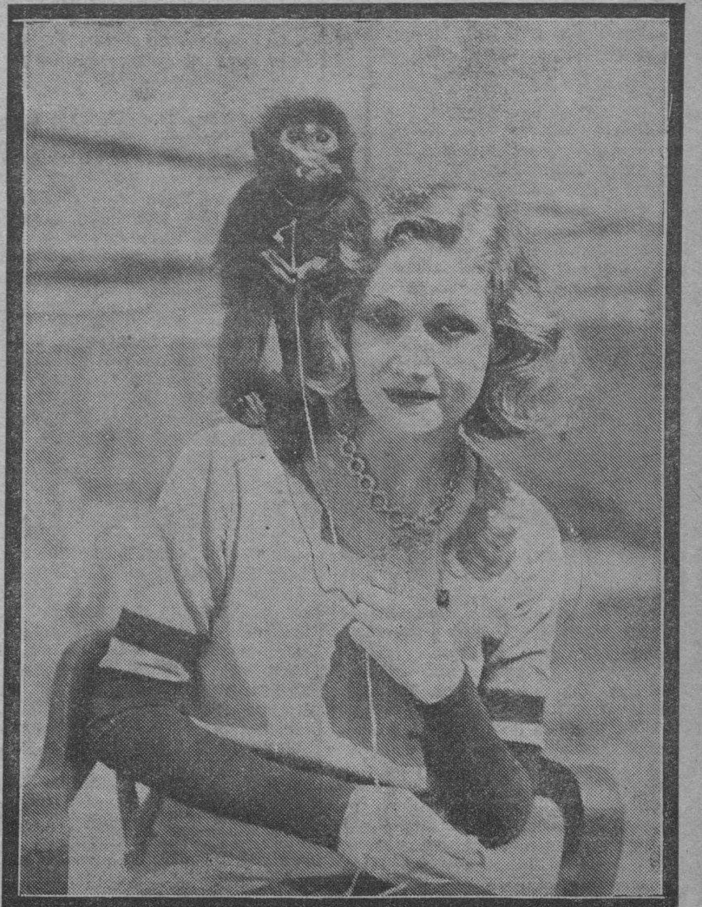
Edwina Booth es una preciosa criatura de facciones energicas y ojos apasionados, que destacó su personalidad artistica en la película de la Metro-Goldwyn-Mayer "Diosa Blanca", consiguiendo justamente el codiciado titulo de "estrella".

La foto presenta a Edwina en su visita al Parque Zoológico Nacional de California, haciendo buenas migas—¡cómo no!—con un mono muy mono.