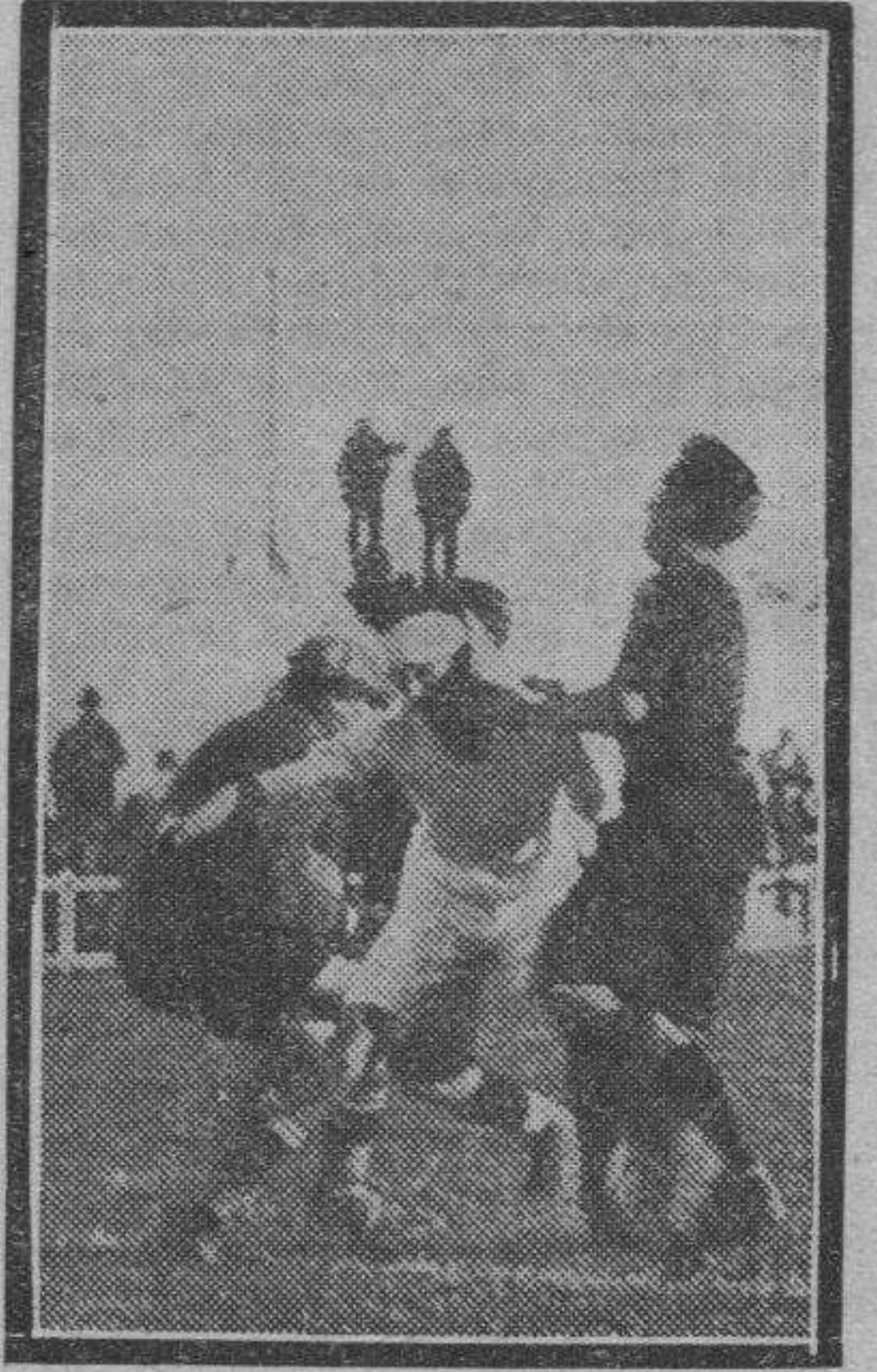
Un acoso a la meta baracaldense.