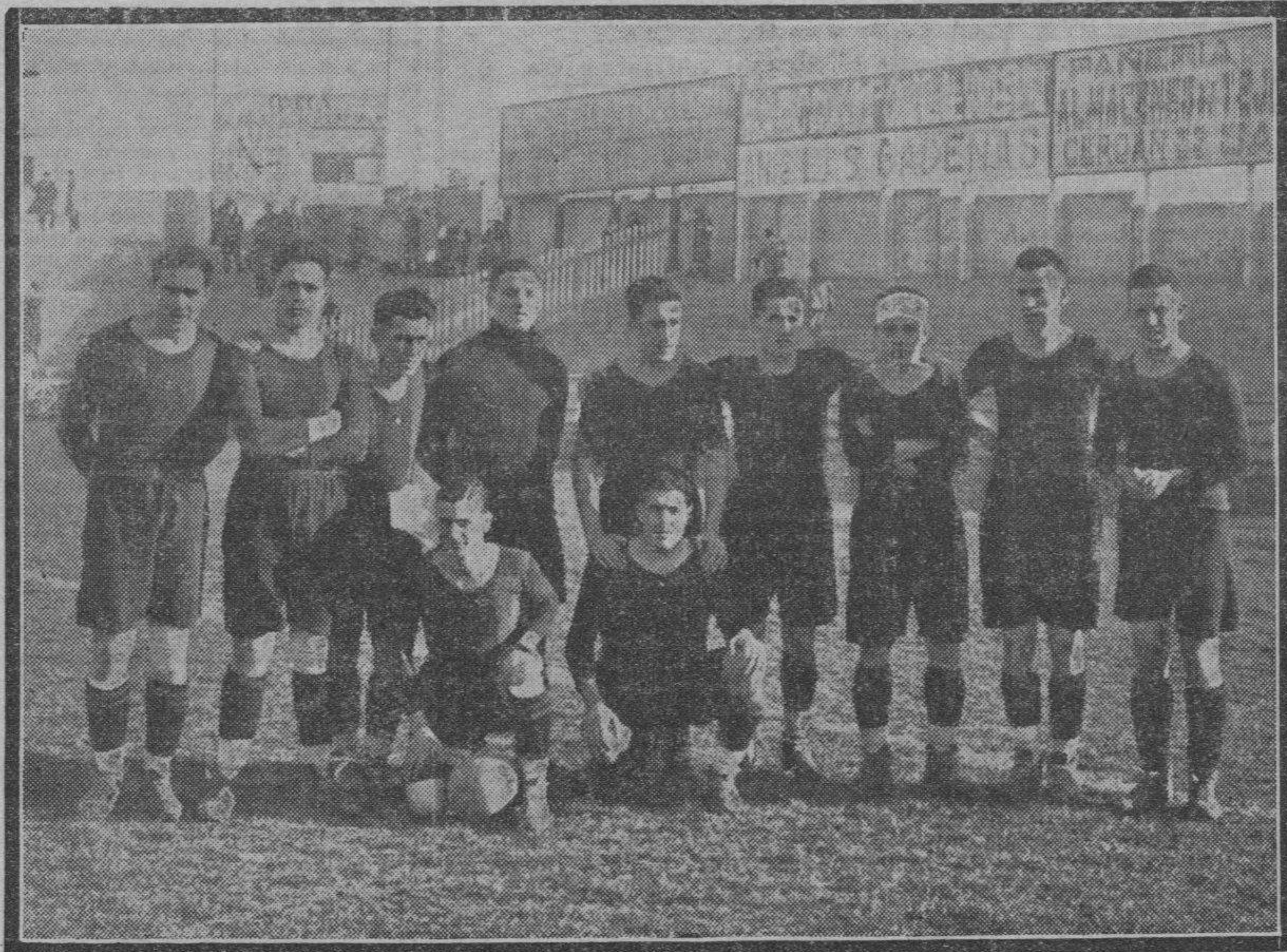
Los vencedores—sin Quintana, ¿eh?—del subcampeón aragonés.

BILBAO. — En el campo de San Mamés y con buena entrada se ha celebrado el partido Atlético de Bilbao-Español. Desde los comienzos se vió que el partido carecía de calor por la victoria franca y rápida de los locales, que en pocos minutos se anotaron tres goals, siendo el primero obra de Iraragorri, de espléndido cabezazo. El segundo lo logró el mismo jugador, al poner fin a una melée ante la puerta españolista de un chut potente y seco, y el tercero debido a un chut imponente de Luis Uribe, que fué acogido con una gran ovación. Se lesionó el portero español.