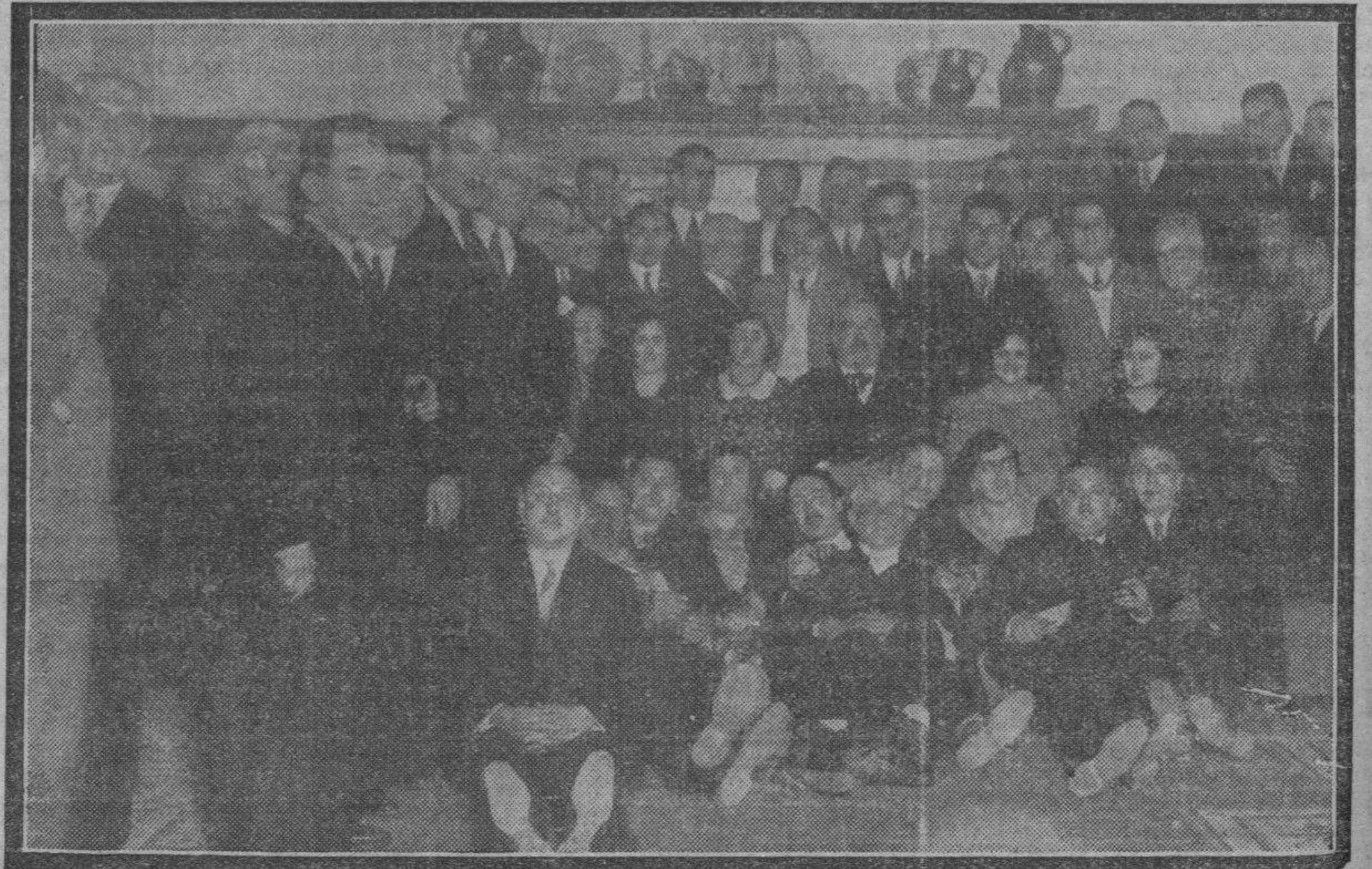
Un grupo de asistentes al banquete celebrado por la colonia caspioina en la Posada de las Almas. (Véase la información en la pág. 7)

Quedan complacidos nuestros comunicantes.