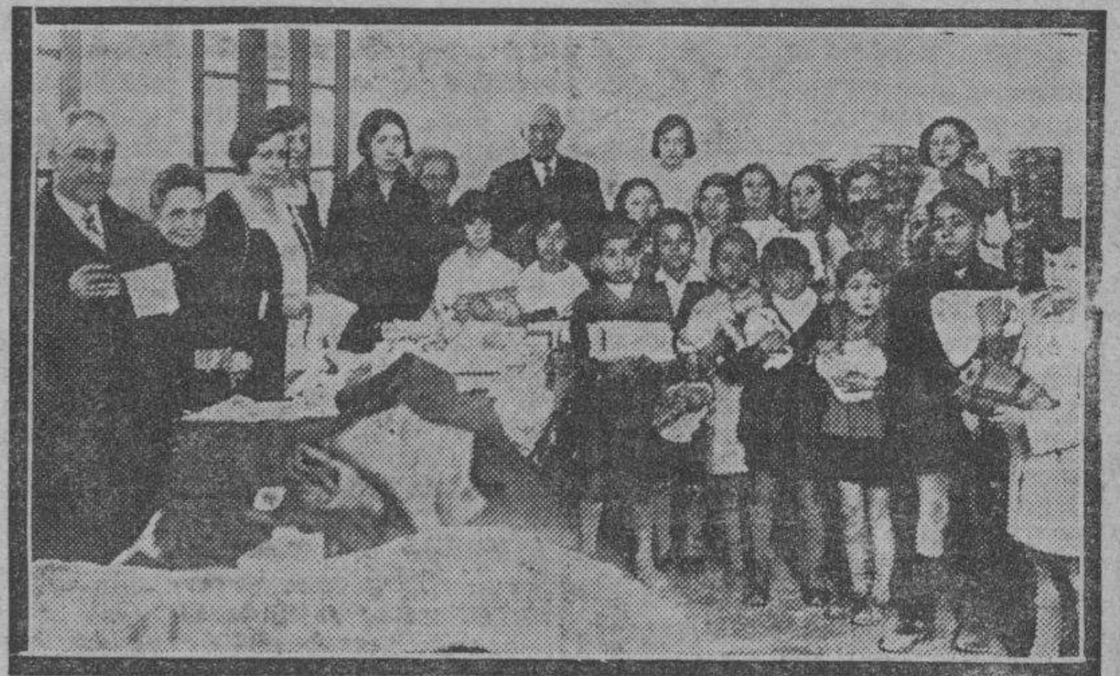
Reparto de prendas a los niños pobres que asisten a la graduada de Gascón y Martín.

Los heridos fueron todos curados en el Hospital provincial, siendo sus lesiones de bastante importancia. — CANO.