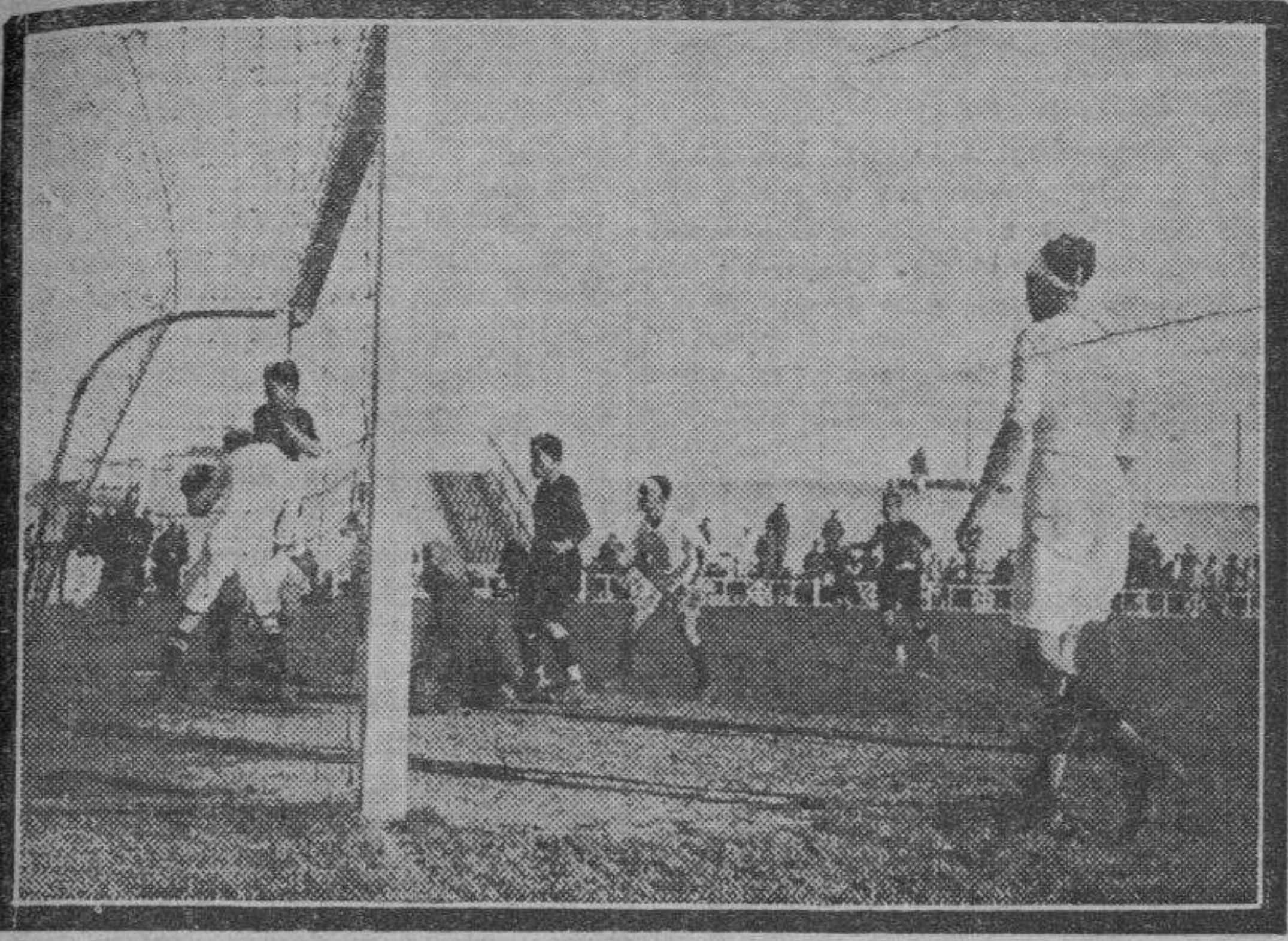
El primer "goal" marcado al Patria.

A las órdenes de Saracho formaron los equipos: