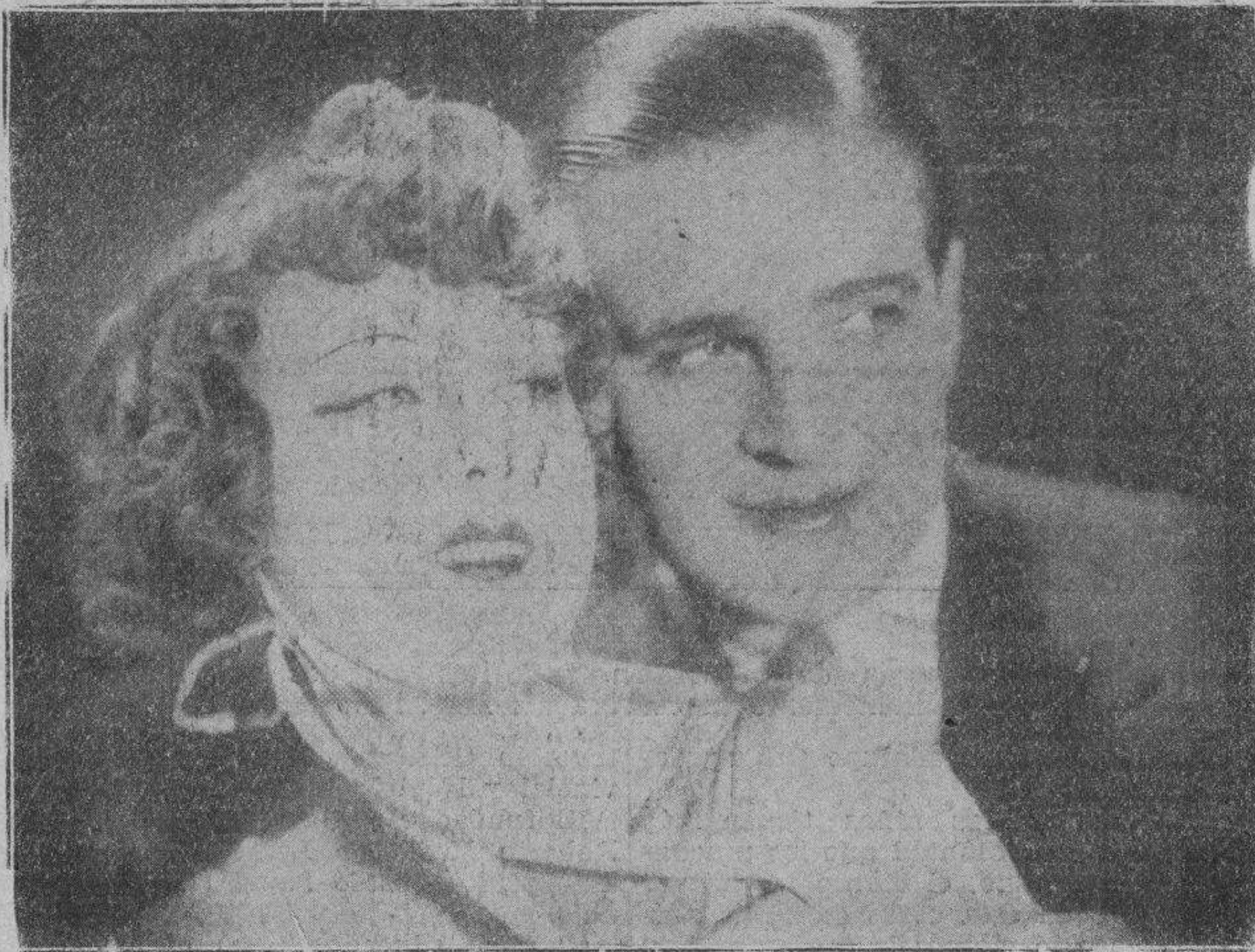
Una escena de "SUZY, SAXOFON"

El francés, sin embargo, no se dejó vencer. Antes bien, nos reconvino porque no considerábamos seriamente su credo espiritualista.