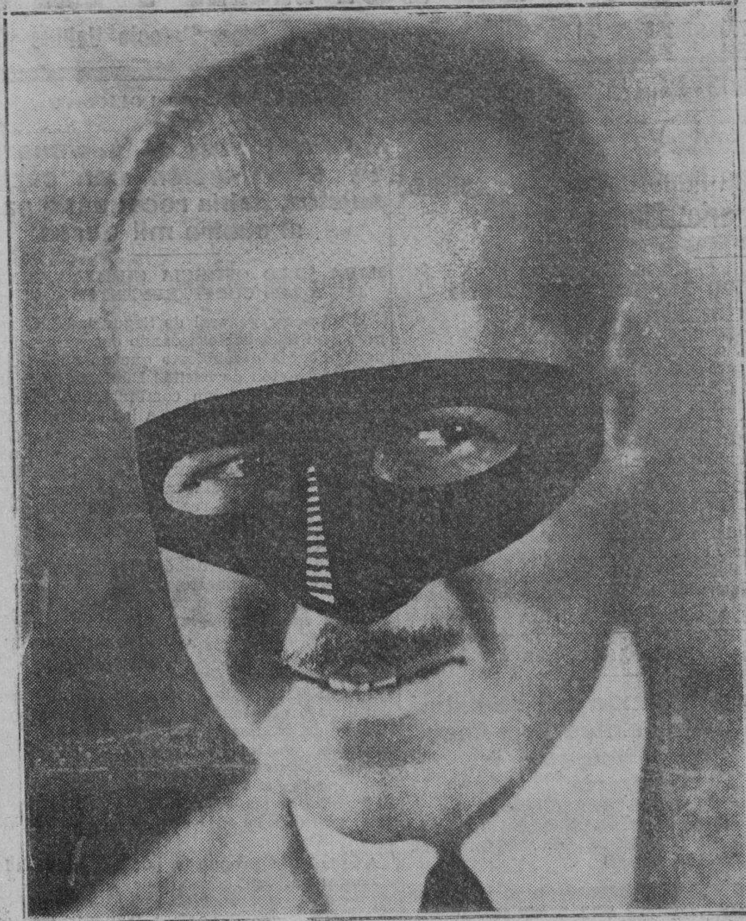
¿Qué artista de la pantalla se oculta tras este antifaz?