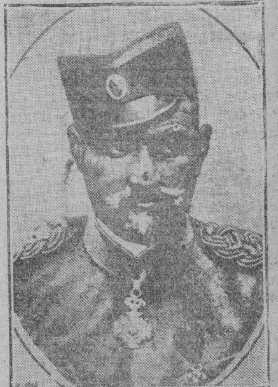
El general Ziwkowitz, que fué designado por el rey Alejandro, para formar el nuevo gabinete yugoeslavo

Una vez más reiteró el alcalde su propósito de inaugurar este Mercado en breve plazo, activando para ello las obras que están a punto de terminarse. Se convino en proceder a su inauguración el día 22 del corriente, coincidiendo con el segundo aniversario de la elección de don Miguel Allué Salvador para la Alcaldía de Zaragoza.