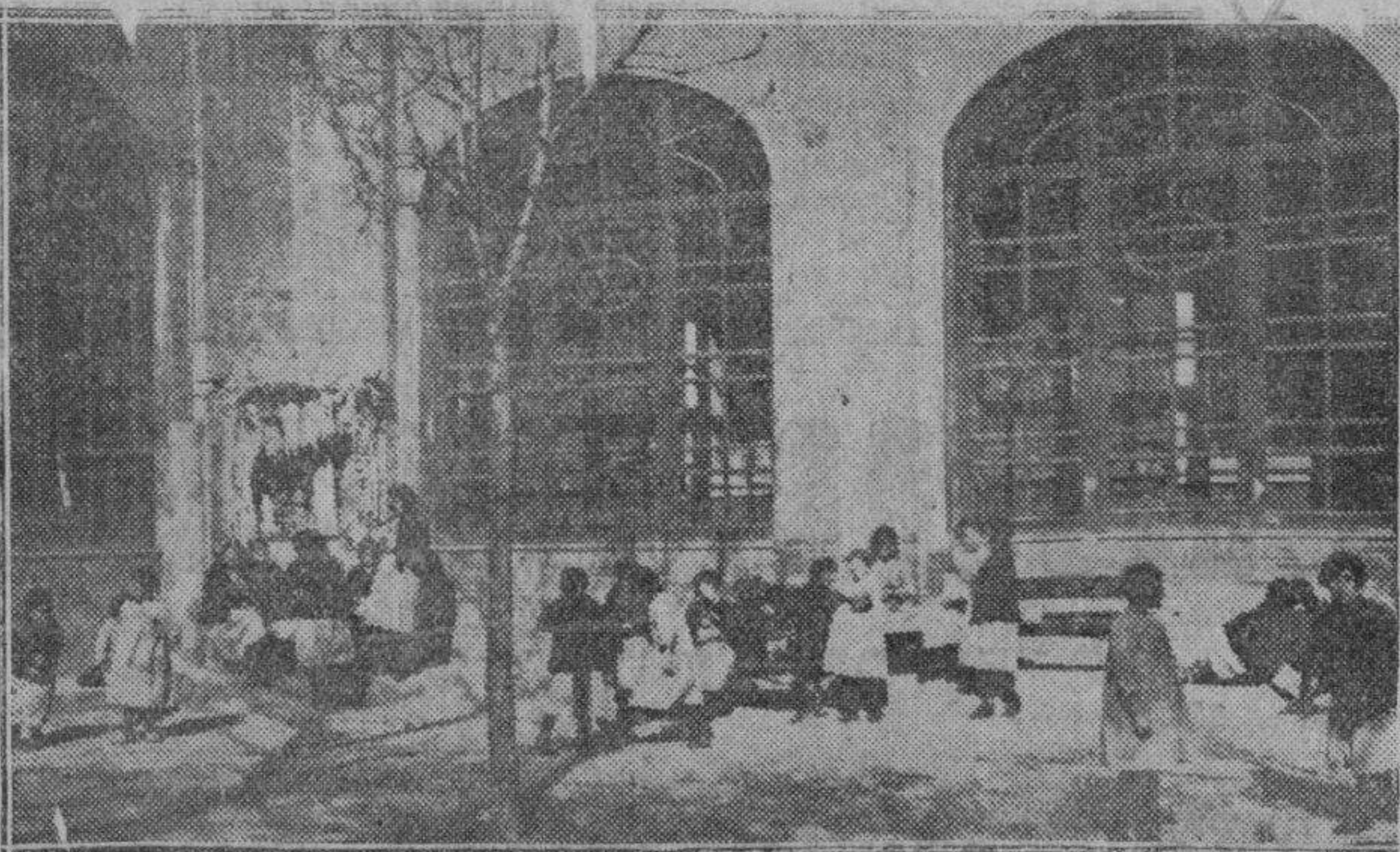
Un rincón del patio de recreo de las niñas.

La Excm. Diputación, teniendo en cuenta que uno de los factores principales en la edu-