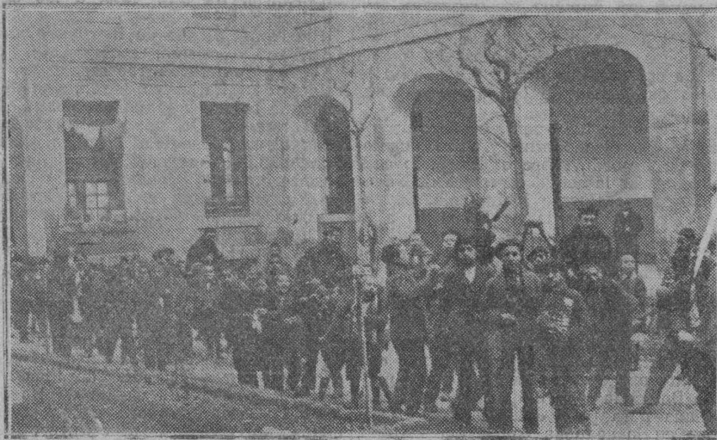
Los niños saliendo a su recreo

Todos juegan y ríen contentos. En sus caras condescendientes no entraron aún las pesadumbres de la vida.