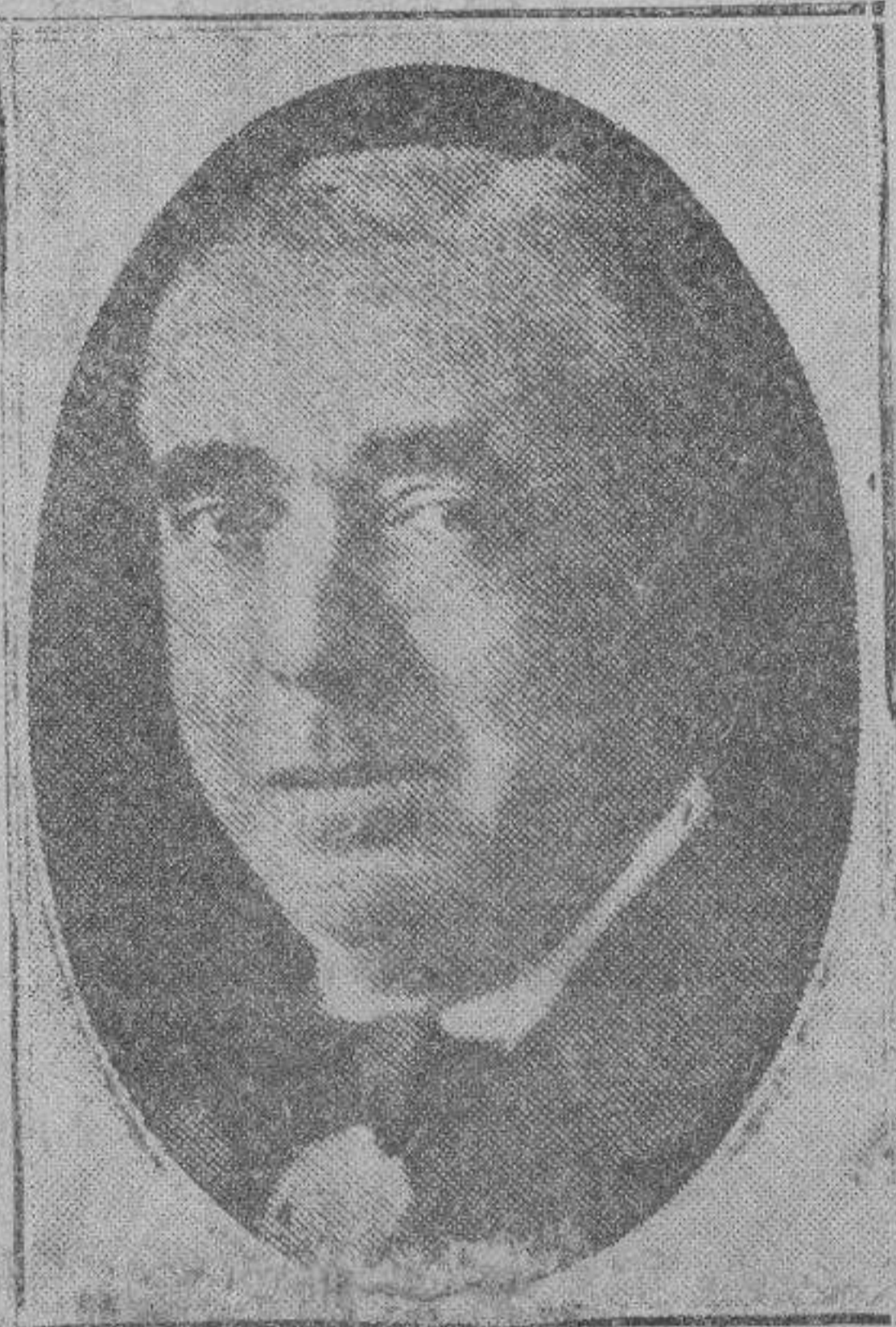
BARCELONA.—El ilustre artista Adrián Gual que se halla enfermo de gravedad