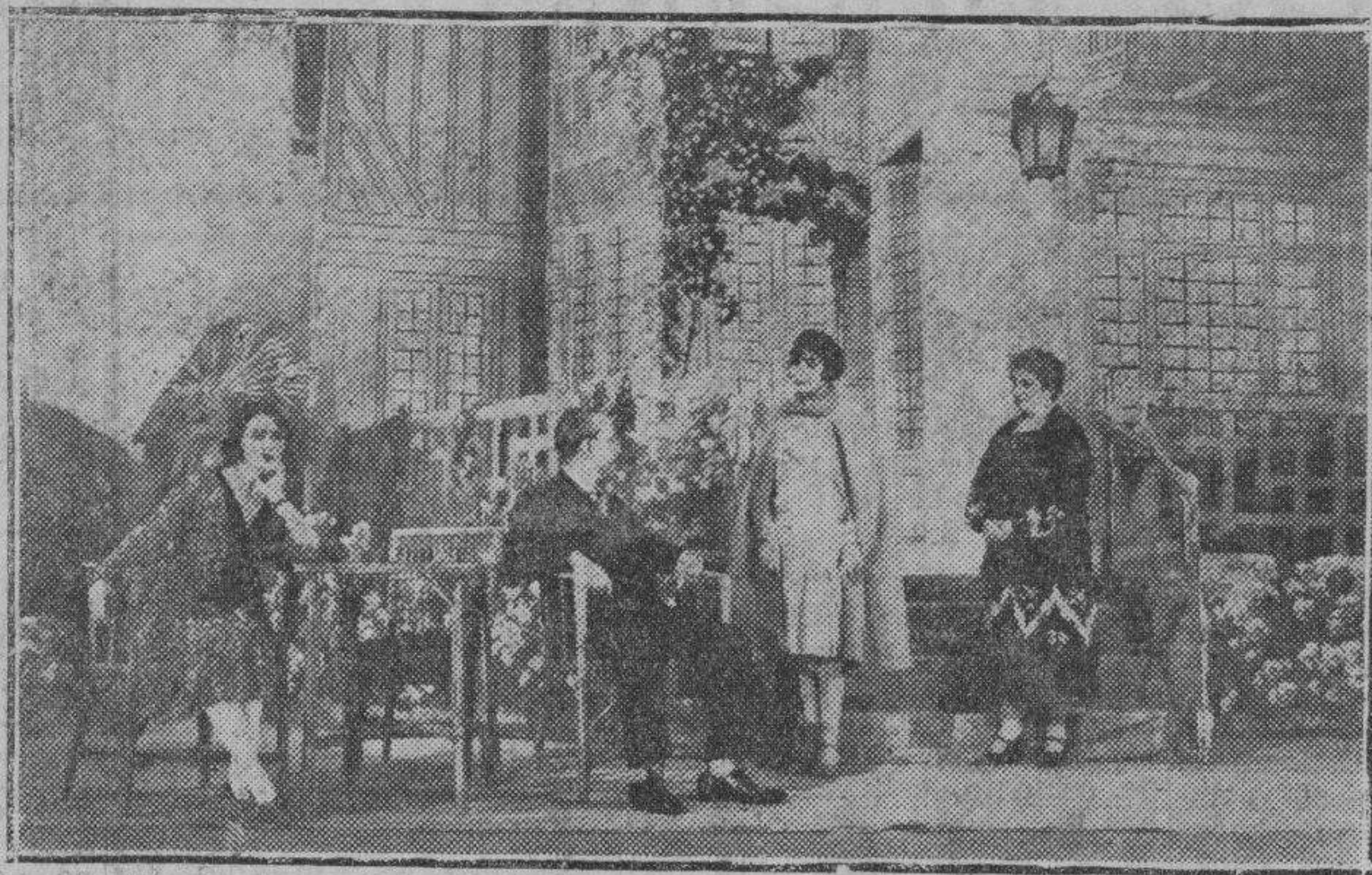
Una escena de la nueva comedia de los hermanos Alvarez Quintero, titulada «Novelera», que se estrenó anoche en el teatro Fontalba por la Compañía de Margarita Xirgu