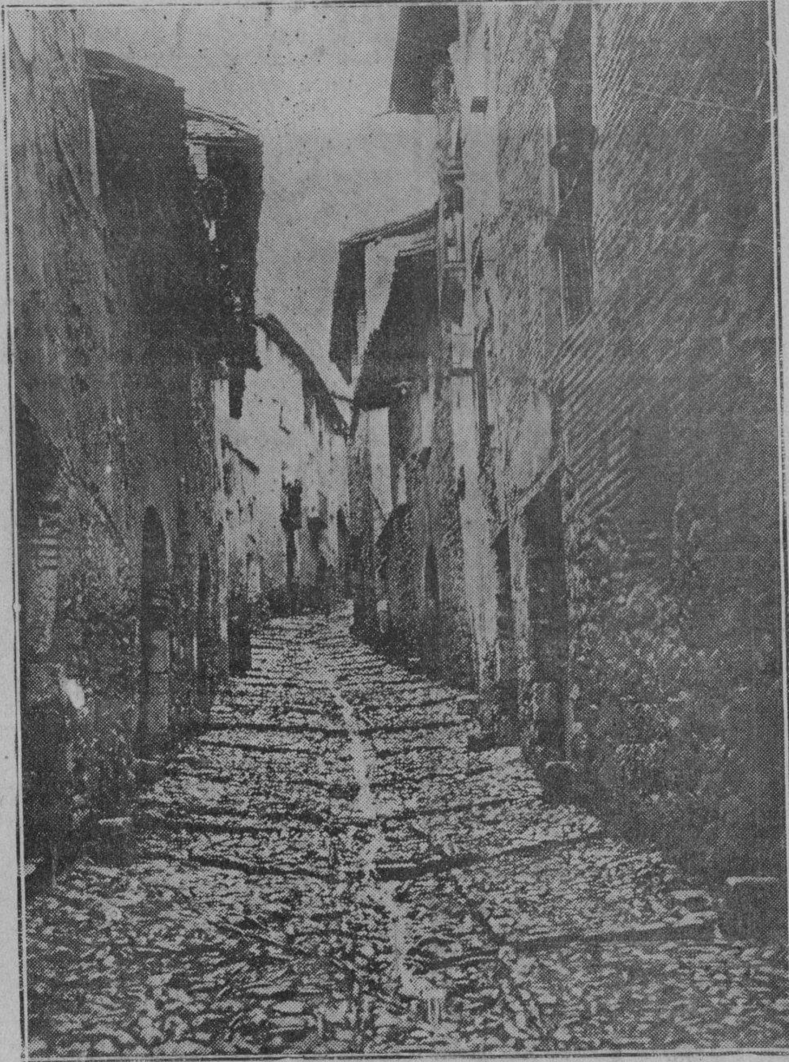
Jna calle de Alquézar

Ya que no solicitar sea declarada monumento nacional, debe, por lo menos, ponerse bajo la custodia de un patronato, que vele por sus tesoros artísticos