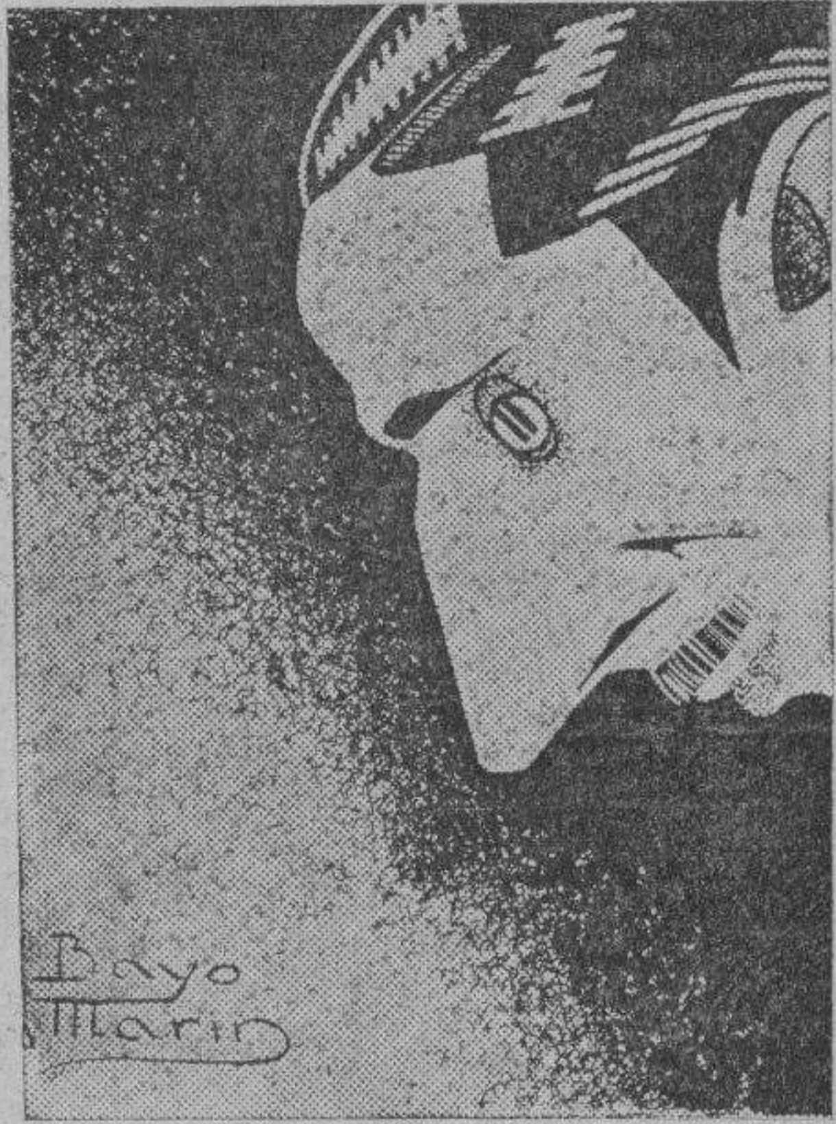
Autocaricatura de Bayo Marín

Un día, hace unos cuatro meses, se presentó en la Redacción y, en medio de varias agu-