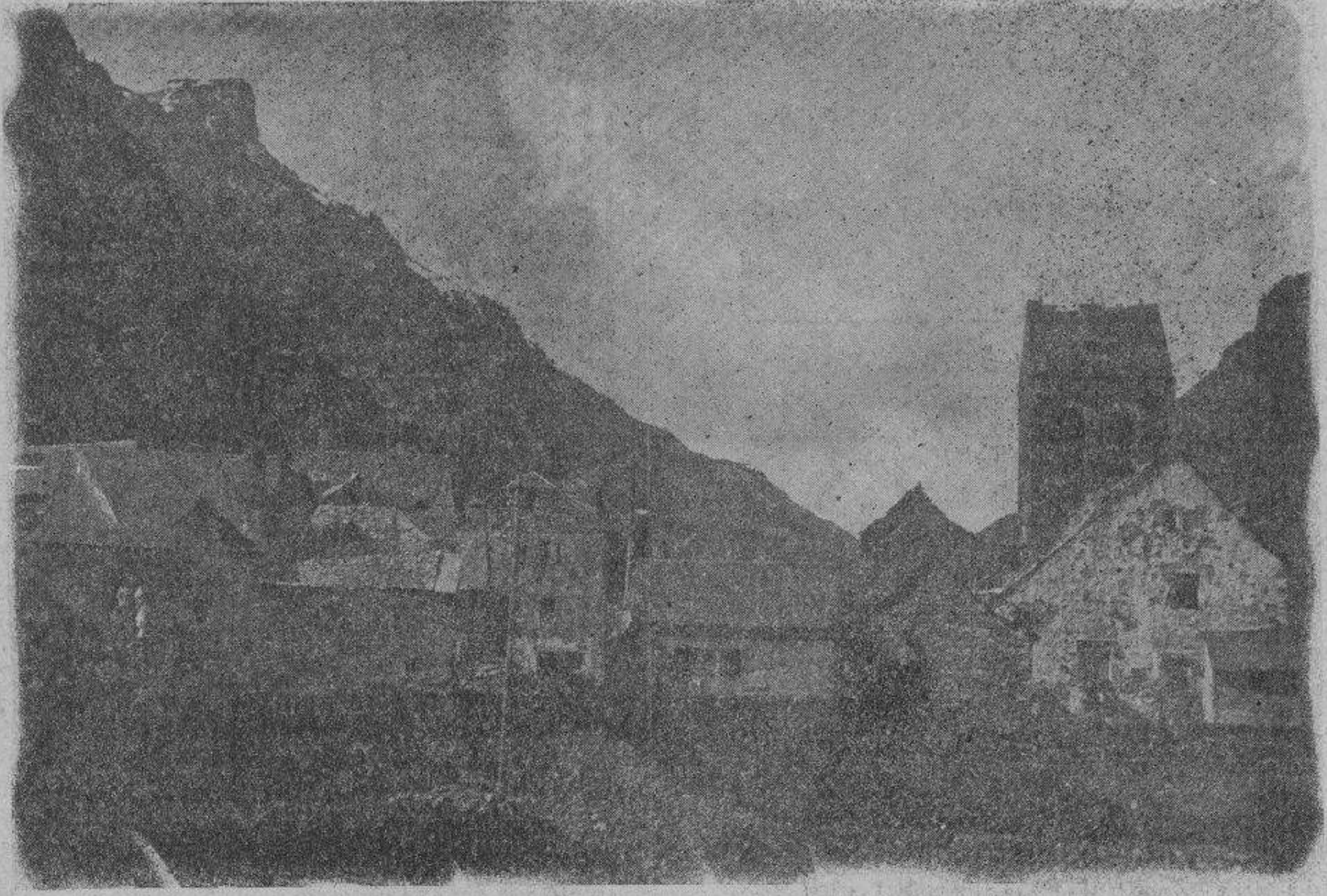
Vista de Canfranc, desde la carretera

No hay que asustarse cuando se lea la trágica lista de los martes. Es la inevitable contribución que se paga al Progreso, y cuando más larga sea la lista más feliz será el pueblo que tenga que llorarla. Cada hombre que muere en un automóvil supone diez hombres menos que mueren de miseria. Cuando no haya ni plagas, ni hambre, ni guerras, los hombres morirán de bienestar: es decir, en su automóvil propio, en su aeroplano propio. Y entonces podrá decirse que la Humanidad ha alcanzado su meta de progreso material y moral.