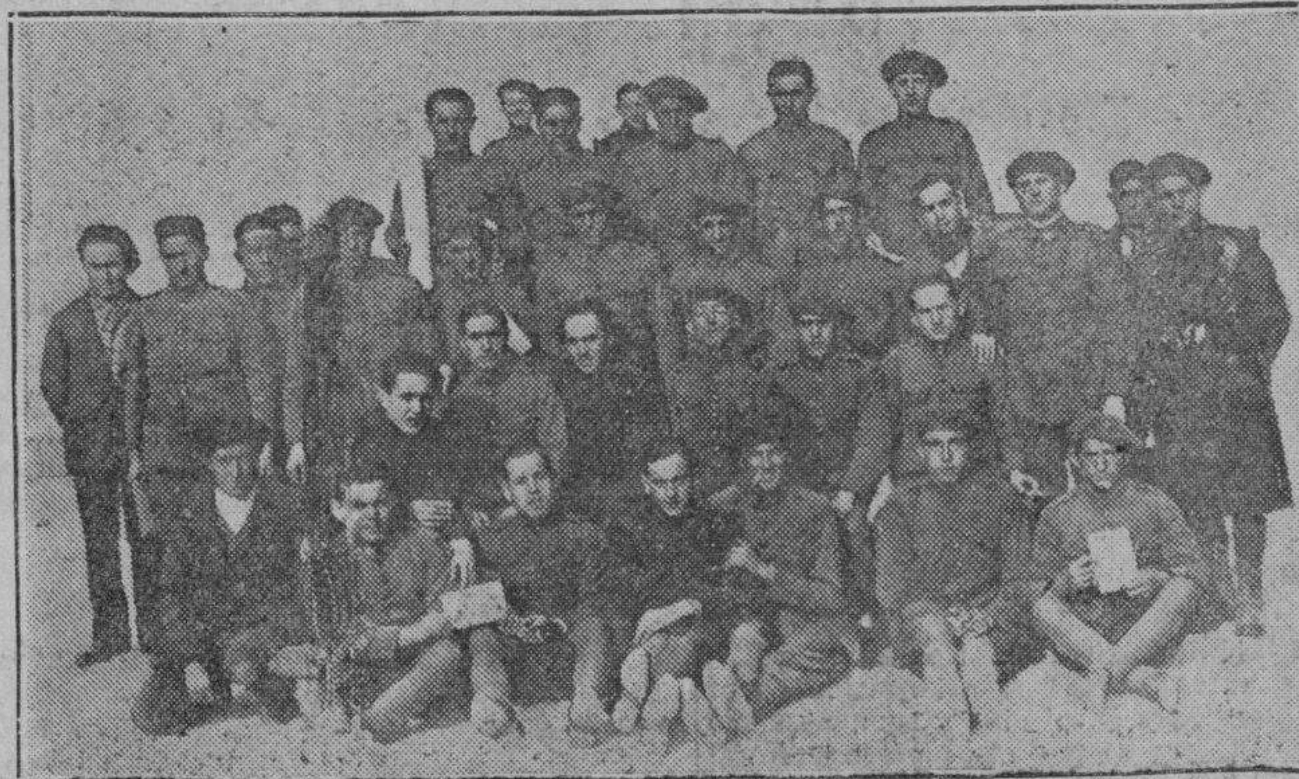
EN EL CUARTEL DE GERONA.—Reparto de premios a los soldados distinguidos