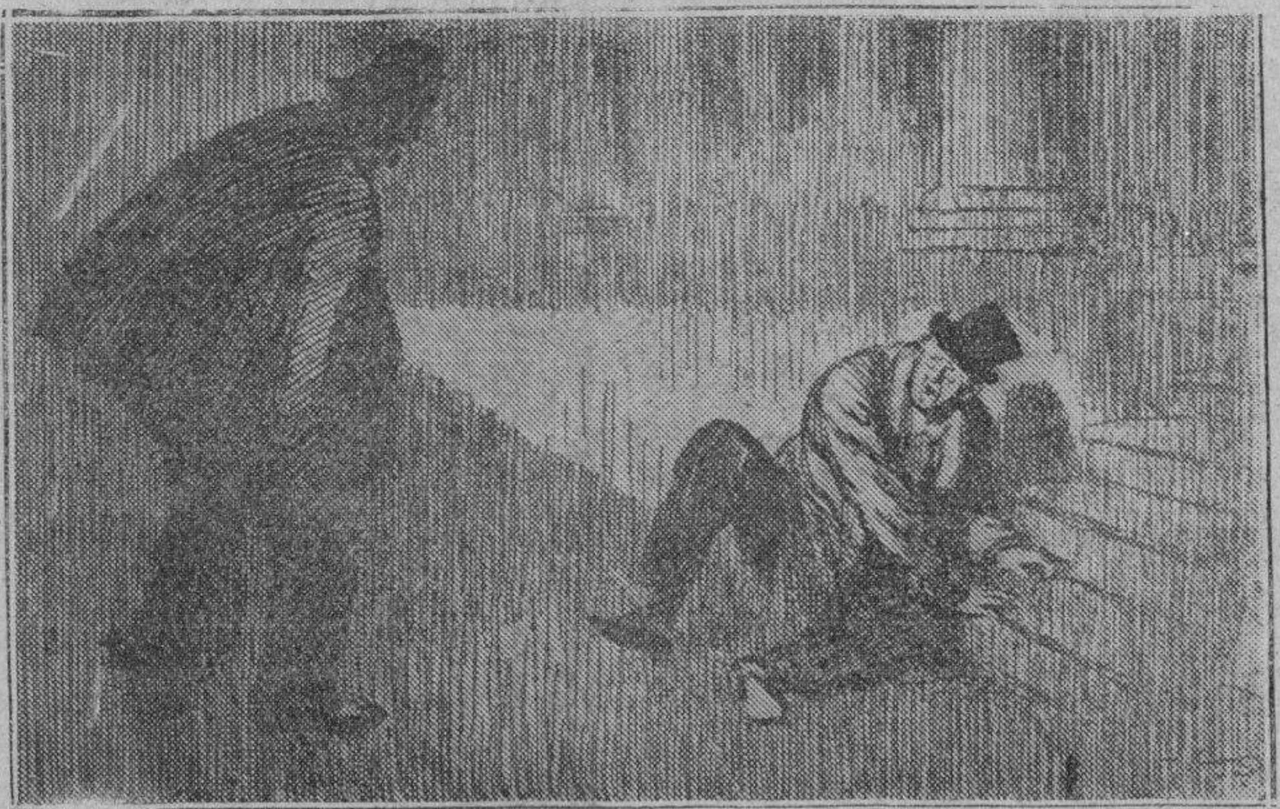
El vigilante.—¡Eh! ¡Haga el favor de seguir por su camino! El borracho (deslumbrado súbitamente).—¡Calla, imbécil! Más te valía avisar cuando la bocina...