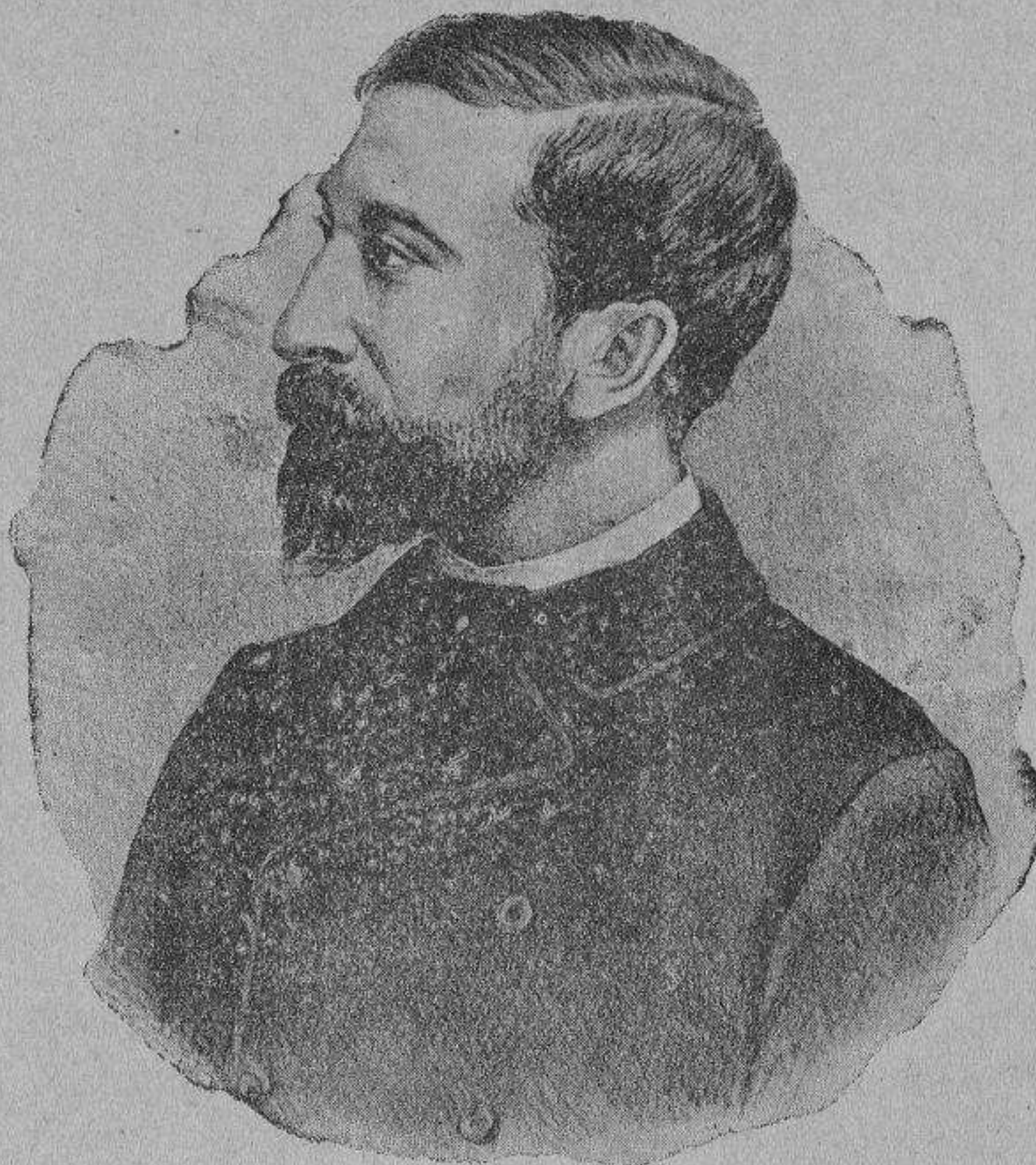
EXCMO. SR. MARQUÉS DE COMILLAS