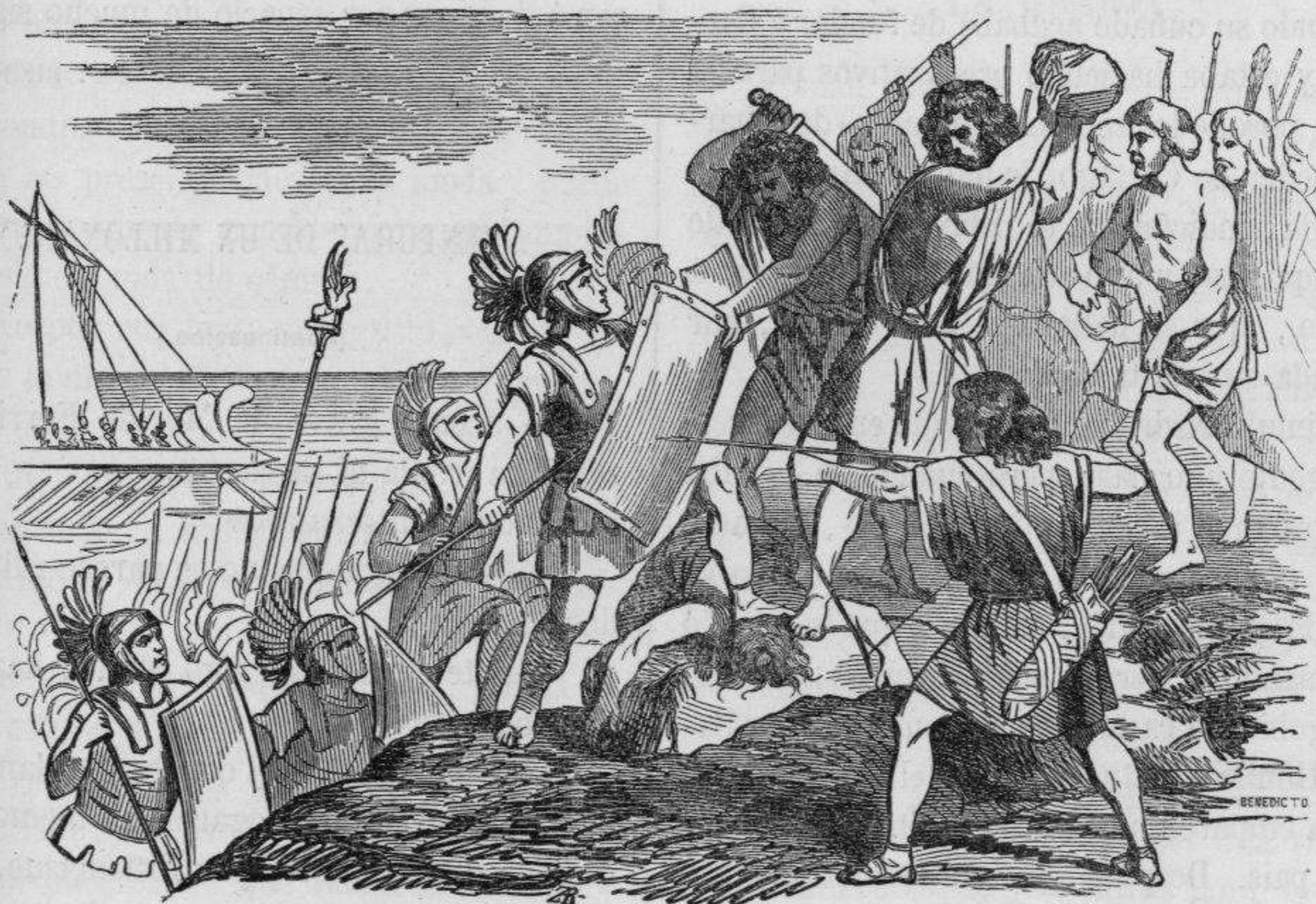
Desembarco de los Cartagineses en las Baleares.

Apenas llegó Amilcar á nuestra península, conquistó la Bética, siendo entonces tan rico este país, que se asegura tenían los pesebres y