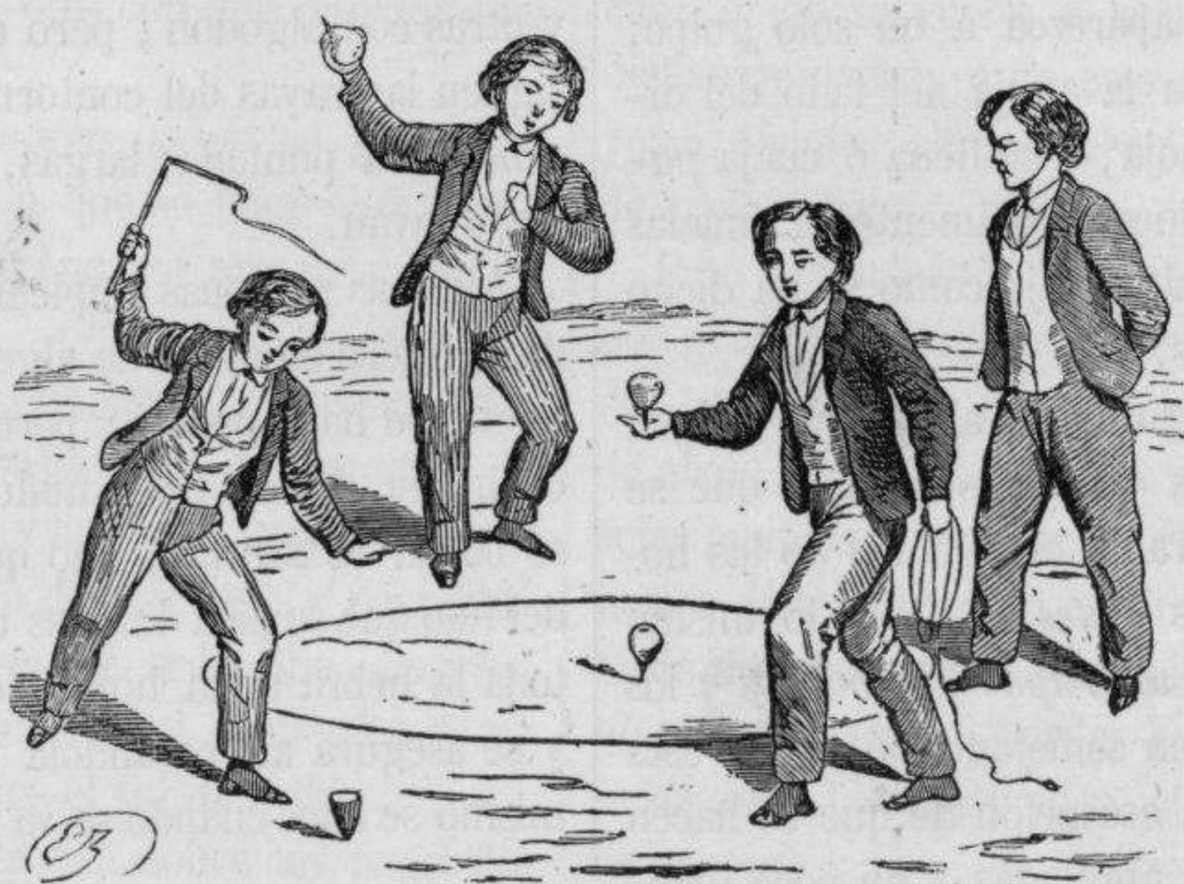
Juego del trompo, peonza, y trompo alemán.