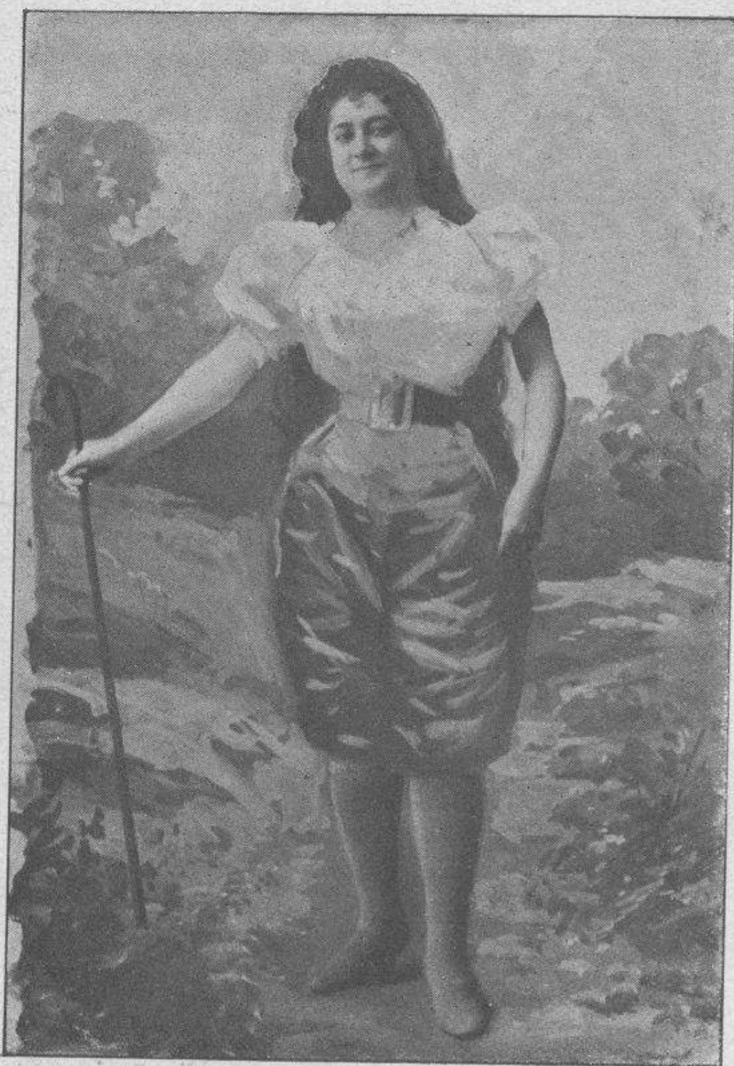
Otra será la Arcadia seductora vistiendo de este modo á la pastora.