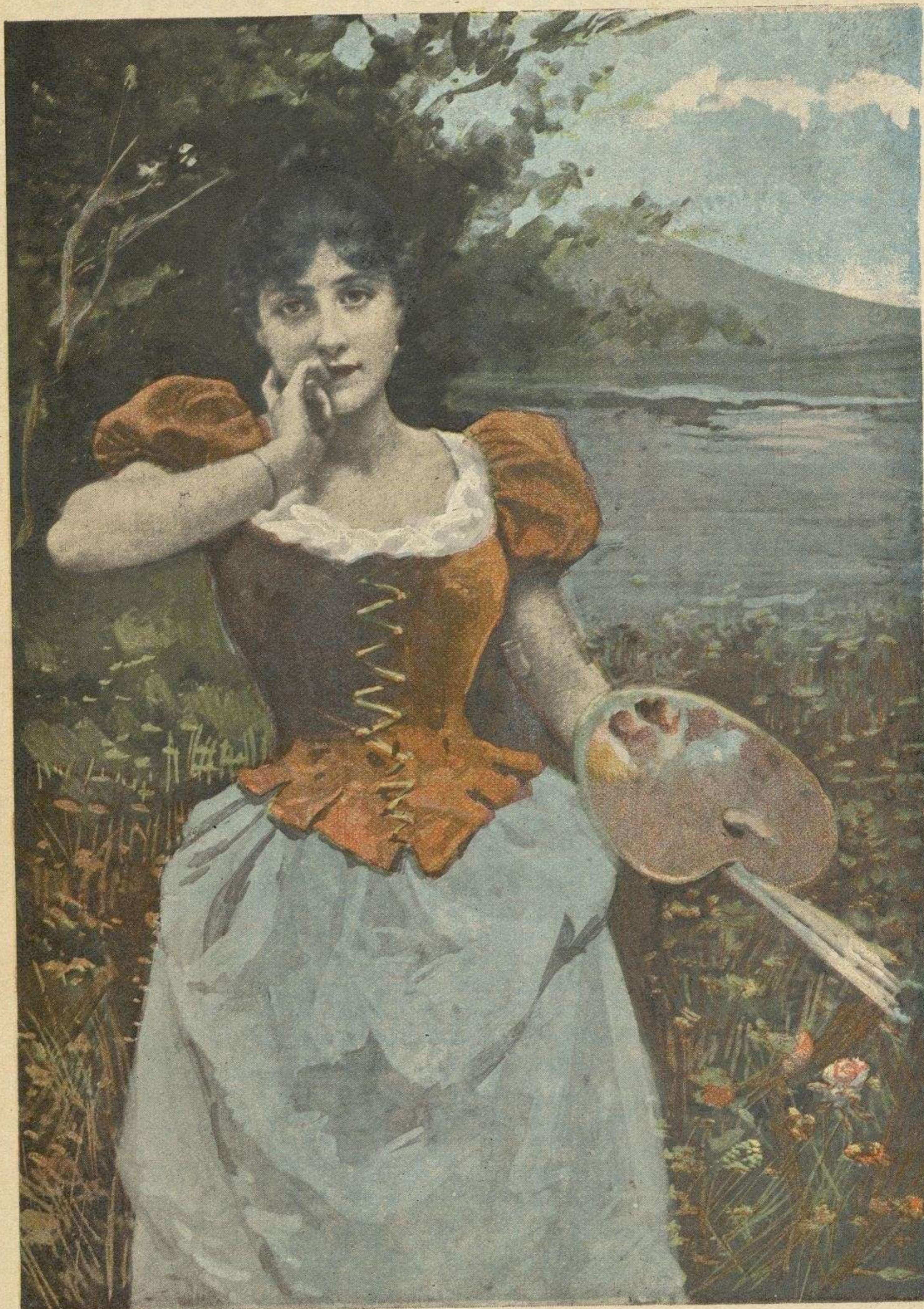
- Mi estudio.