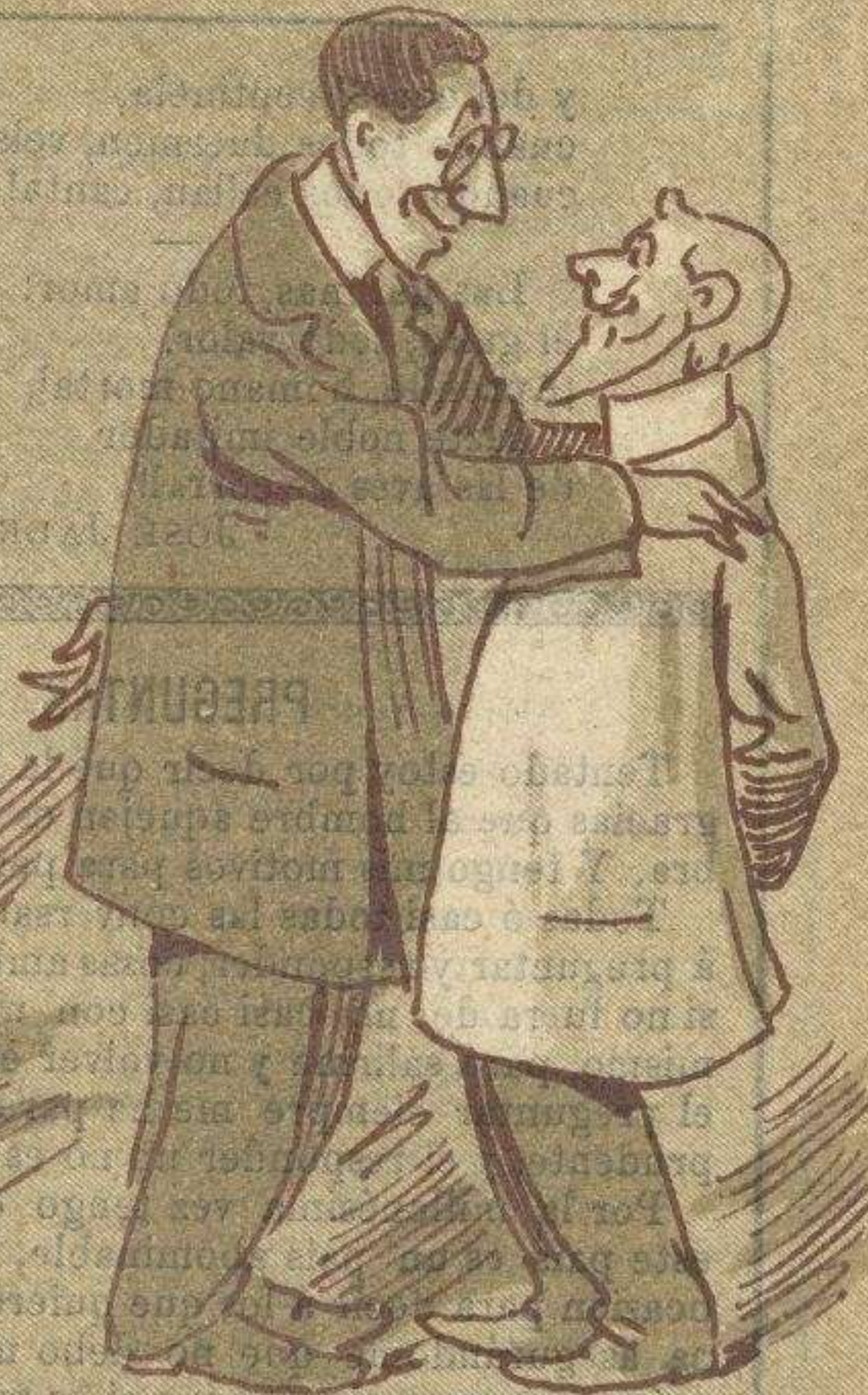
En el salón de conferencias.