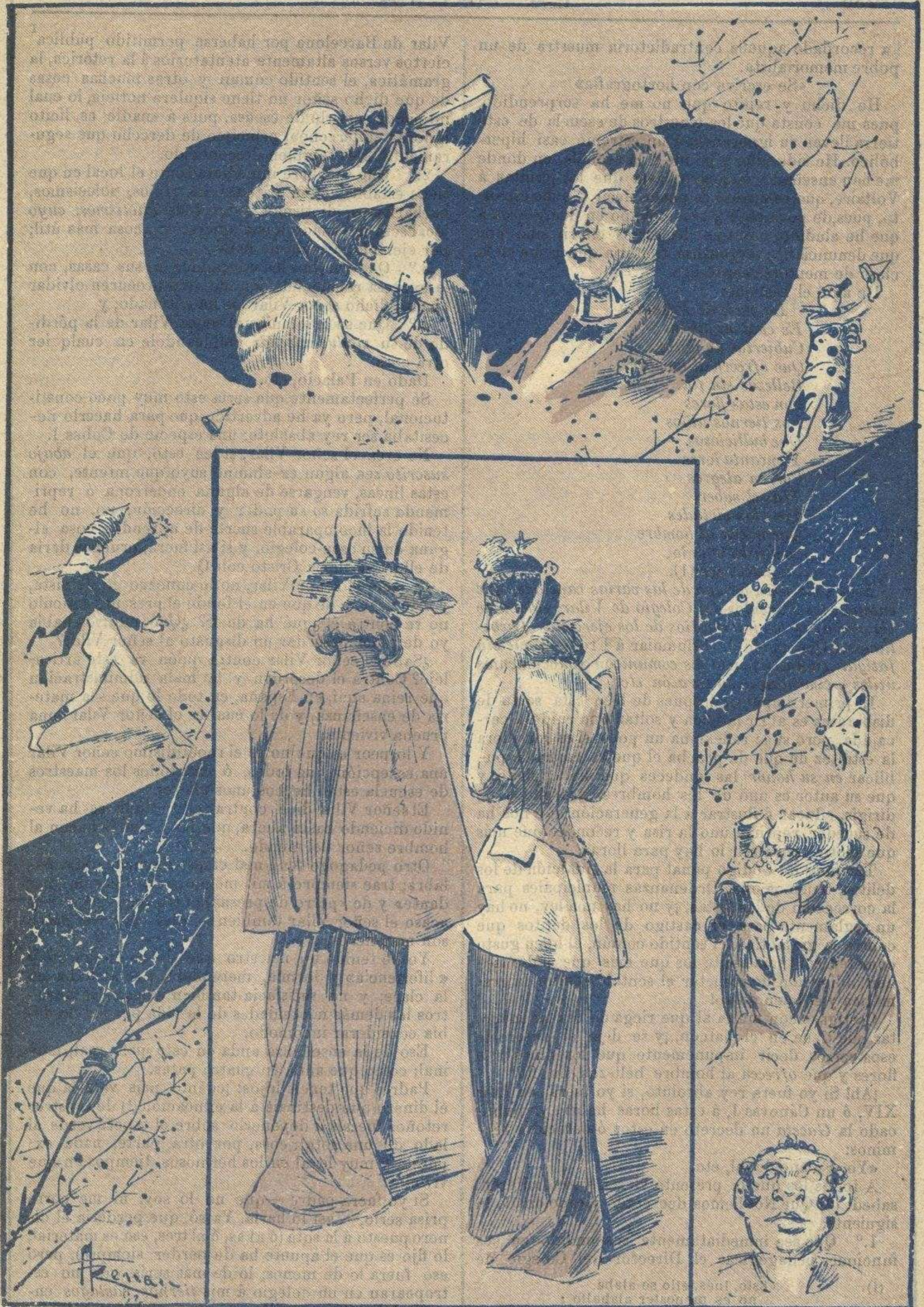
Enamorados, clowns, bichos, rumor de besos, caras felices... todo, todo indica que vamos á entrar en la época del calor.