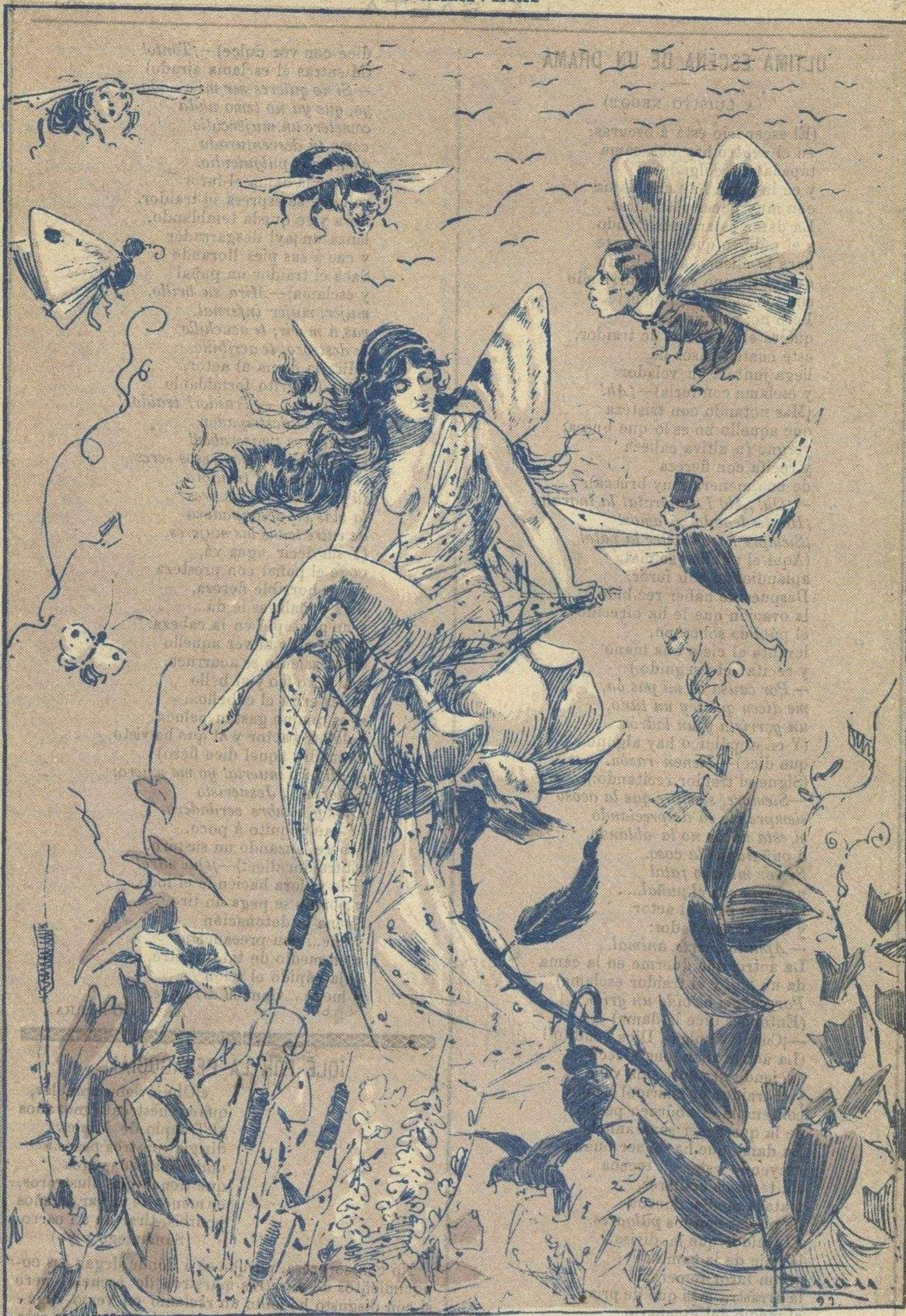
Nace brillante y bella del seno de una flor, pero se vé asediada de mucho moscardón.