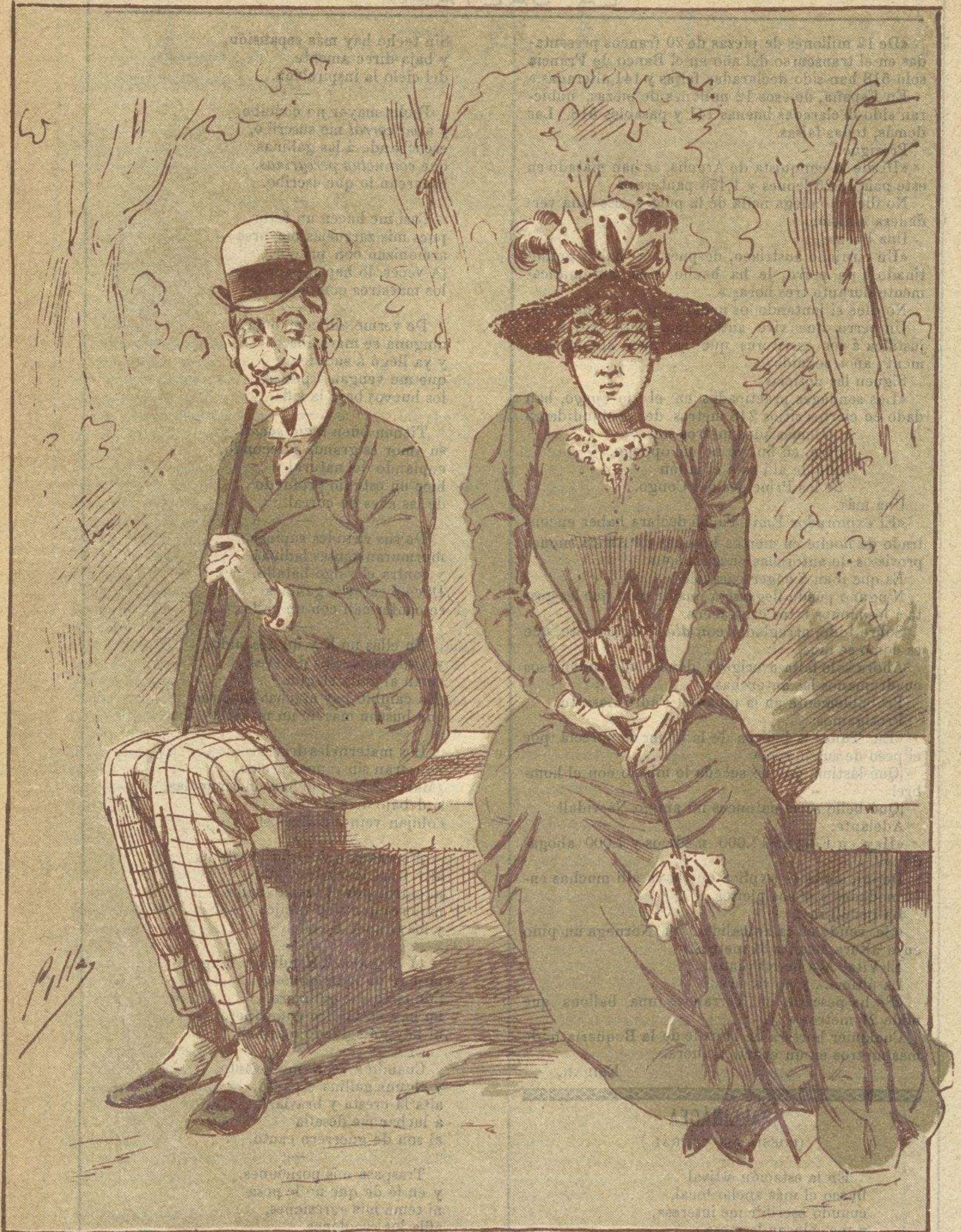
Cosas que empezais así con clima primaveral; cosas que empezais así, soleis acabar muy mal