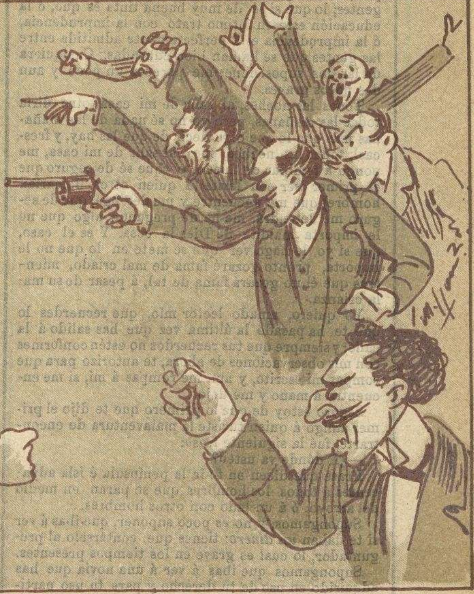
En el Congreso.