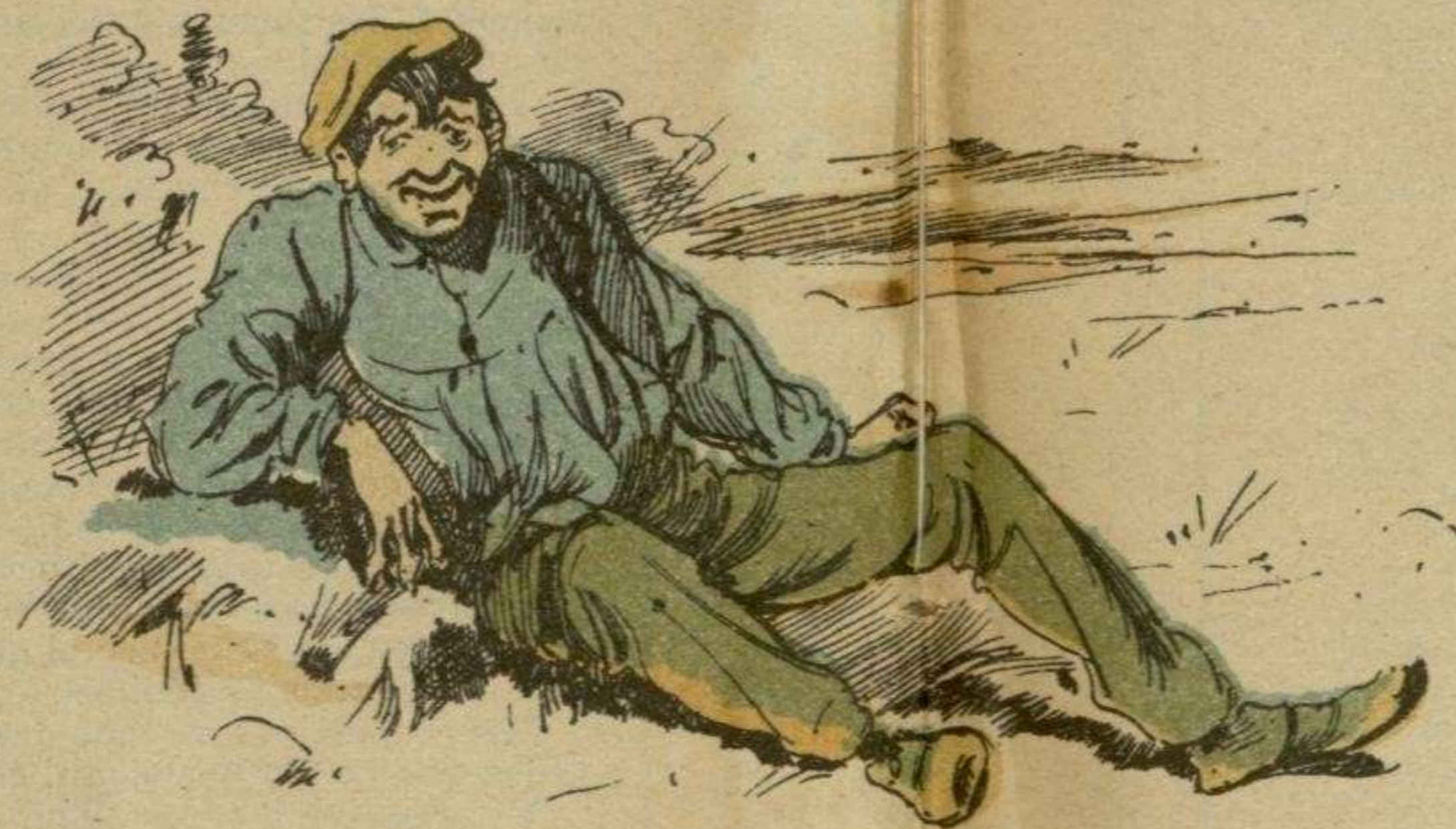
¡Cosa más extraña! ¡Acabo de cambiar la peseta y no tengo un cuarto en el bolsillo!