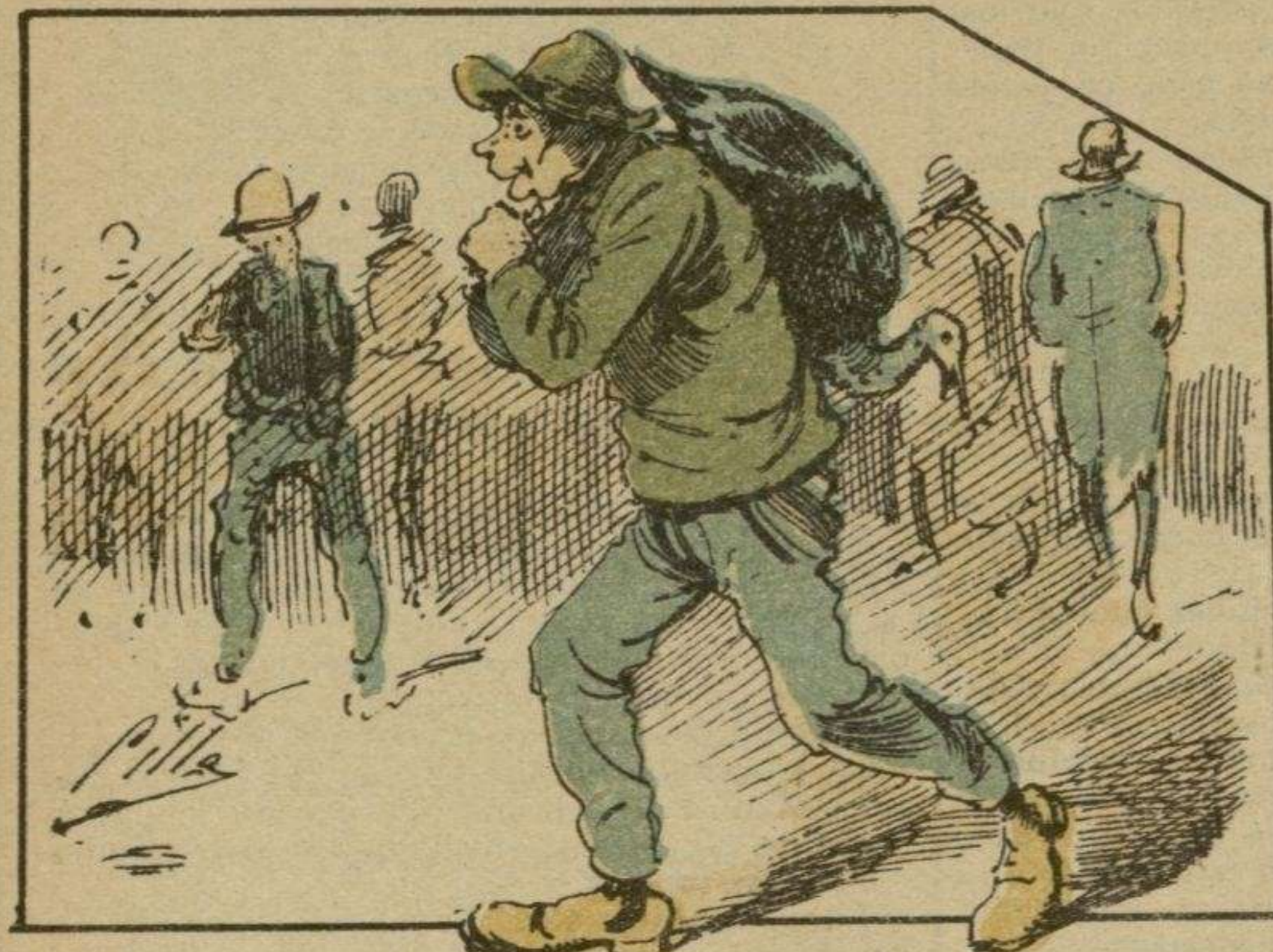
Este pavo era tuberculoso, pero con la linfa Koch se ha puesto muy bueno..... para la cazuela.