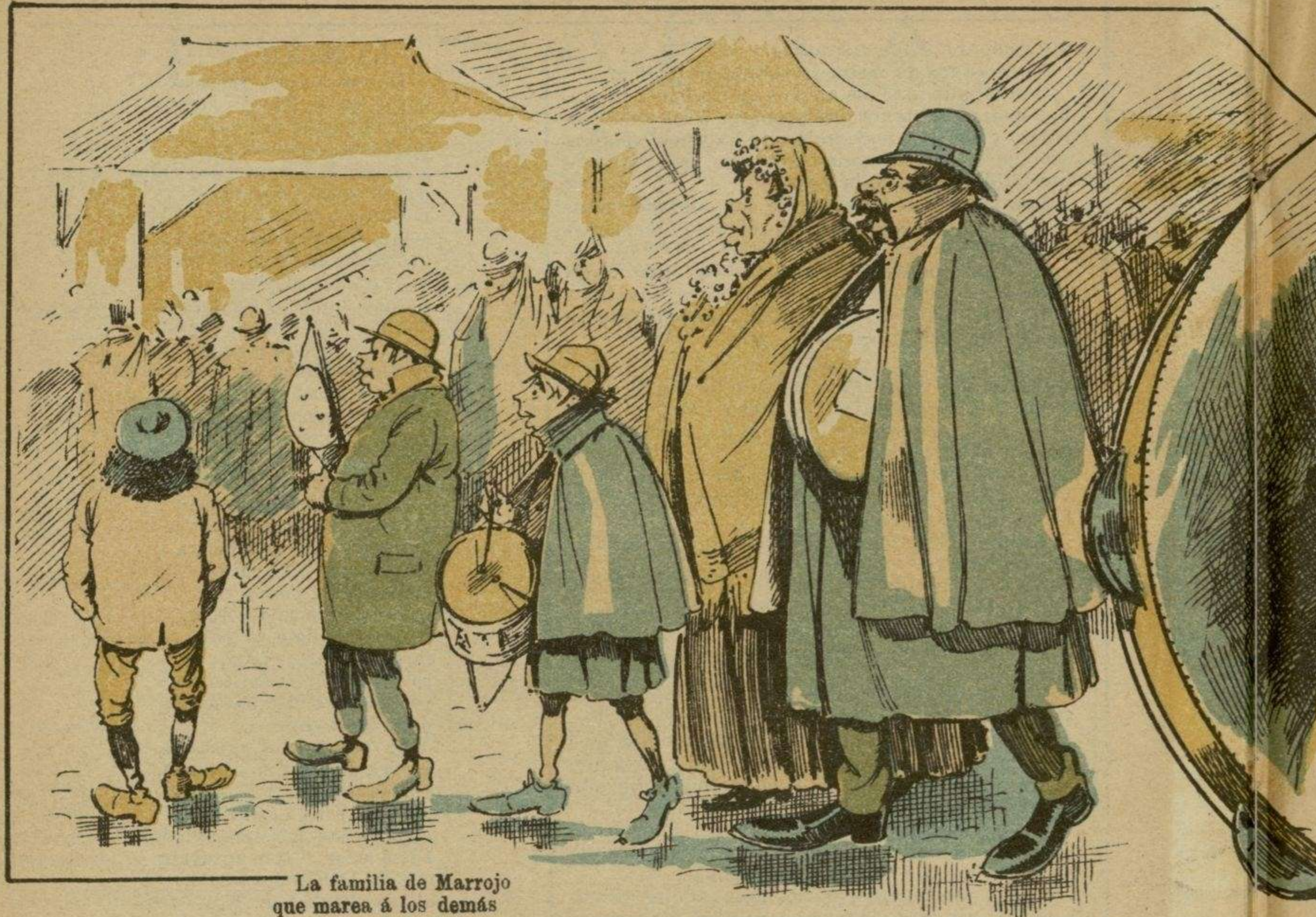
La familia de Marrojo que marea a los demás por arriba, por abajo, por delante y por detrás.