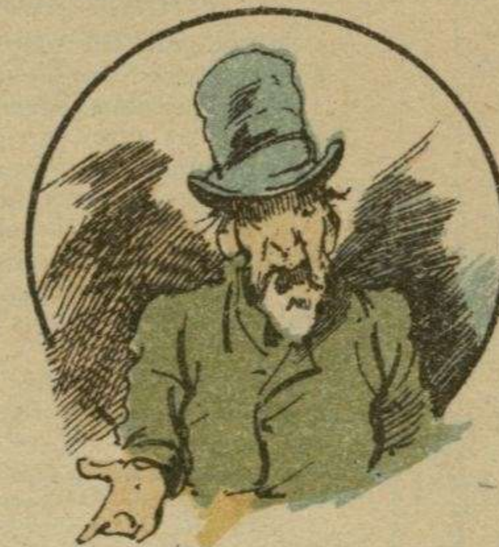
Apartaos de la alimentación y habeis cortado el cólico.