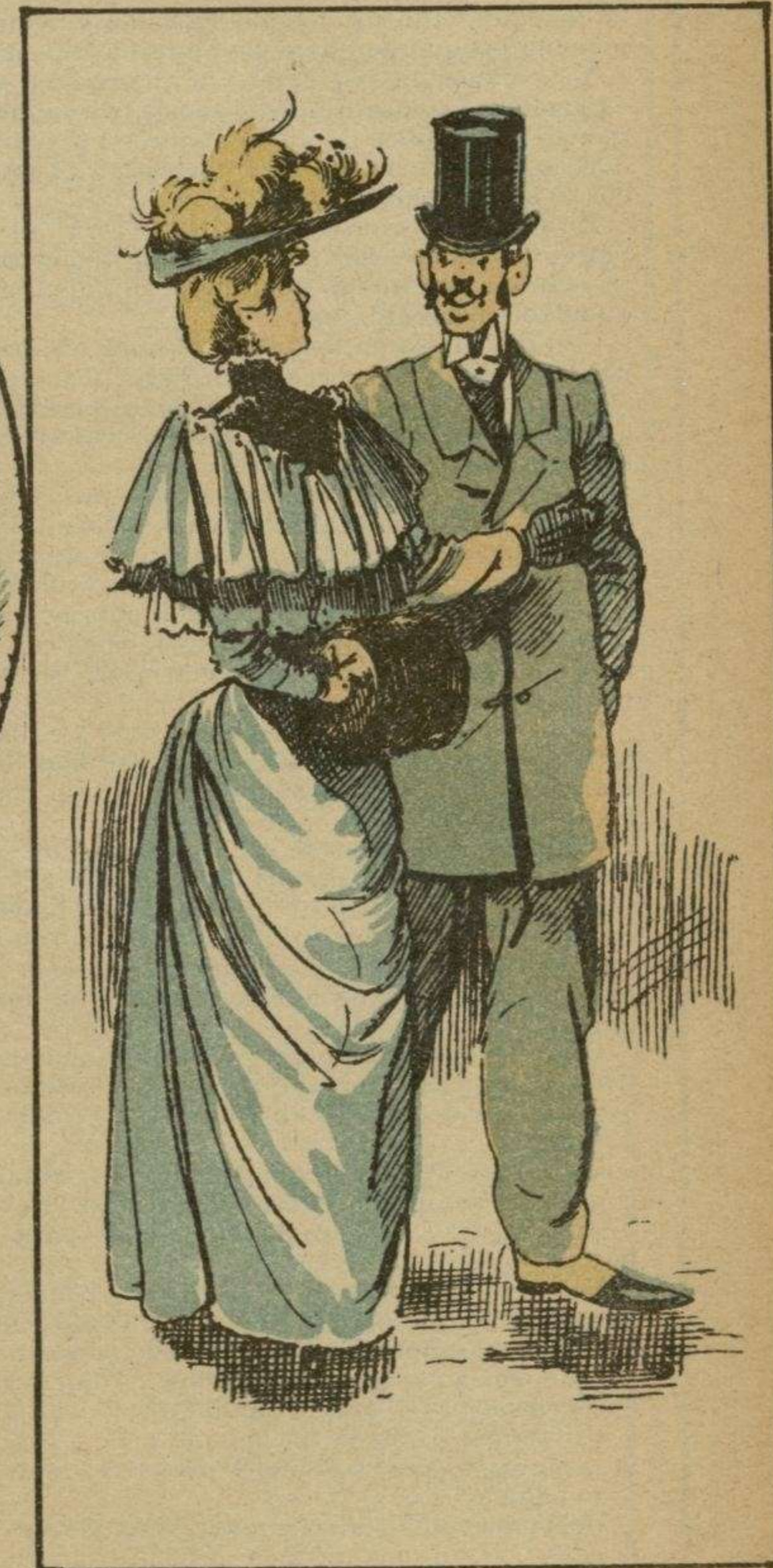
—¿Dónde vas, silfide? —¡La silfide será tu mamá, sietemesino!