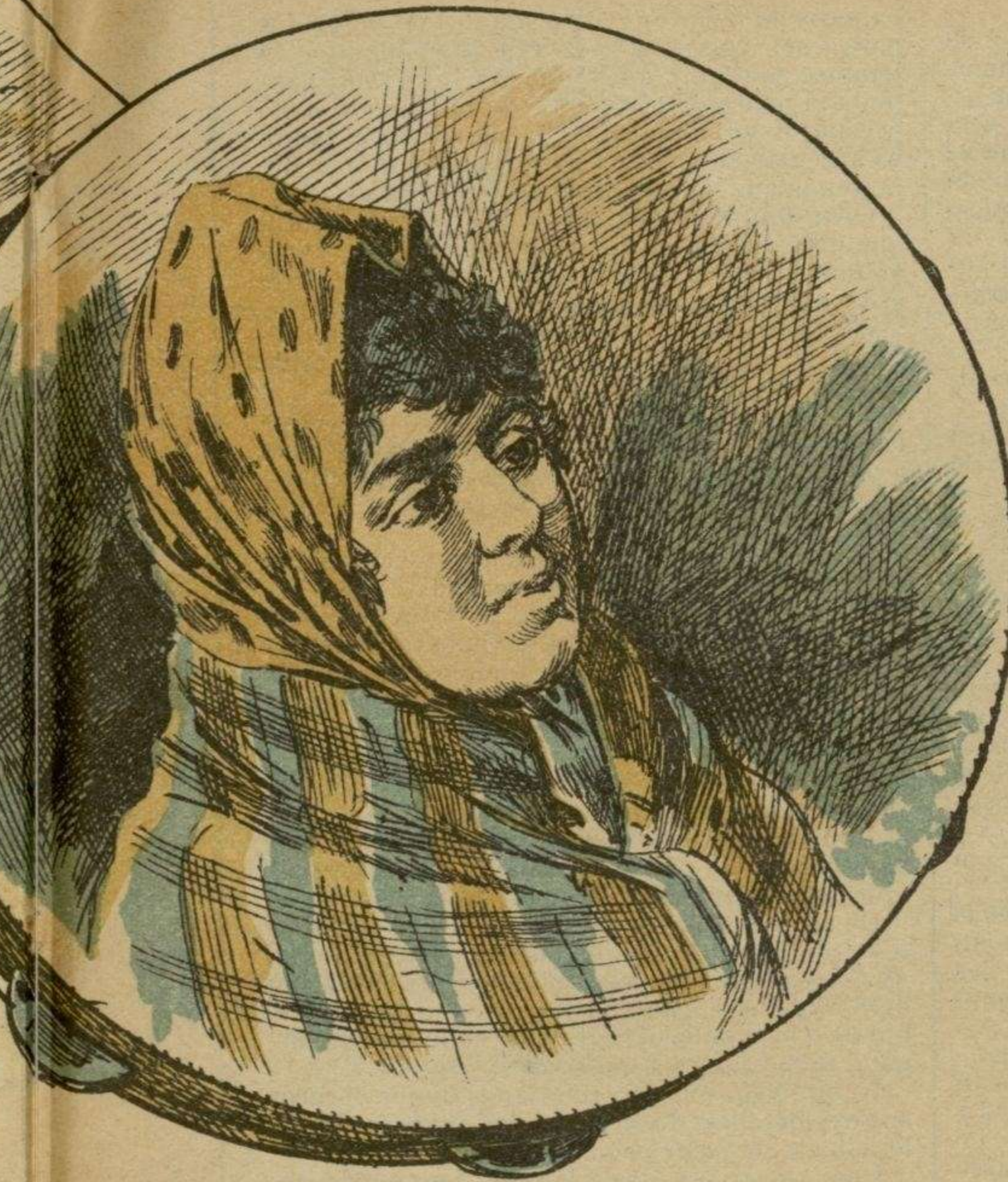
Una pandereta que ha sido muy tocada.