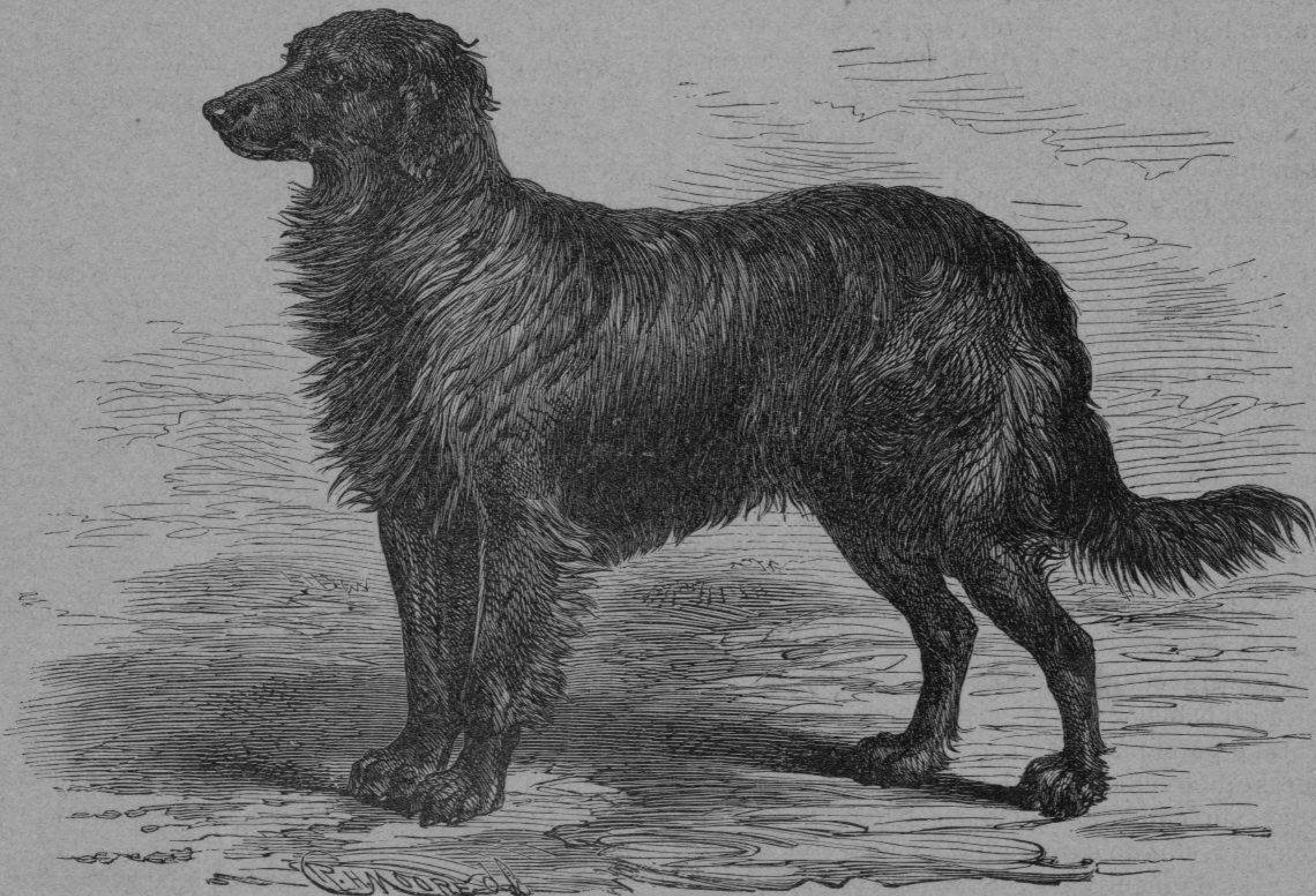
Perro de aguas, obtenido del cruzamiento del Terranova y el Grifón.

pertenecía; el ser nobilísimo en cuyo pecho no se anidaron jamás egoísmos ni miserias personales. Su bello ideal consistía en el desarrollo y engrandecimiento de la Veterinaria; y nosotros, que bajo su nombre nos desarrollamos, llenos de fe y entusiasmo mantenemos en firme la bandera que heredamos, tanto más, cuando para mayor