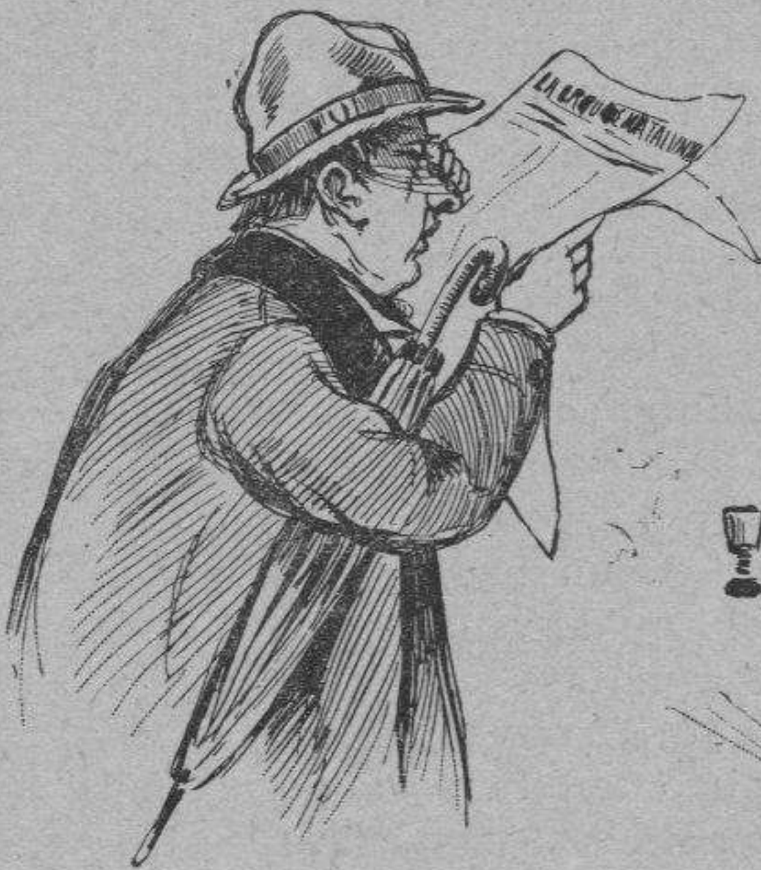
Un de tans