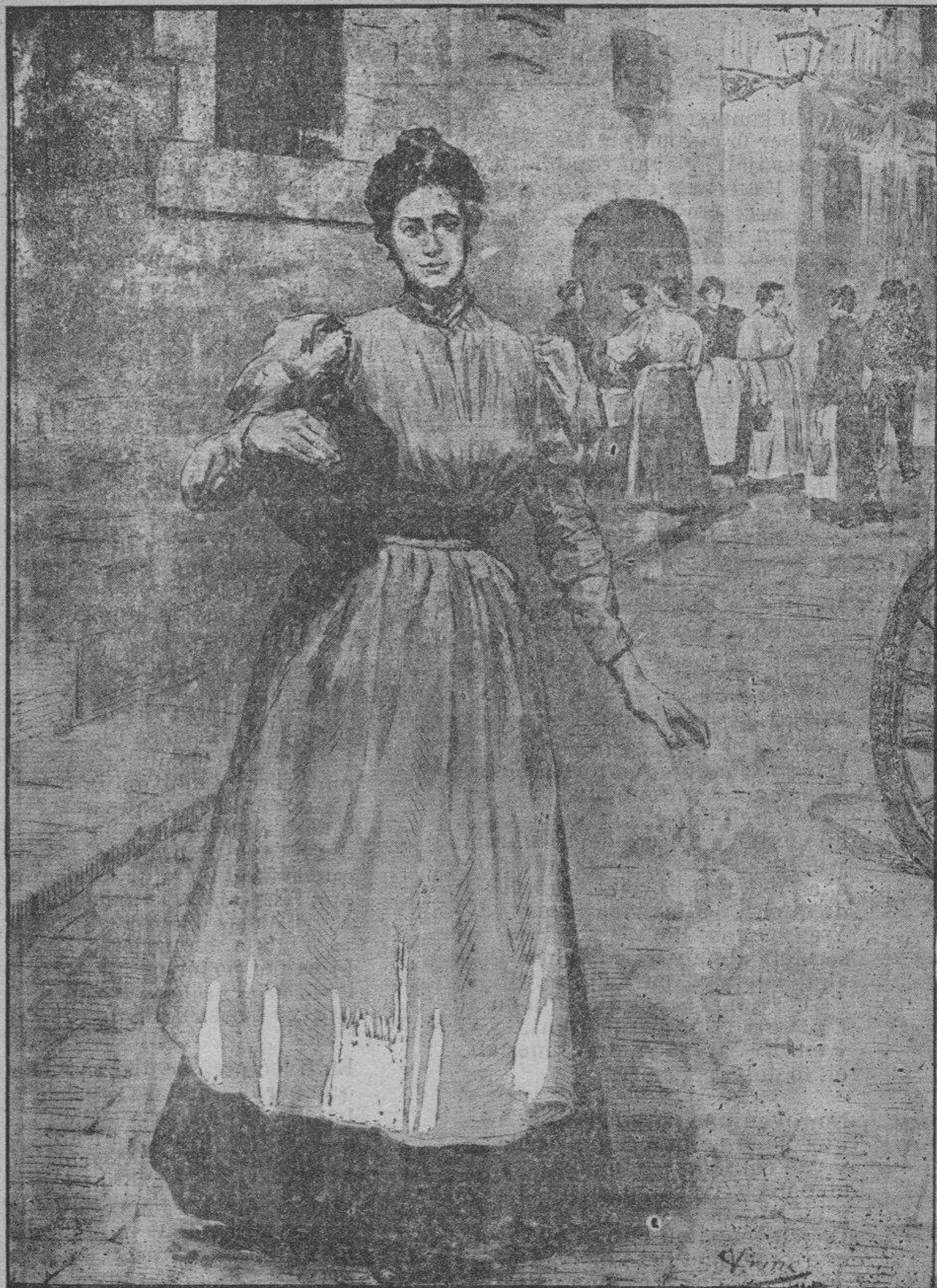
Tipos catalans, per V. Giné.