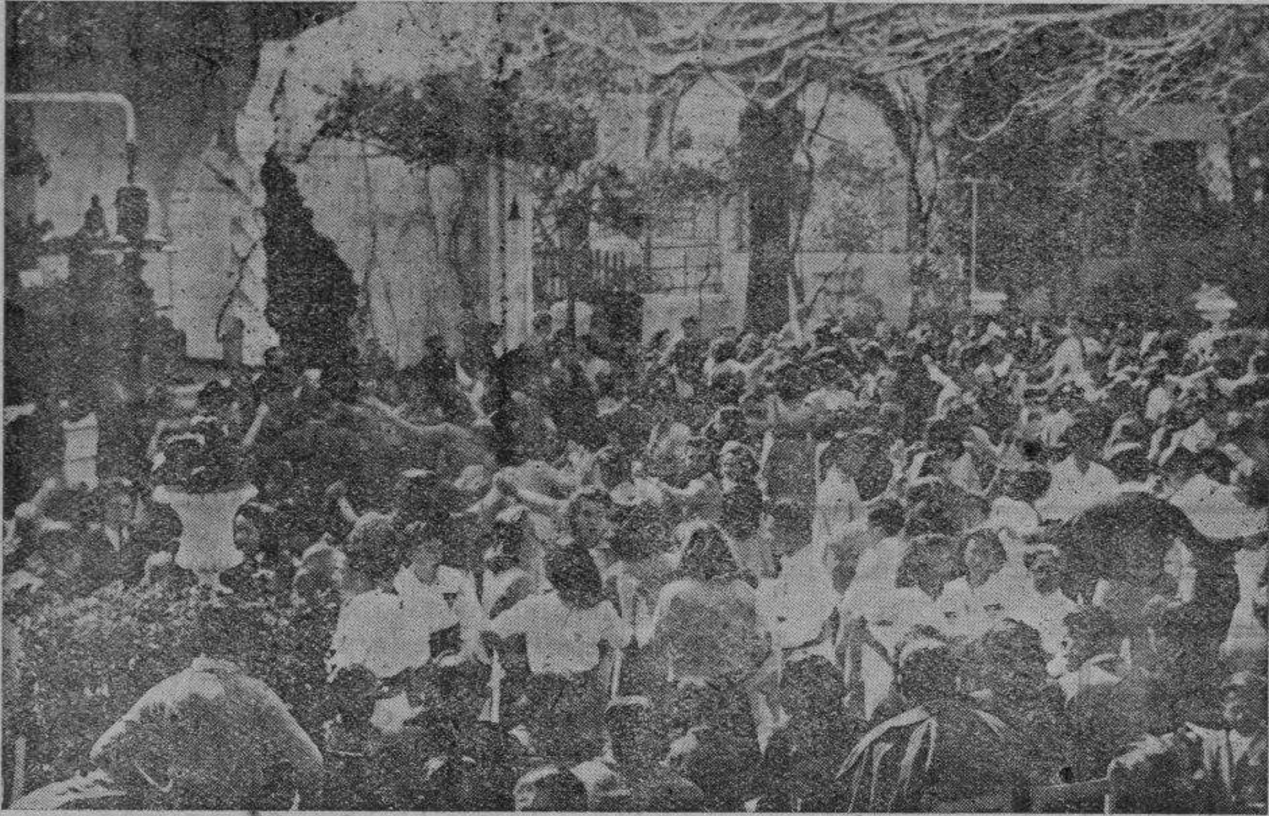
Un aspecto sardanístico en la pista de los jardines.