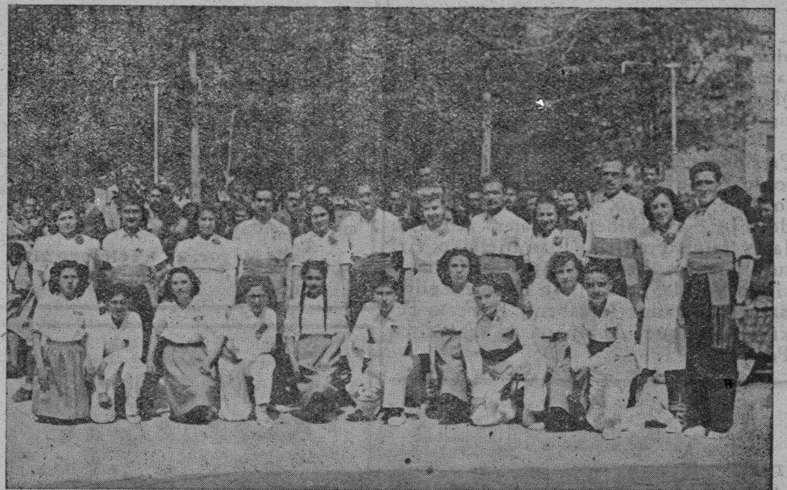
Los grupos Violetas del Bosc de Barcelona y Mar Blava de Sitges.

Ampliando la gacetilla que se publicó en el anterior número en estas columnas, nos cabe destacar el éxito con se vienen dando estas audiciones en El Retiro y organizadas por el Grupo Sardanista del mismo. Simpática fiesta, en la que hicieron su presentación la nueva anella sitgetana Mar blava , compuesta por jóvenes de 14 a 16 años, y que fué la admiración de los espectadores en su brillante primera actuación.