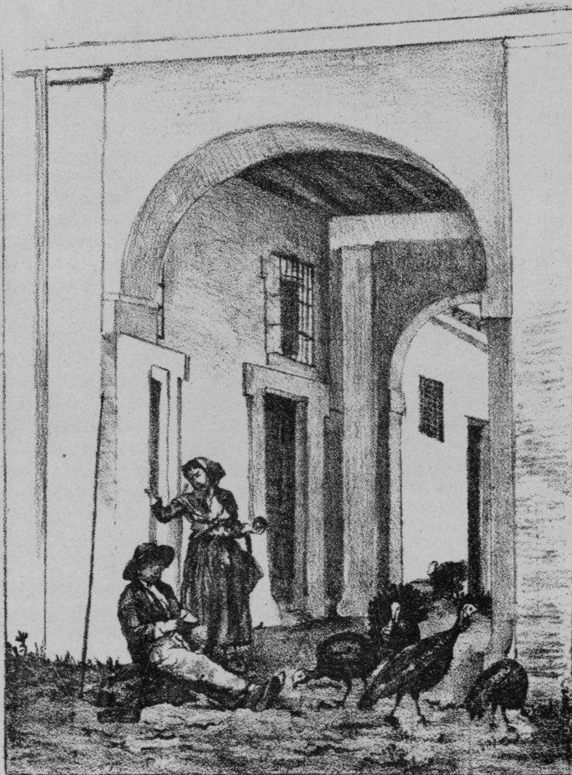
«LAS VÍCTIMAS DE NAVIDAD.» Cuadro de D. José de la Vega.—(Dibujo de D. Baldomero Tovar.)

Al año siguiente, por Real cédula fecha en la ciudad de Toro á 23 de Febrero de 1505, se concedió á Colón licencia para ca-