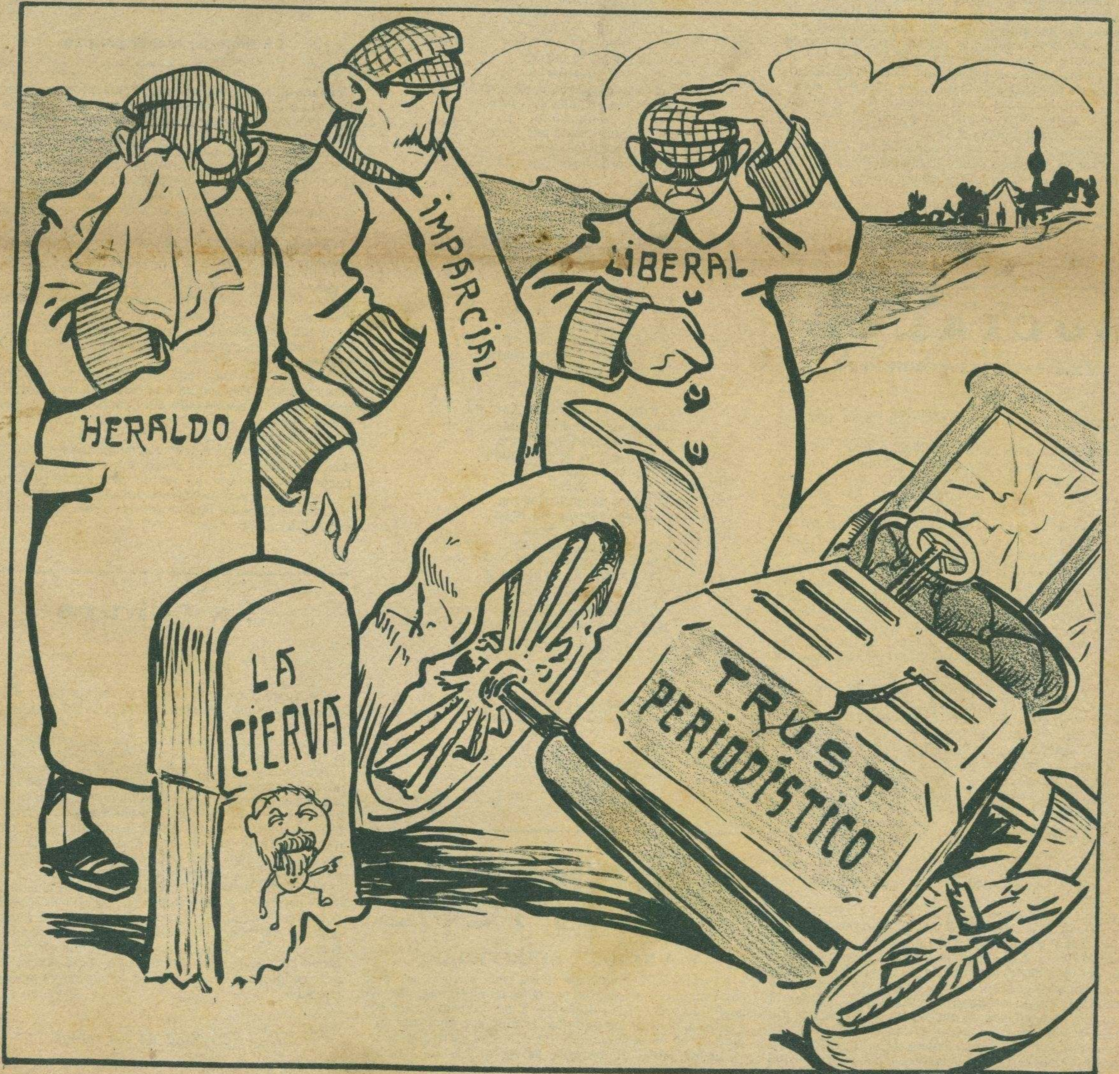
¡No es mal «topazo» el que ha dado el «trust»!