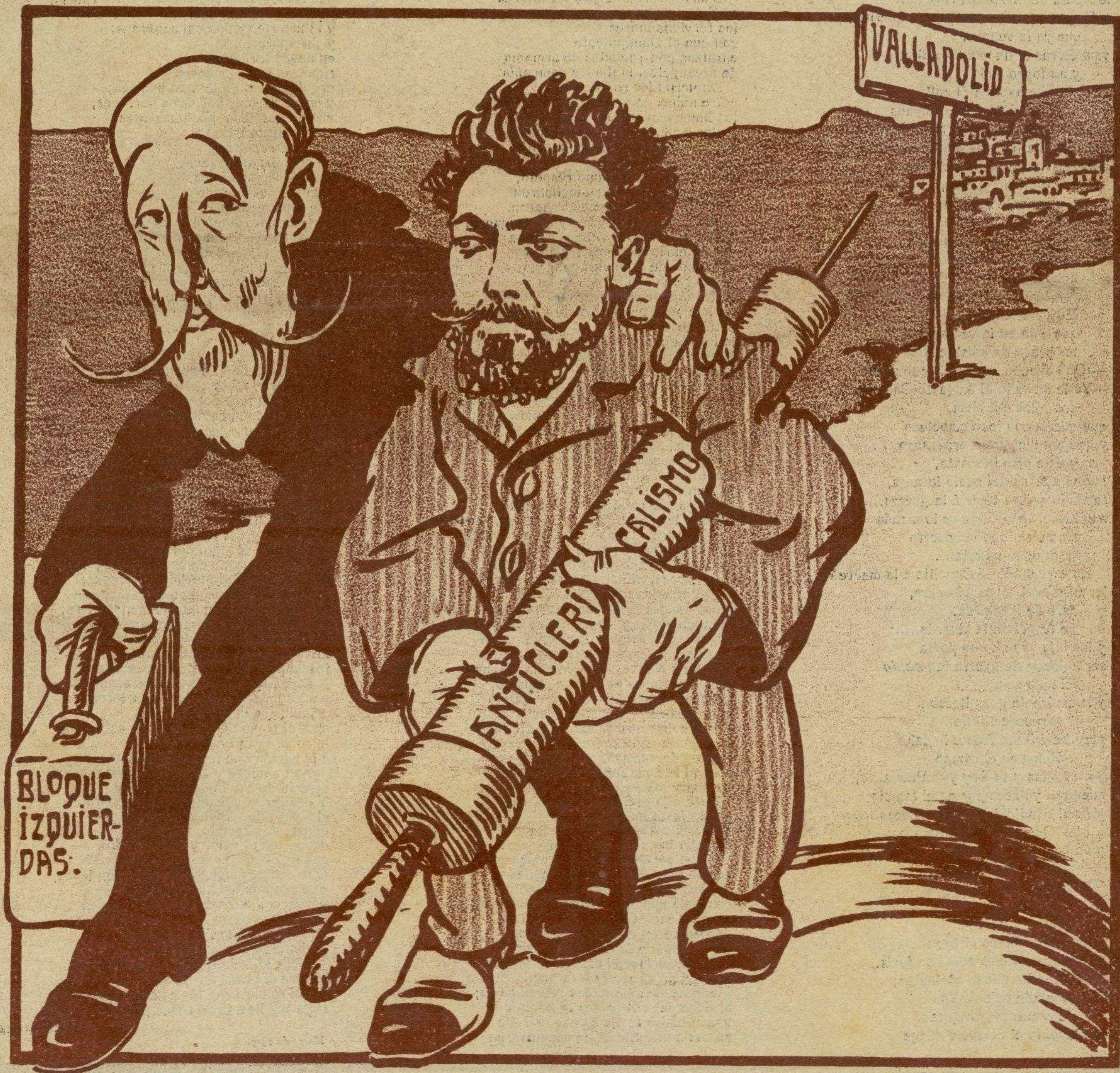
—Qué te parece, Santiaguillo: ¿salvaremos al bloque? —Con los jeringazos de anticlericalismo que le disteis, quedó bastante apañado.