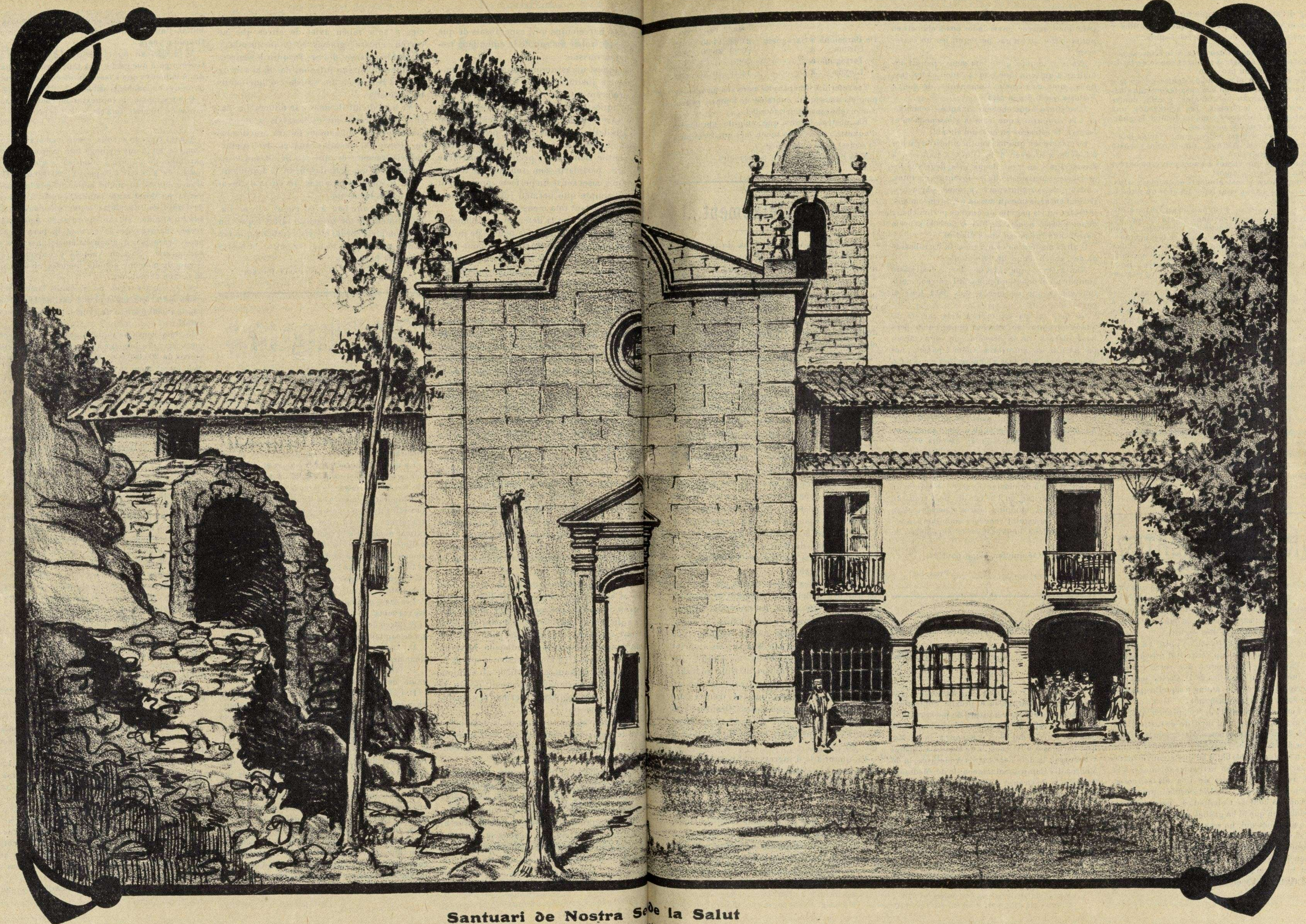
Santuari de Nostra Se de la Salut iesa, habitació del capellà y alberch públich