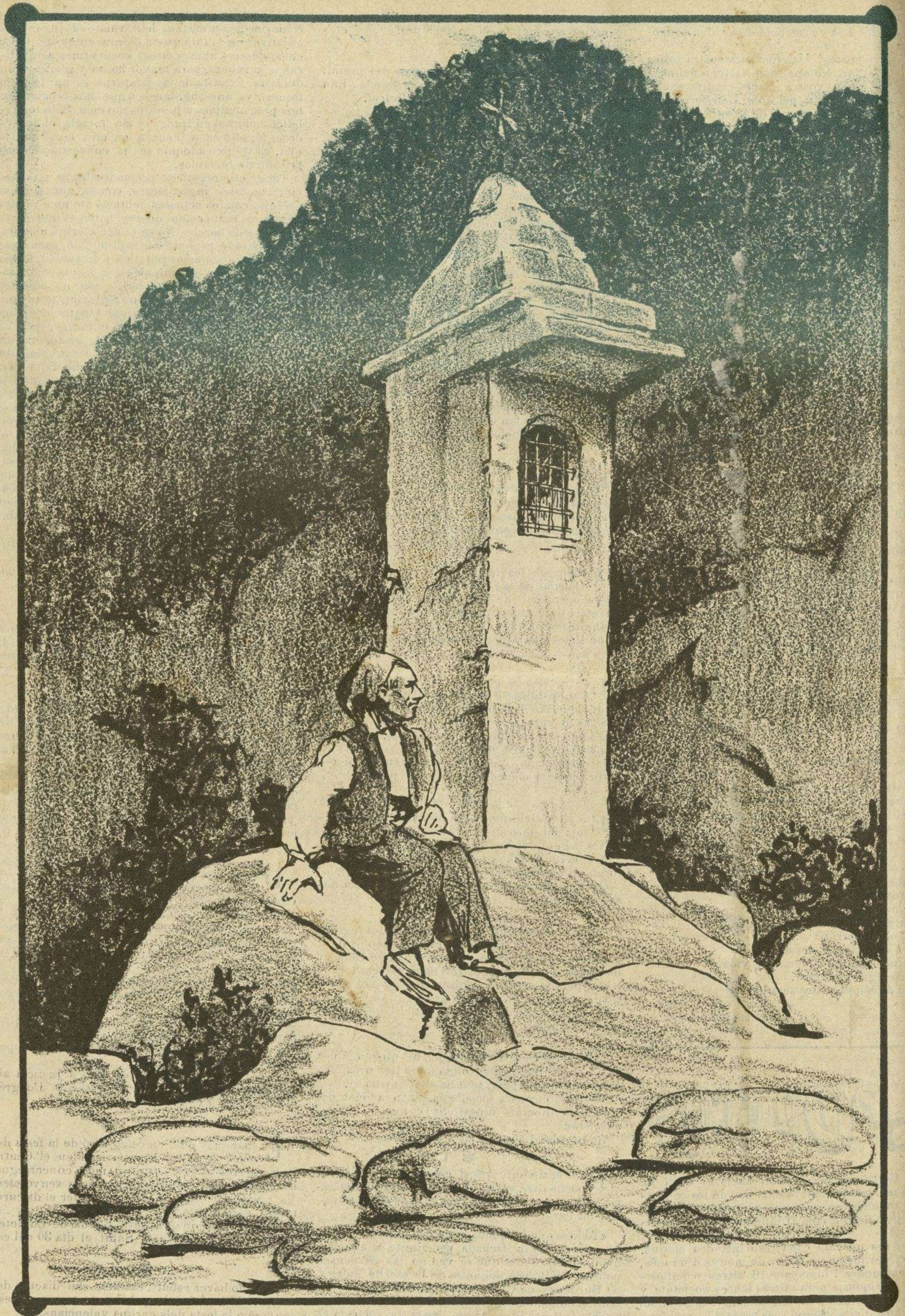
CAMÍ DE BELLMUNT - EL PADRONET