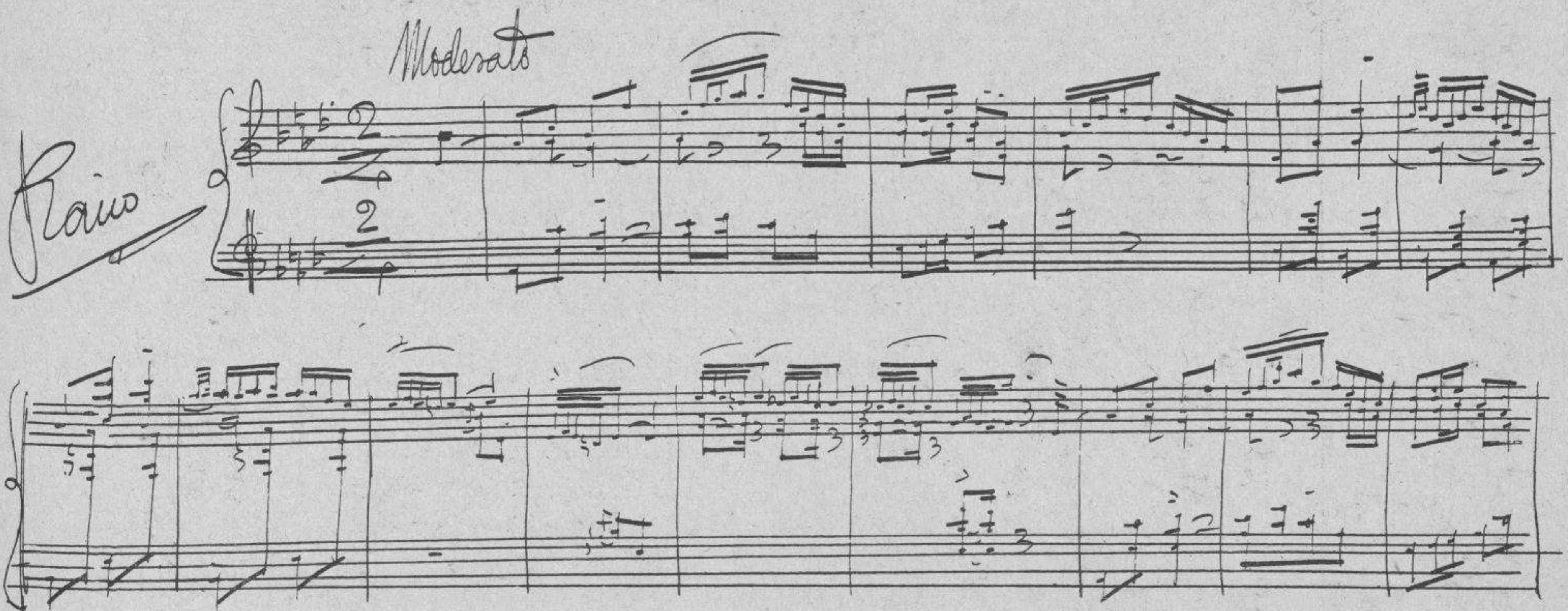
VERSALLESICAS. Fragmento autógrafo del maestro Pablo Luna