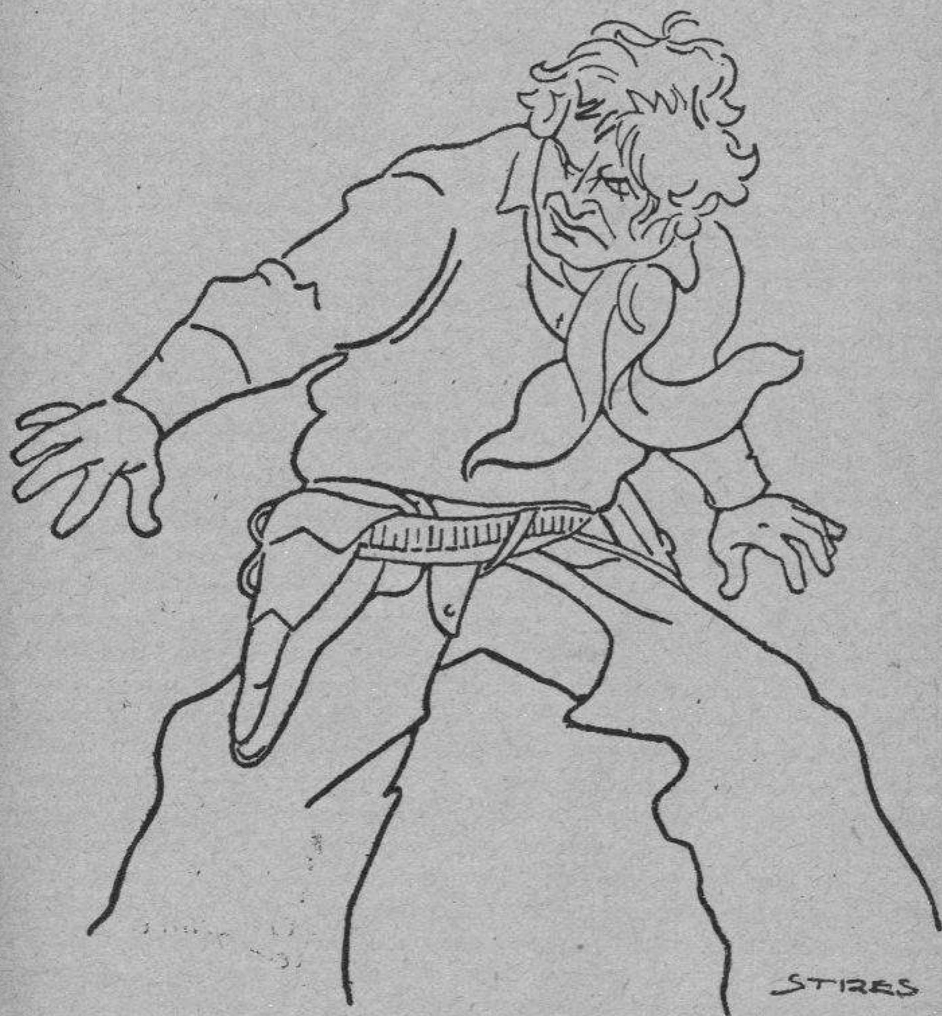
William Farnum, en una de sus creaciones