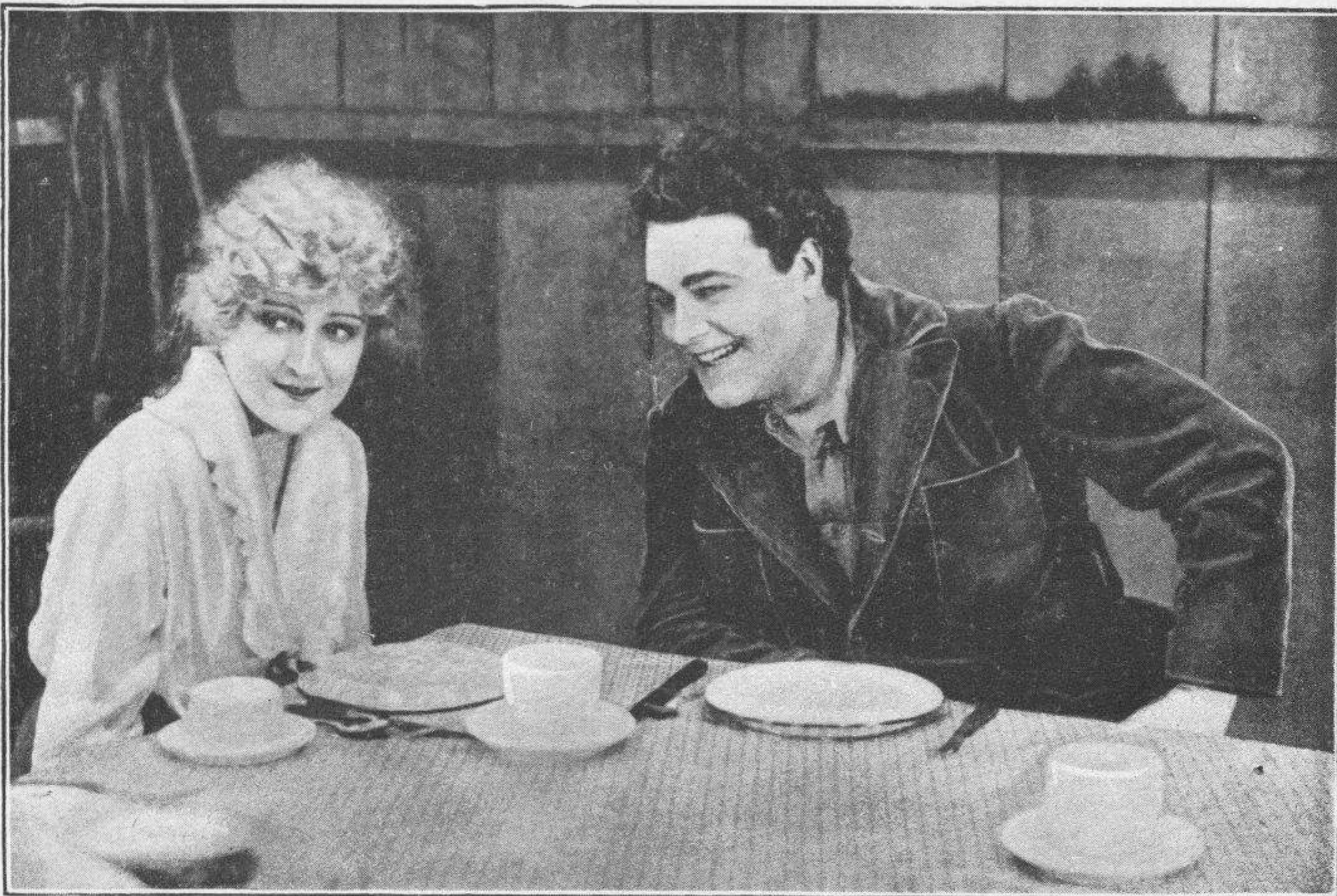
WILLIAM FARNUM en «La verdadera nobleza»