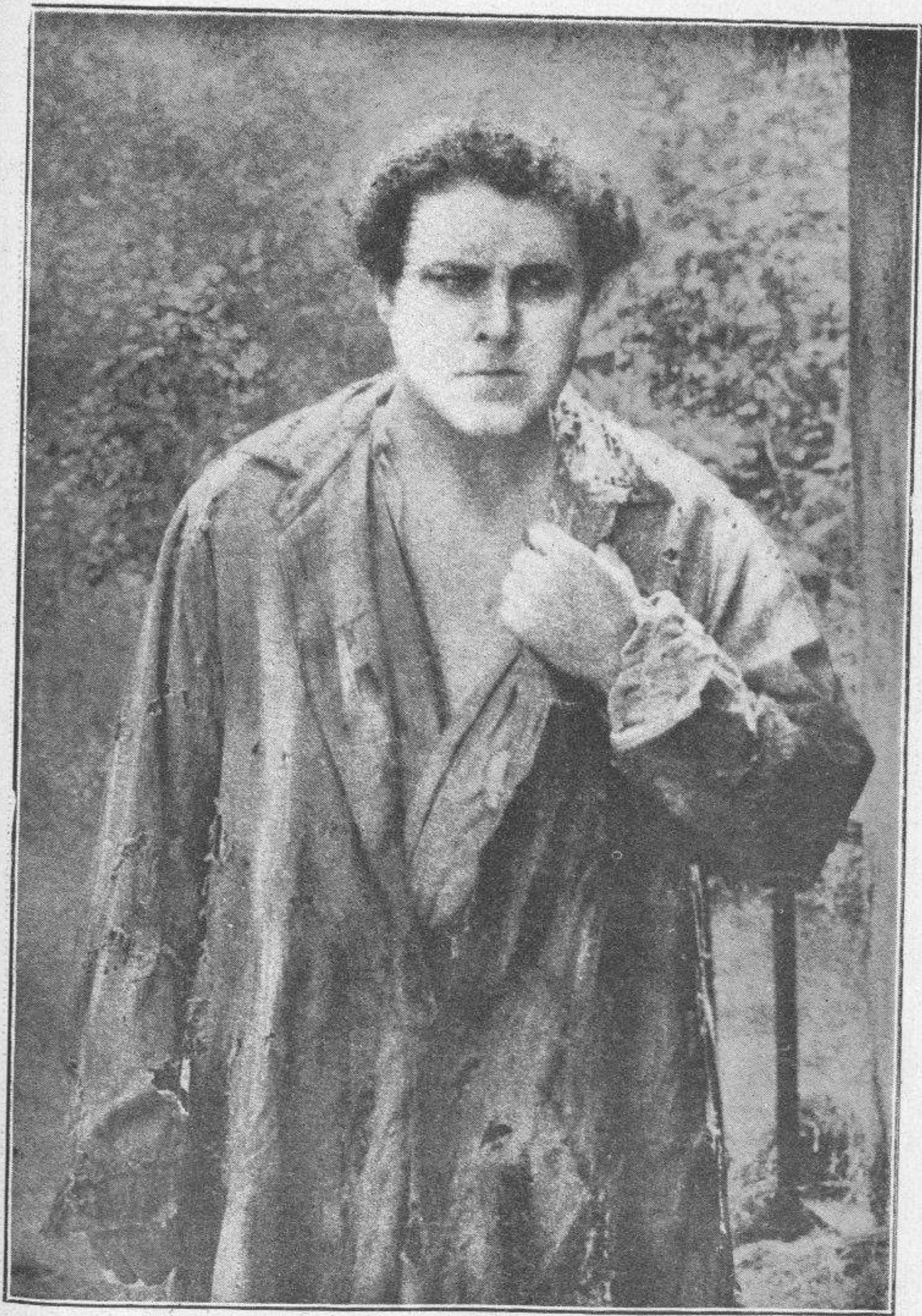
WILLIAM FARNUM en « Los Miserables »