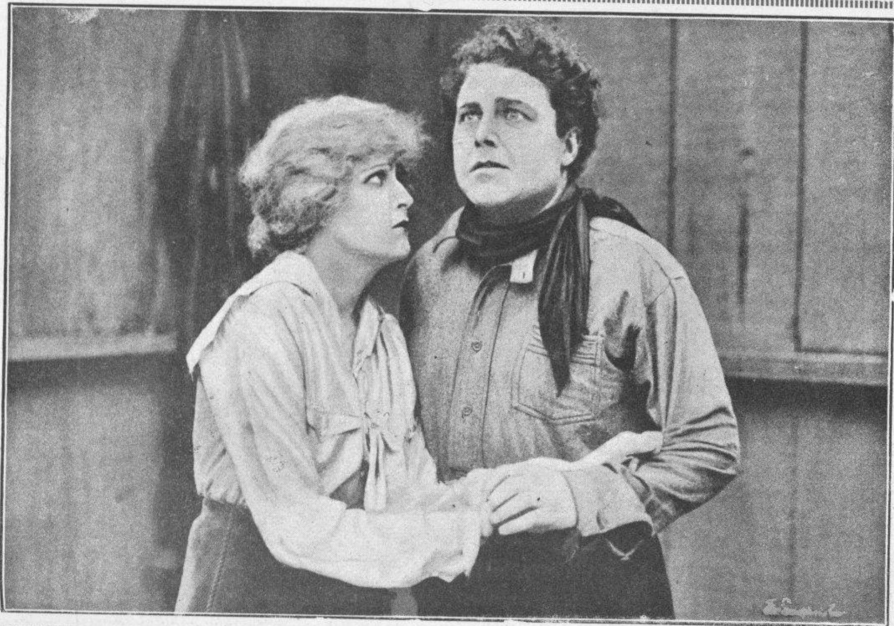
WILLIAM FARNUM en «La verdadera nobleza»