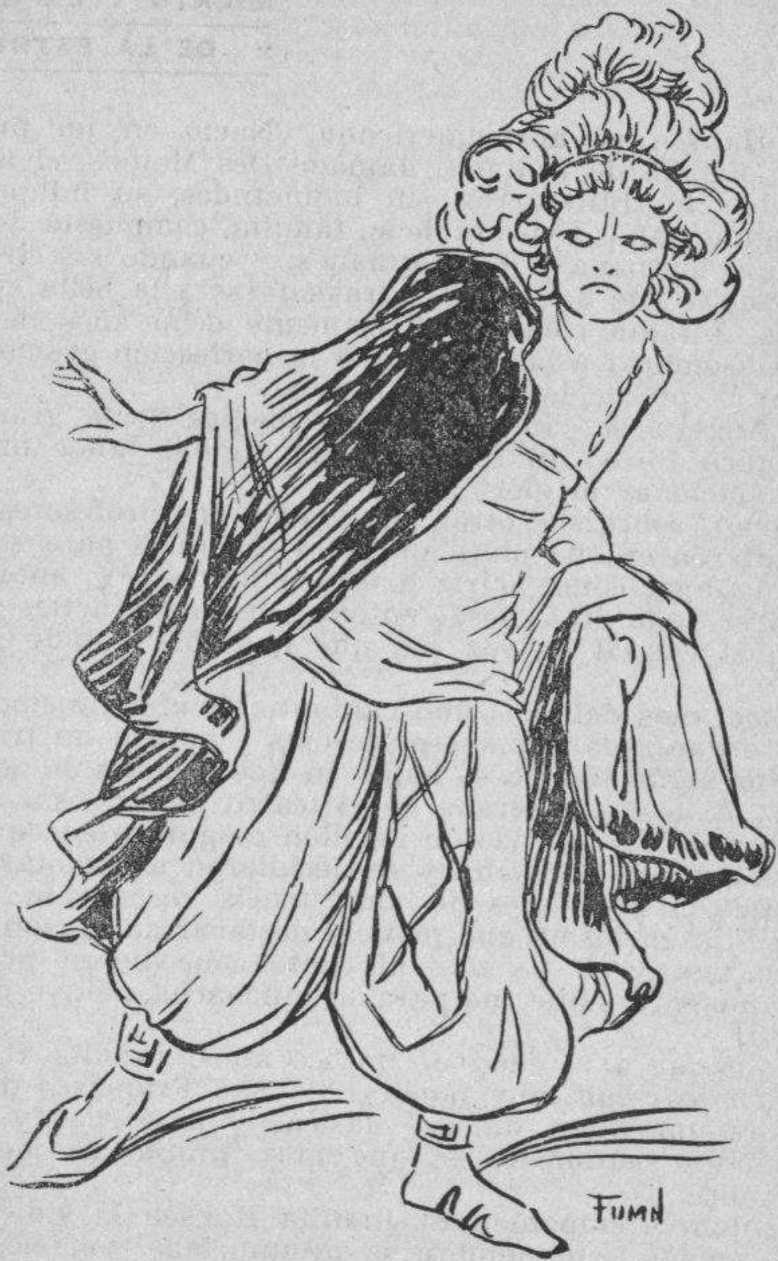
Juanita Hansen en La ciudad perdida