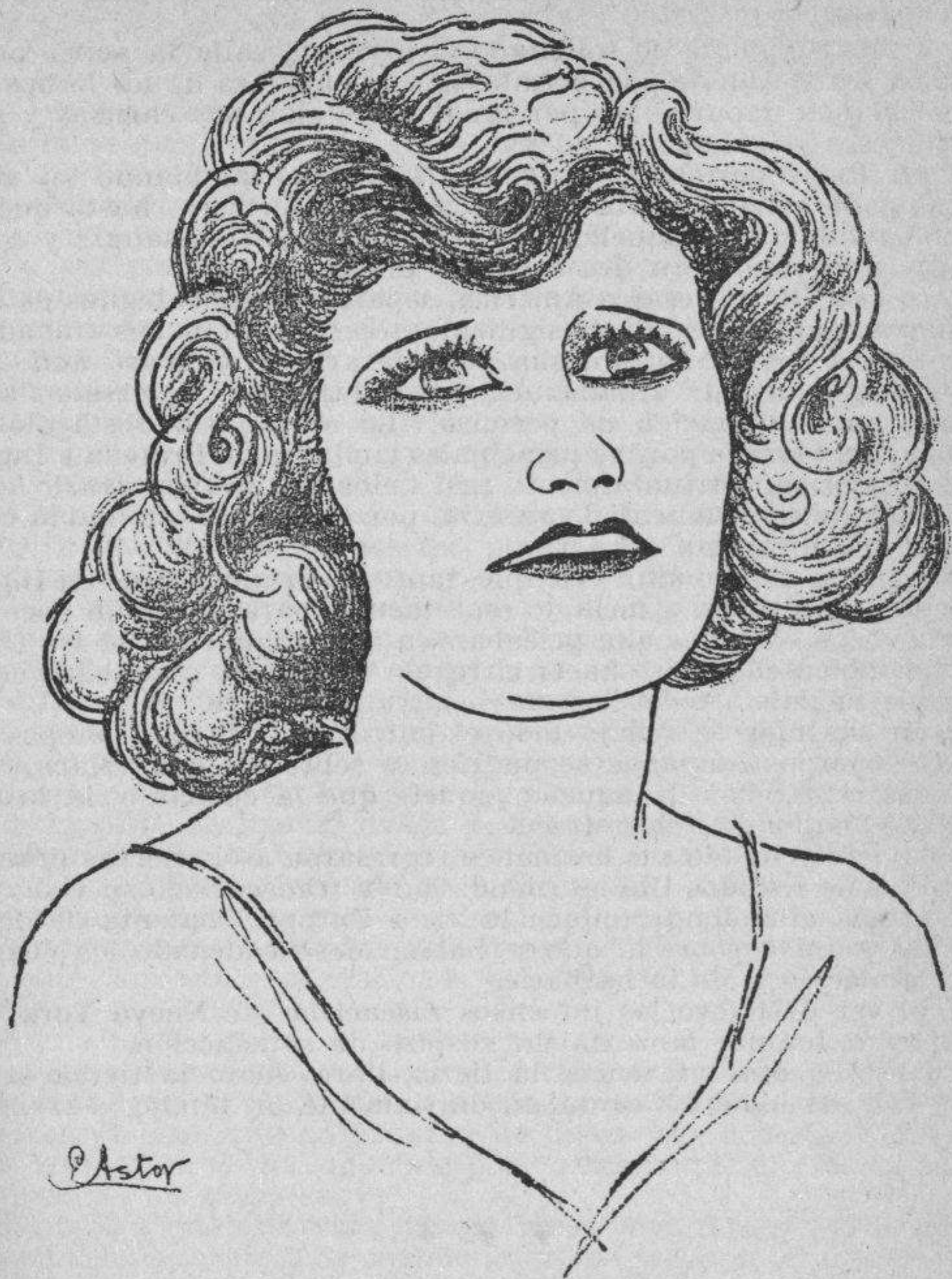
Retrato de Juanita Hansen