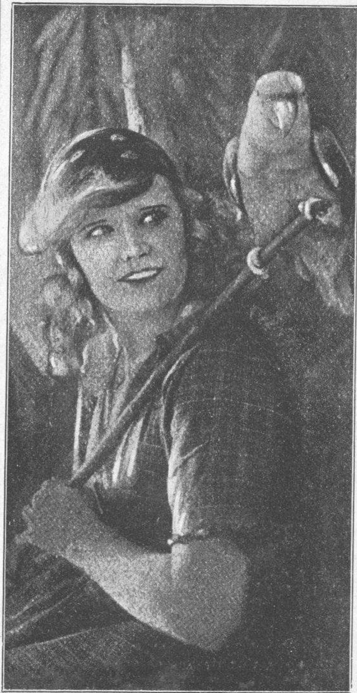
JUANITA HANSEN en «Flor de Mar»