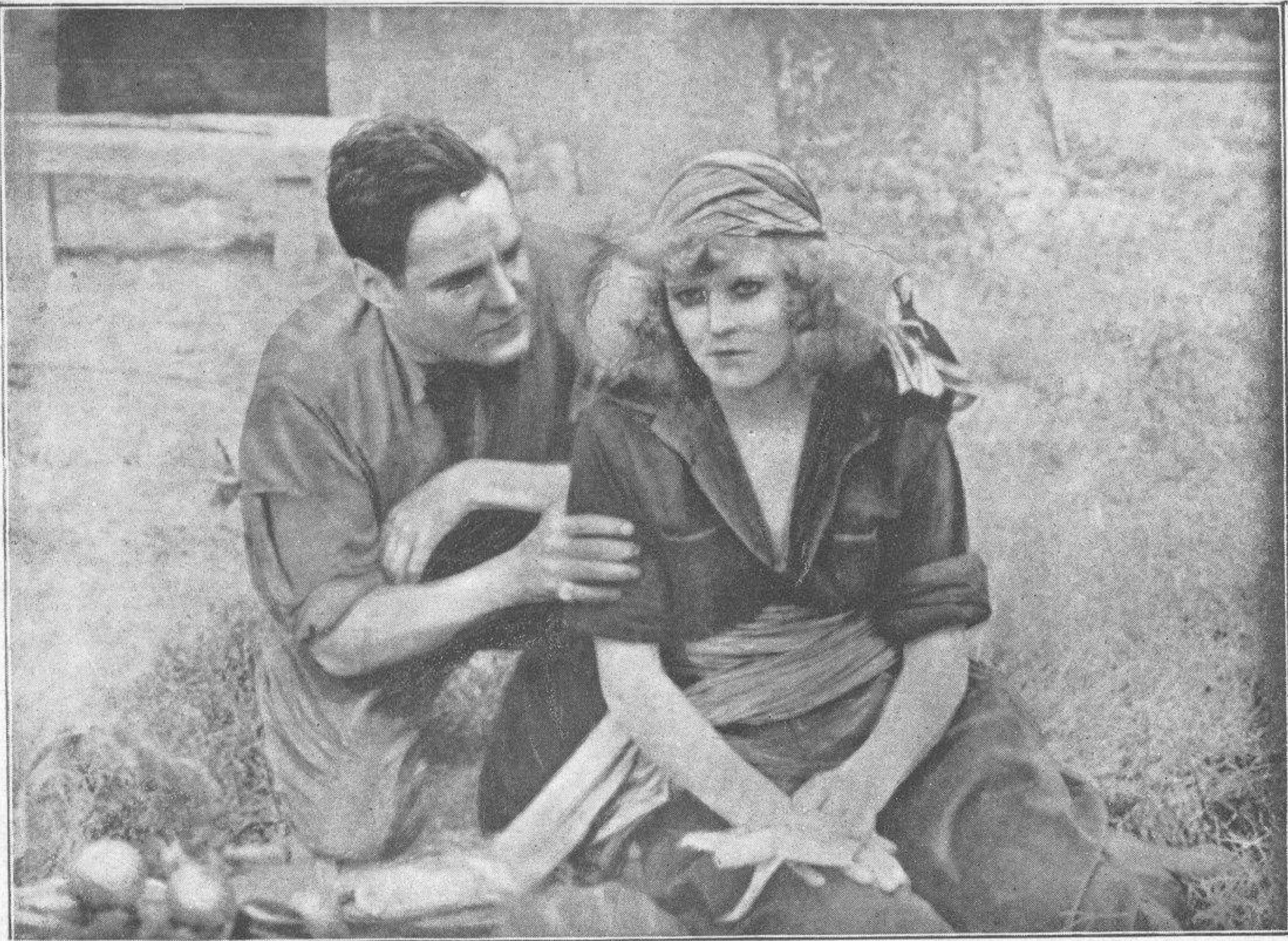
JUANITA HANSEN en «Minerva, o la ciudad perdida»