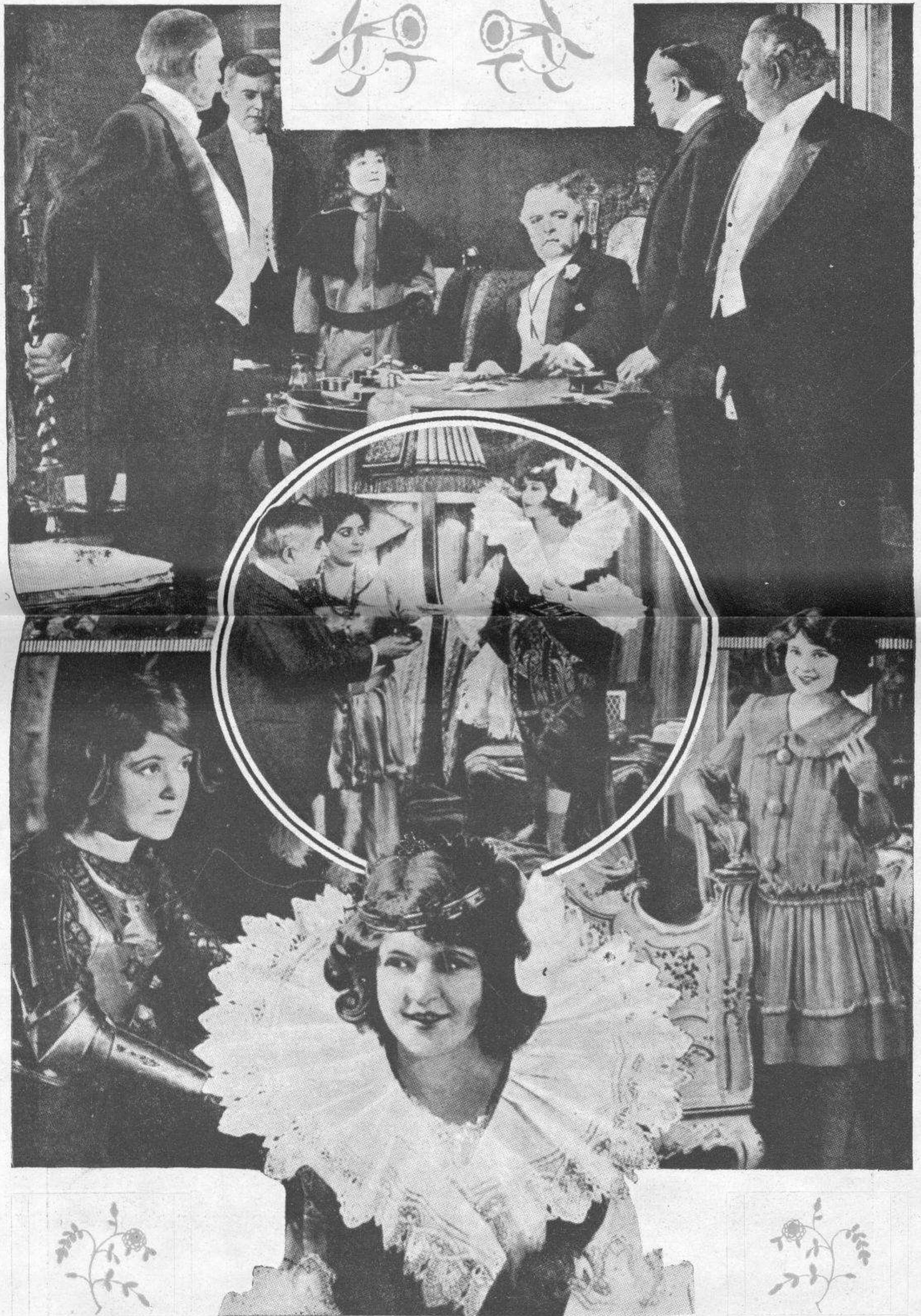
En «La hija del jugador»