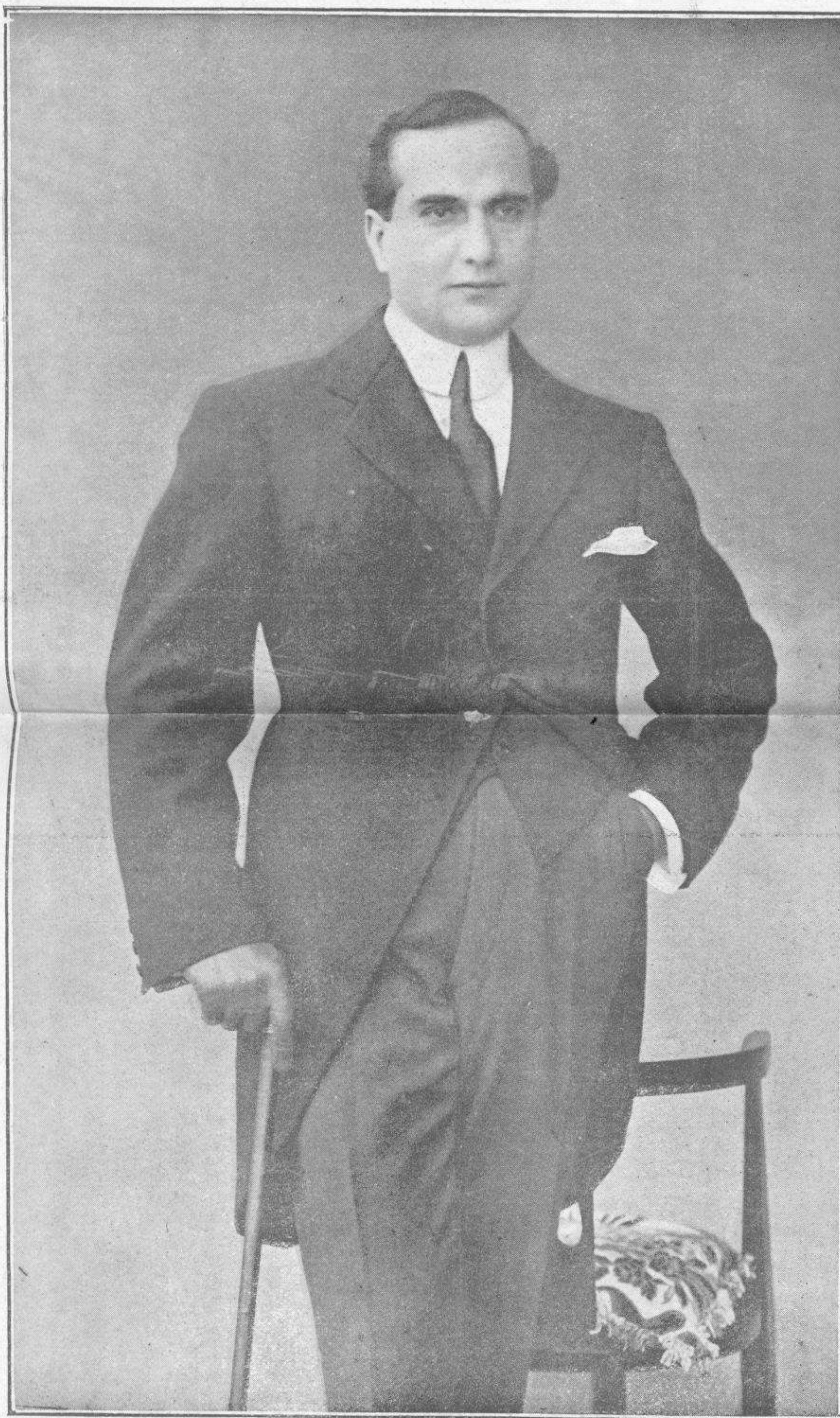
Retrato de GUSTAVO SERENA