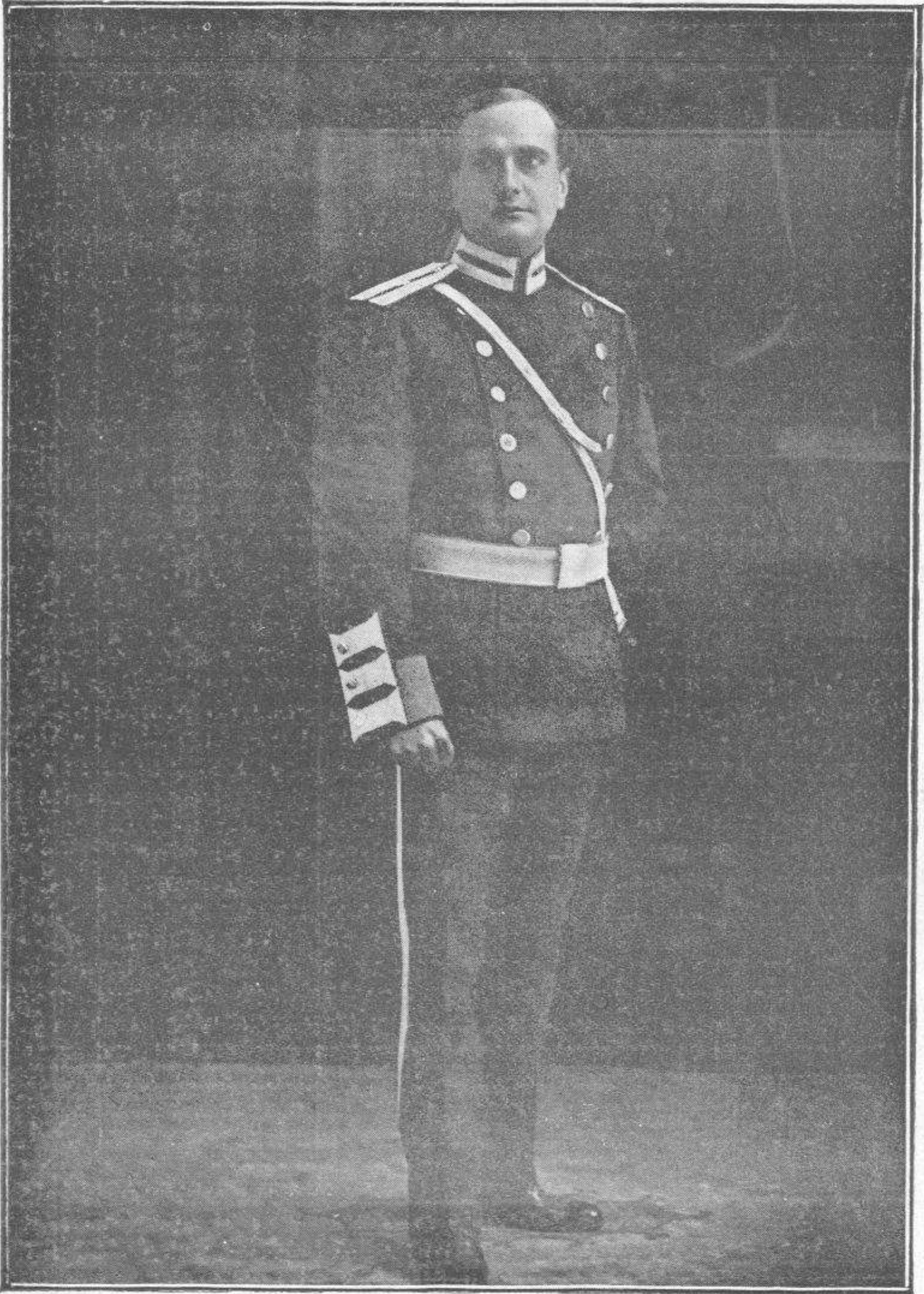
GUSTAVO SERENA en «Fedora»