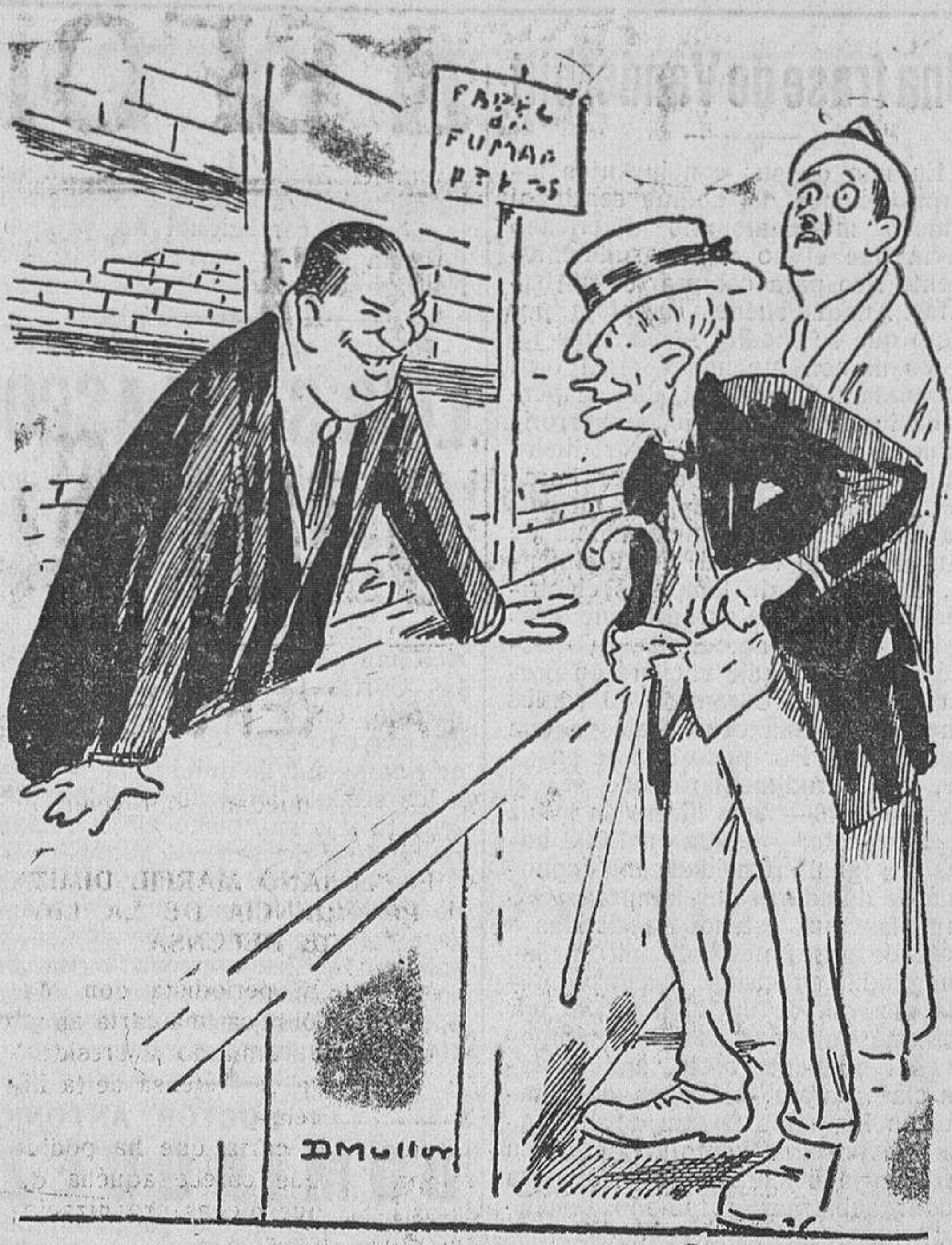
—Nada; para diez céntimos no va usted a cambiar. —¿Y si me muero esta noche? —Poco se pierde.