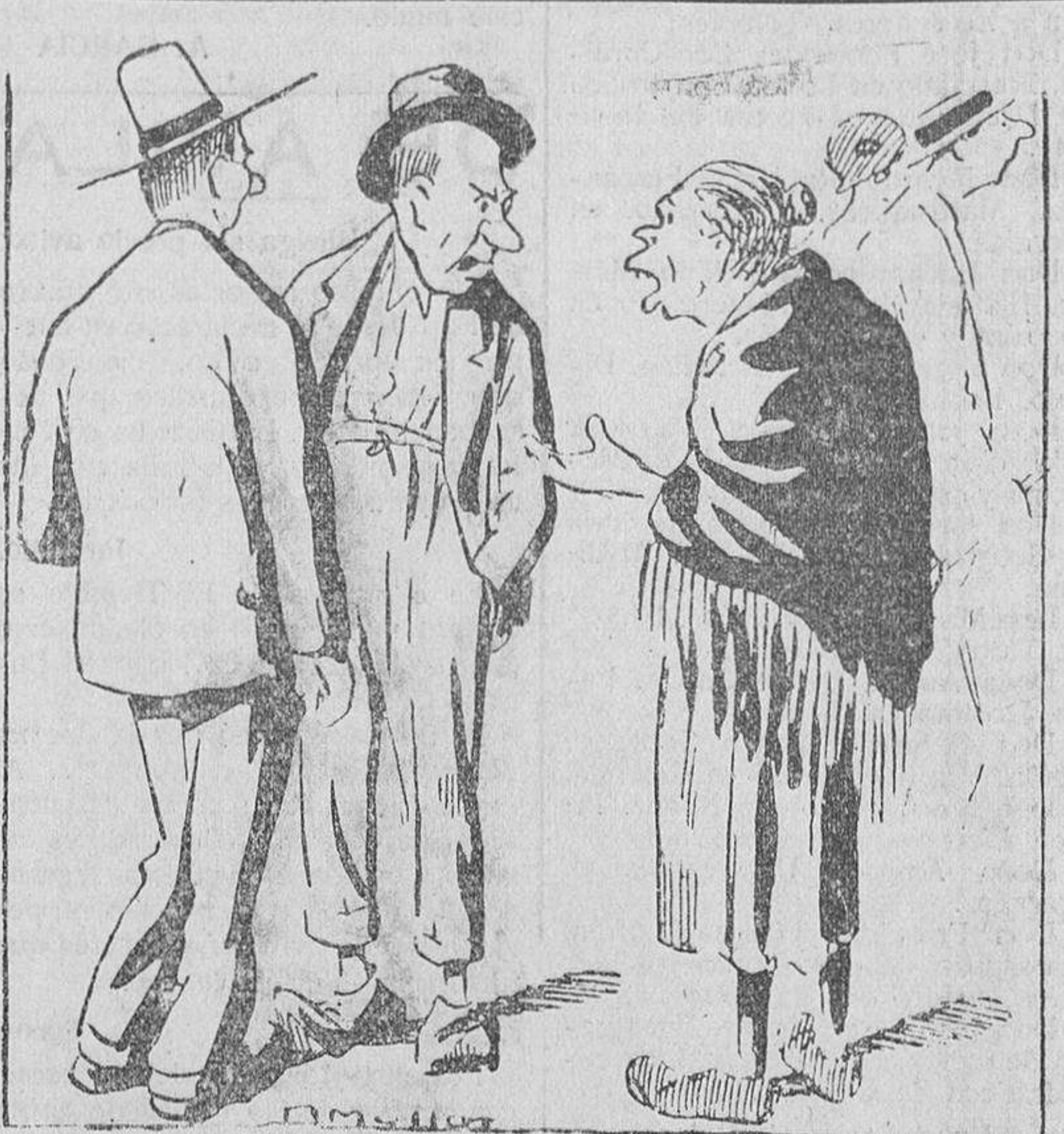
—A mí me llevará usted más barato que a nadie, ¿verdad, doctor? Porque yo soy quien ha traído las viruelas a este barrio.

El quebranto principal en este orden lo experimenta el Perú por la reducción del precio del cobre en el transcurso de la crisis económica mundial. La exportación de cobre peruano en barras fué en los cinco primeros meses de 1929 de 17.000.000 de kilos, y en igual período de este año sólo ha supuesto 5 millones. Y en cuanto al valor, la cifra correspondiente ha bajado de 21 millones de soles a poco más de 2 millones y medio.