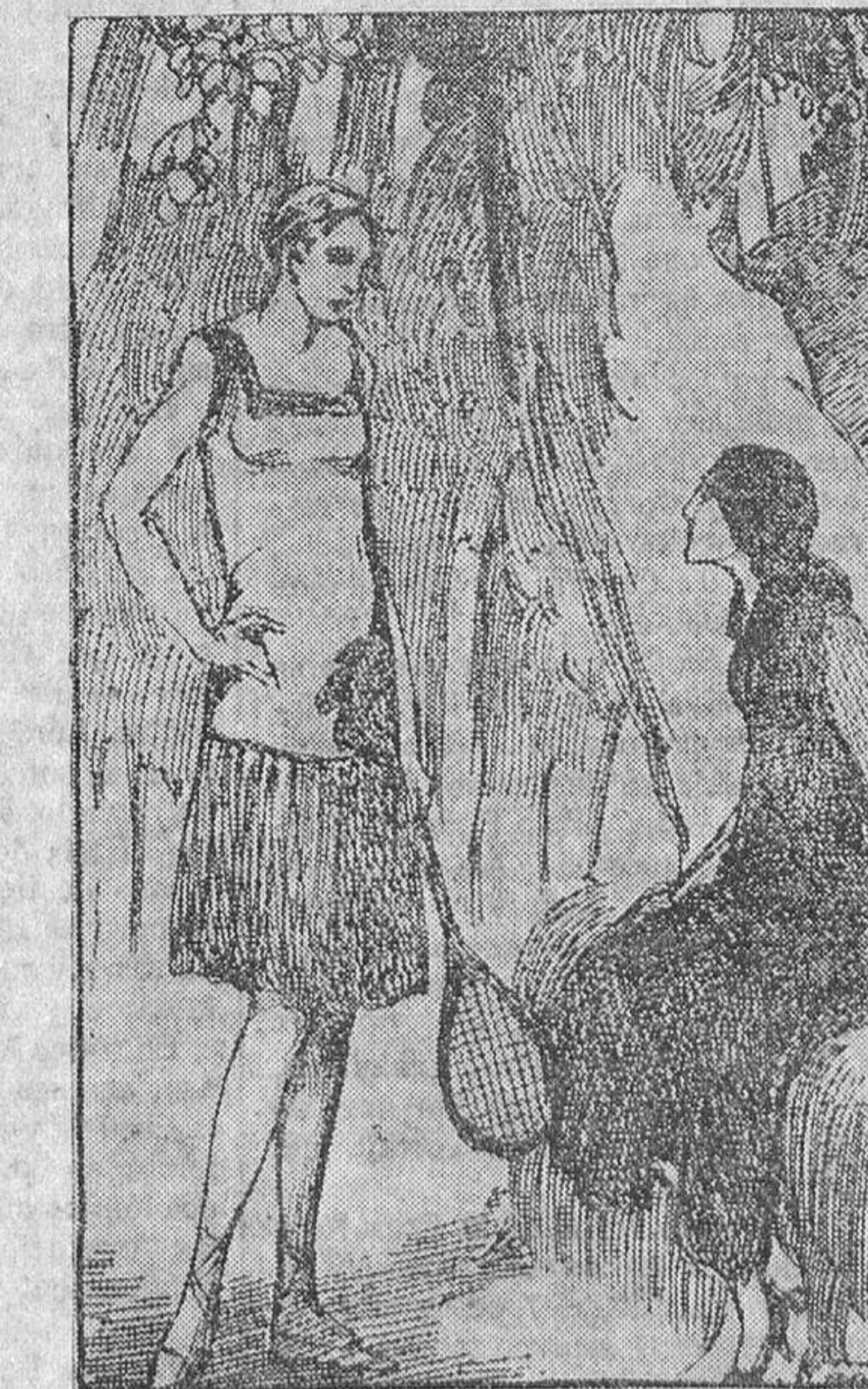
Se desasí violentamente del brazo de Jacobina, y sin fuerza para luchar, se dejó caer en un banco de césped

—Estes usted muy impulsiva, Graciela; comprendo que es duro lo que la digo, pero en su interés y en el de César está que seamos amigos; es muy sensible que, al lle-