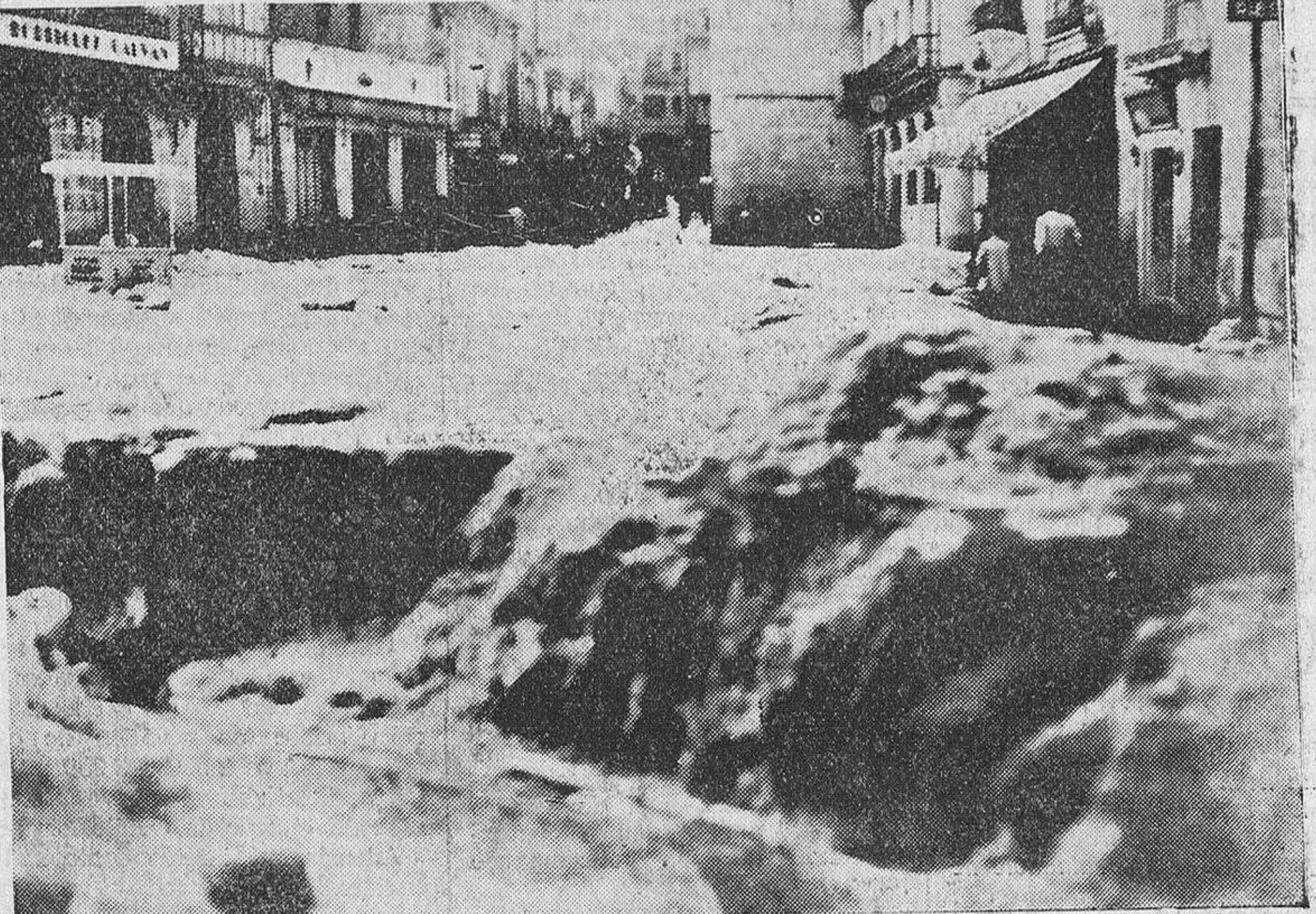
La Plazuela del Teatro Liceo

fueron cubiertas las ruedas por el granizo. Desde este parador, hasta el final de la calle, el granizo se acumuló en enorme cantidad, imposibilitando el tránsito. También se hizo precisa la intervención de fuerzas de la Guardia civil e Ingenieros y personal muni-