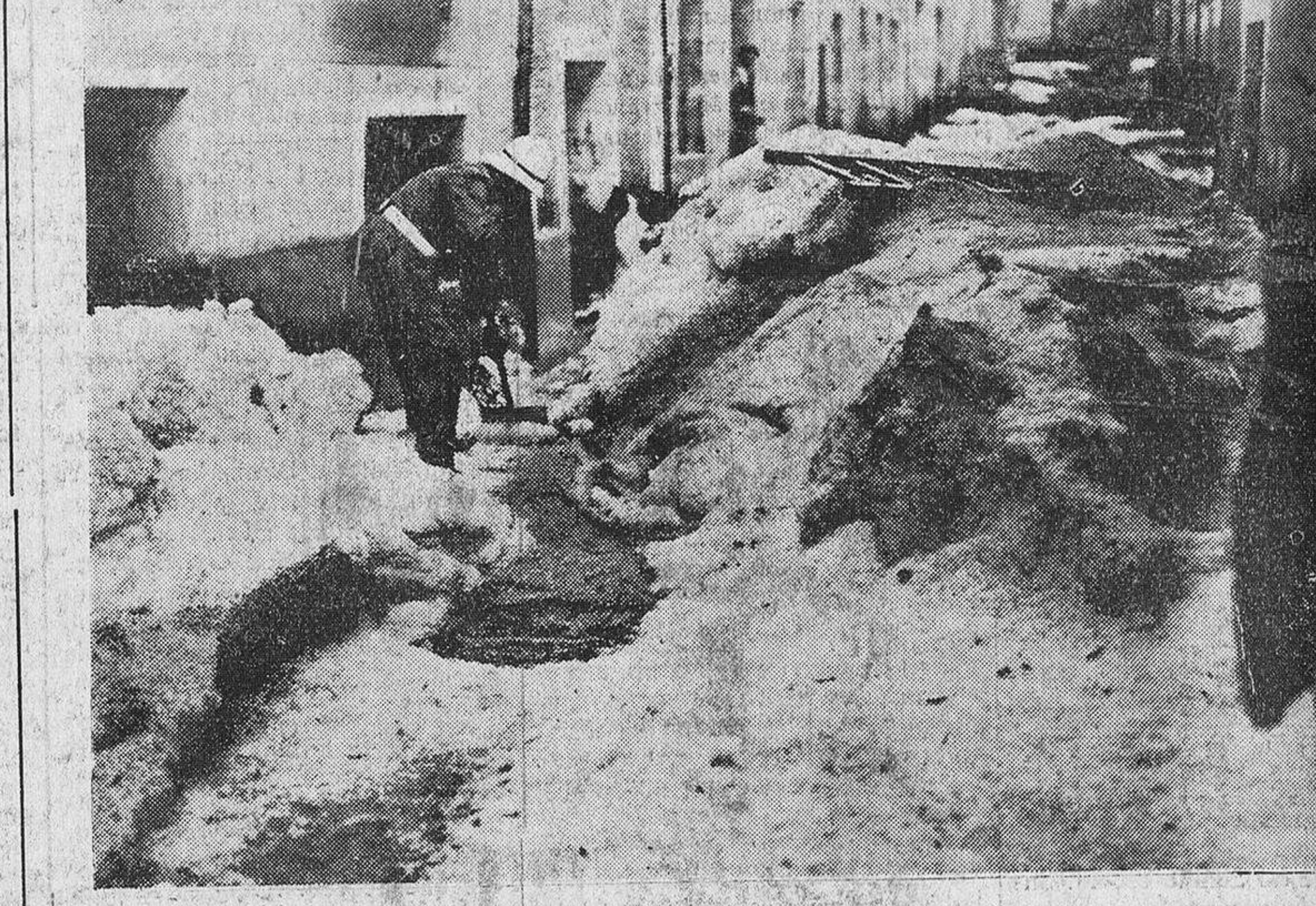
La calle de Bordadores

A su hijo Fidel se le apreciaron heridas y erosiones en ambos brazos.