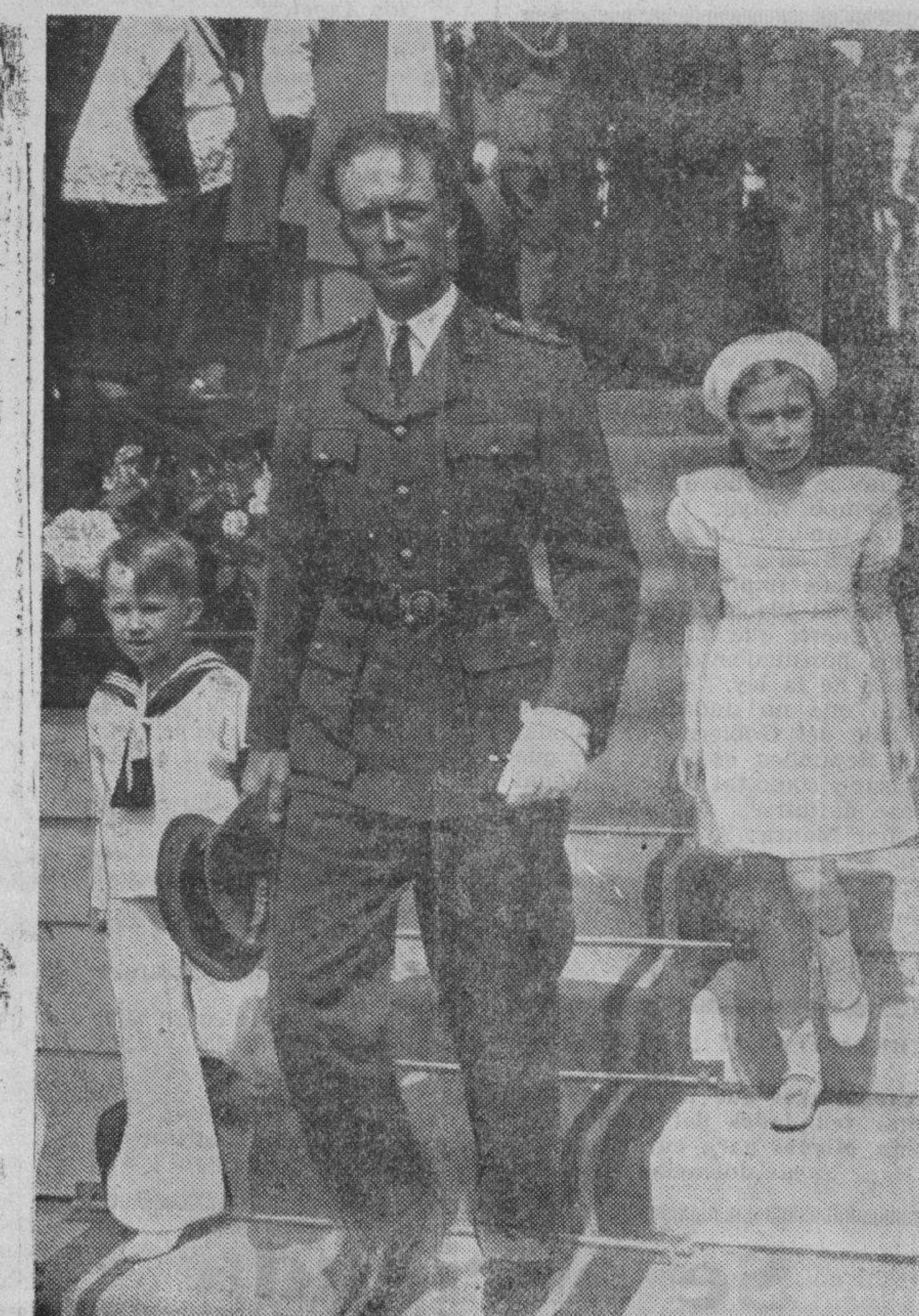
LA SITUACION POLITICA EN BELGICA El rey Leopoldo de Bélgica, aclamado por la muchedumbre con motivo de la reciente victoria de los rexitas belgas, acompañado de sus dos hijos mayores, la princesa Josefine Charlotte y el príncipe heredero Baudouin