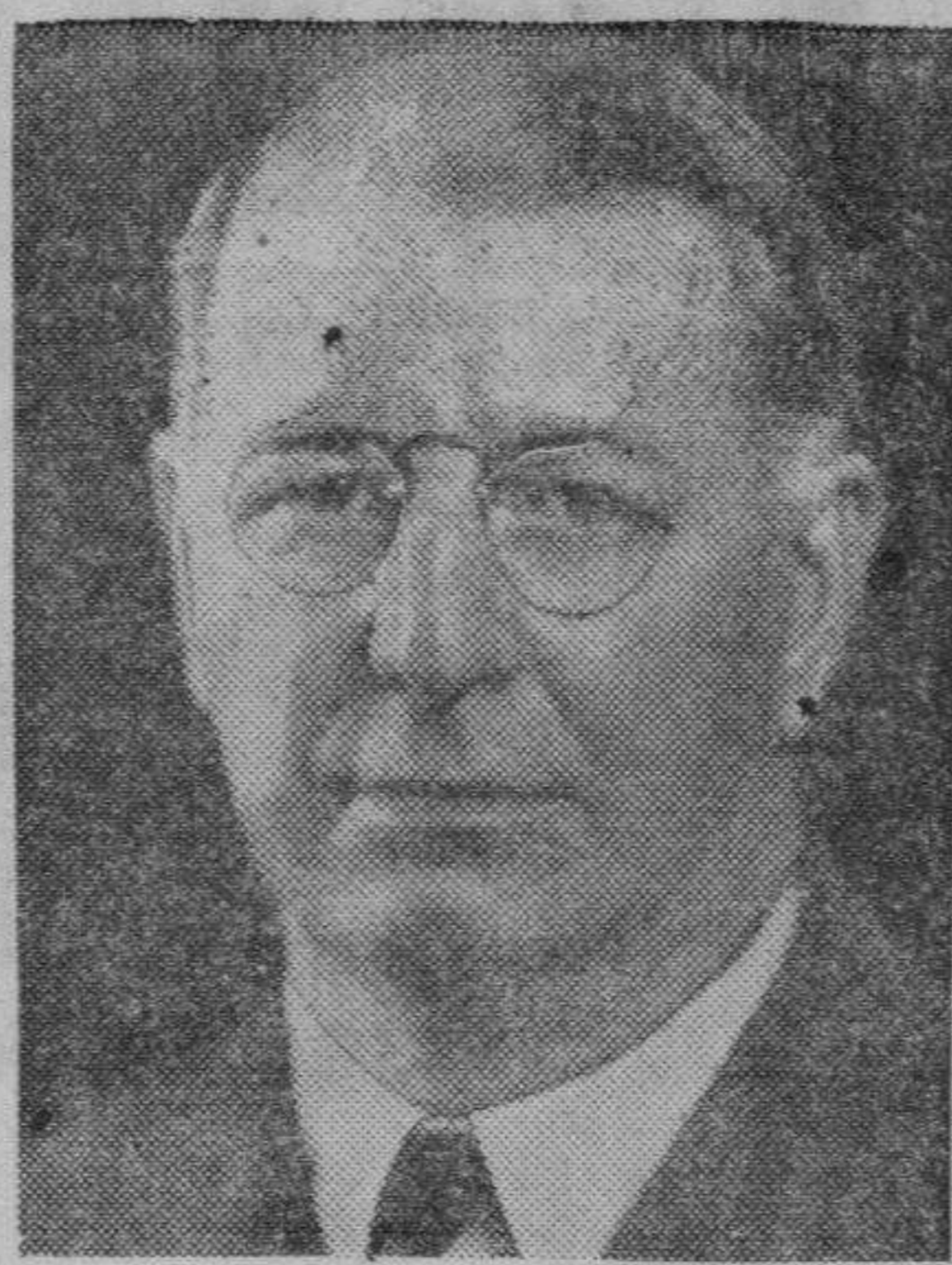
FRANK KNOX Candidato al puesto de vicepresidente de los Estados Unidos