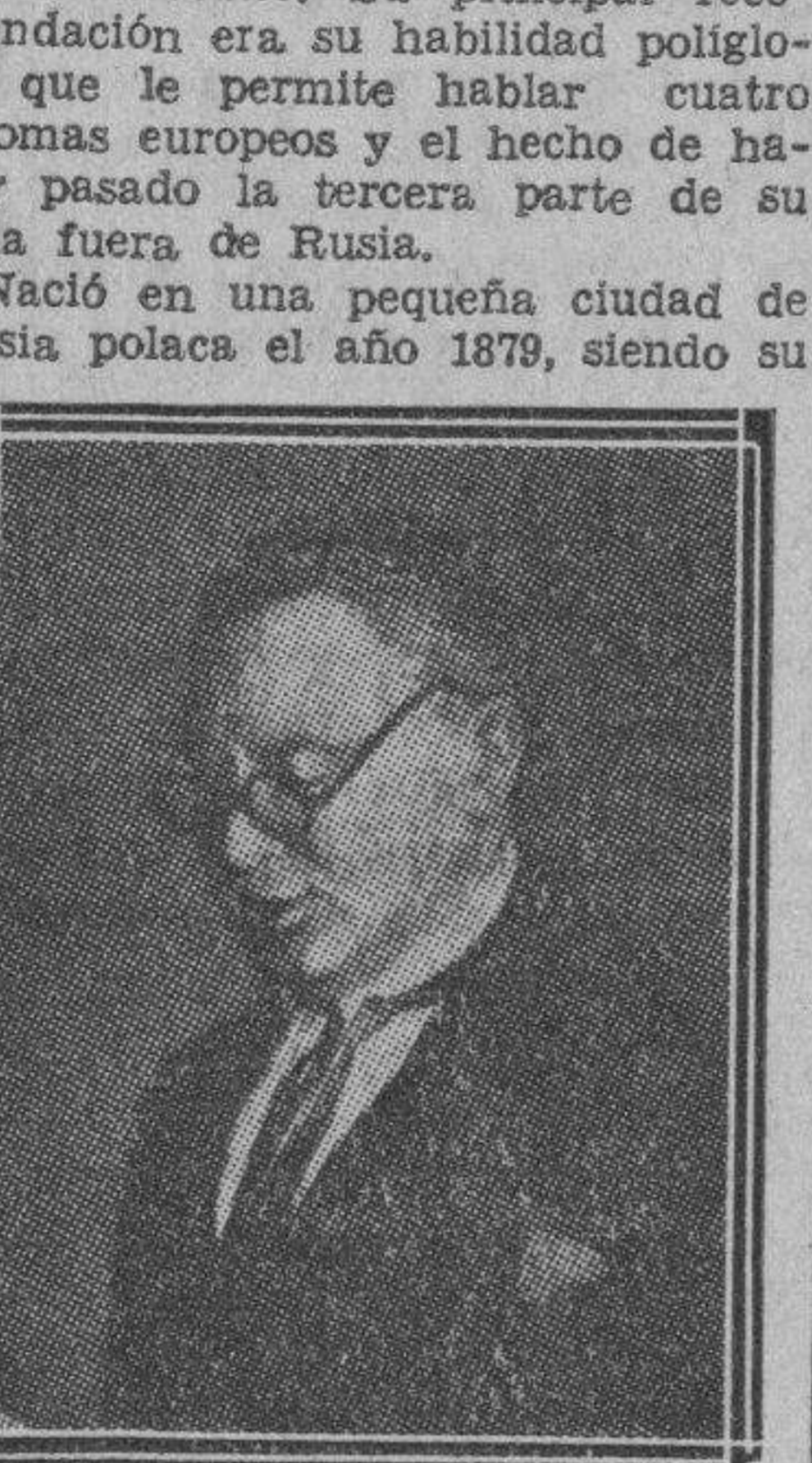
Maximo Litvinoff, el Comisario de Negocios Extranjeros de la Rusia Sovietica