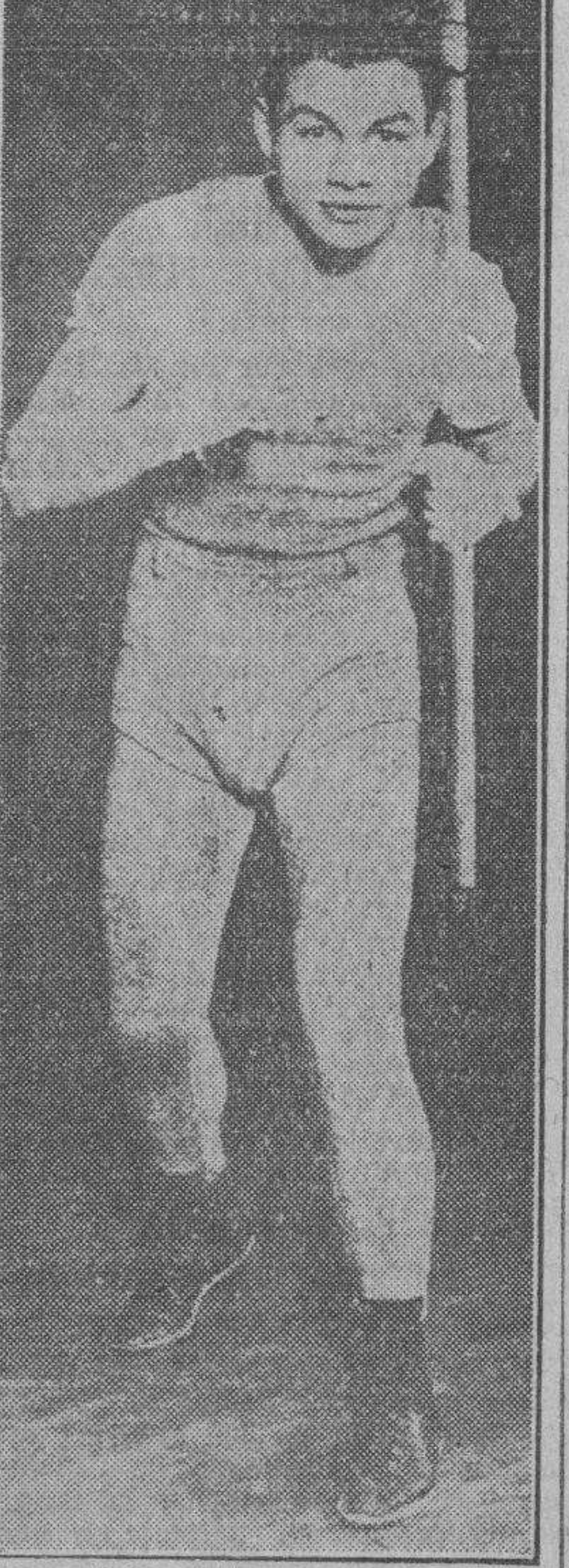
EL CONTRARIO DEL KID Tony Canzonero, popular pugilista que en la noche del 24 próximo se enfrentará con Kid Chocolate en el ring del Madison Square Garden, en New York.